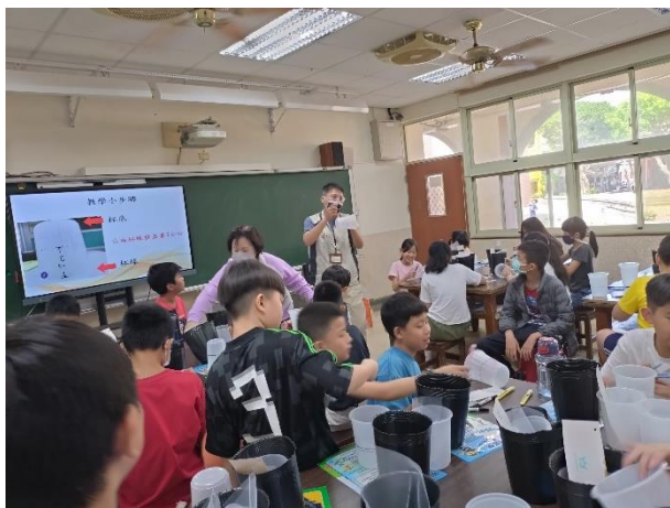
學生按步驟製作誘捕桶。