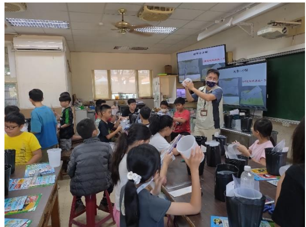
講師說明誘捕桶製作的注意事項。