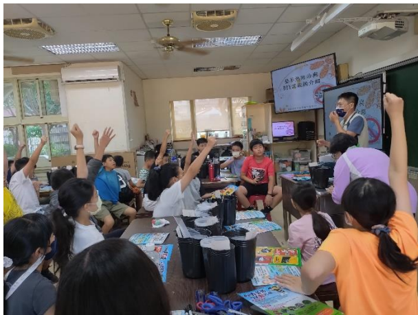
學生認真回應講師的提問。