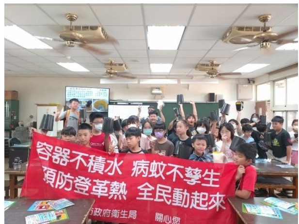
預防登革熱，人人有責。