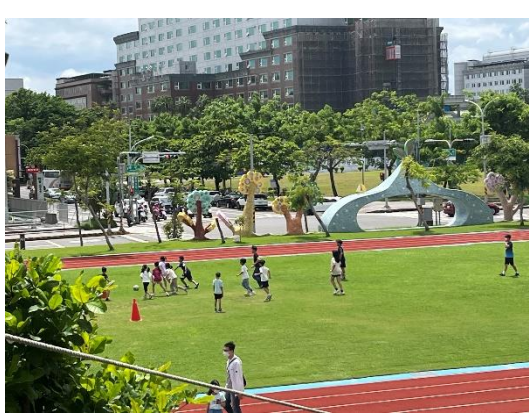
暑假期間外借場地舉辦足球營隊