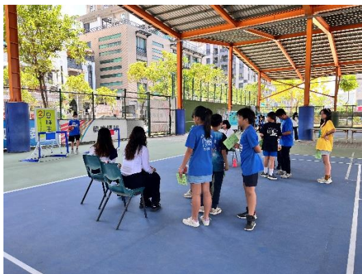
結合運動與雙語的闖關活動