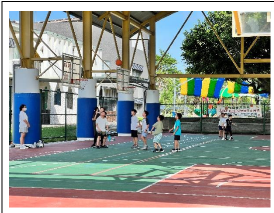
寒暑假期間校外安親班到校運動