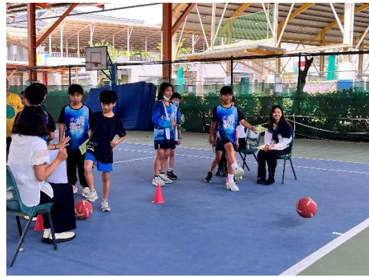
結合運動與雙語的闖關活動