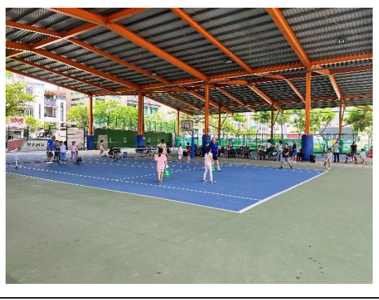
暑假辦理體育性社團