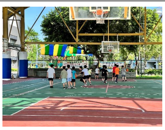
寒暑假期間校外安親班到校運動