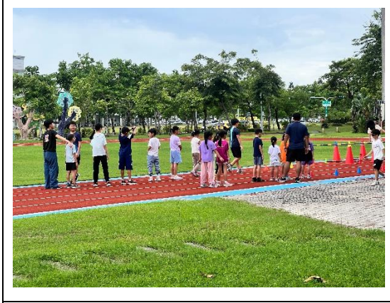
暑假辦理體育性社團