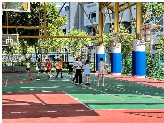
寒暑假期間校外安親班到校運動