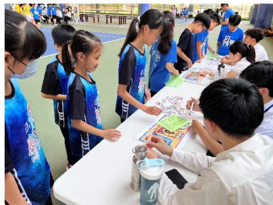
結合運動與雙語的闖關活動