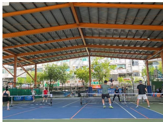
暑假期間外借場地舉辦匹克球比賽