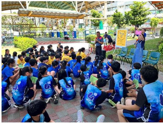
與台南大學合作舉辦活動