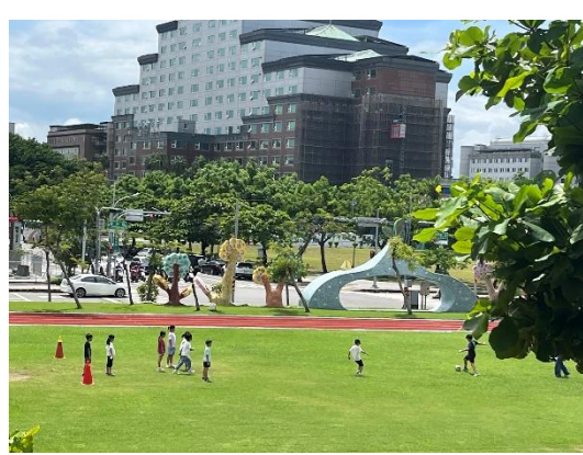
暑假期間外借場地舉辦足球營隊