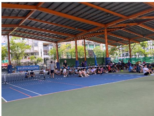
暑假期間外借場地舉辦匹克球比賽