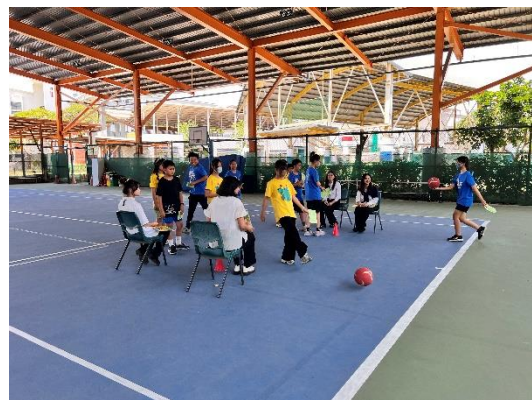
結合運動與雙語的闖關活動