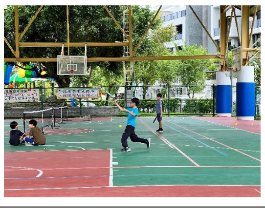
暑假辦理體育性社團