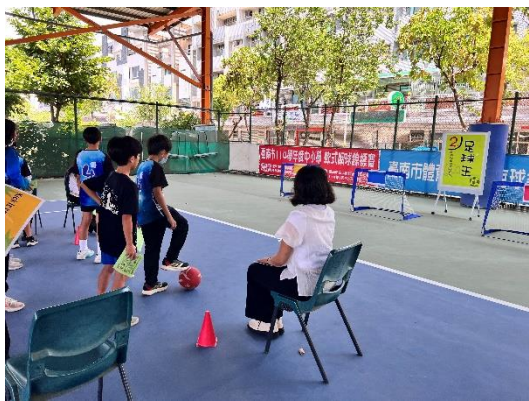
結合運動與雙語的闖關活動