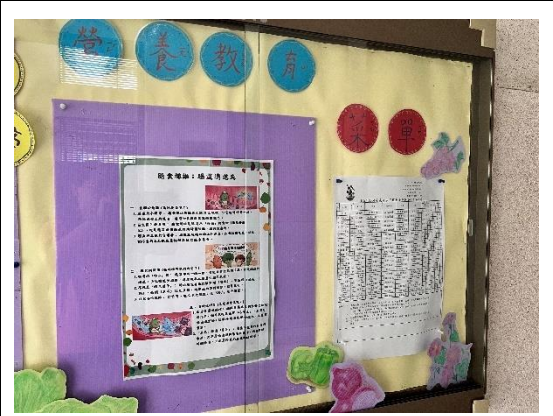
廚房佈告欄張貼營養飲食教育資訊