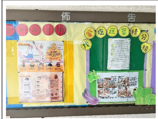
廚房佈告欄張貼營養飲食教育資訊