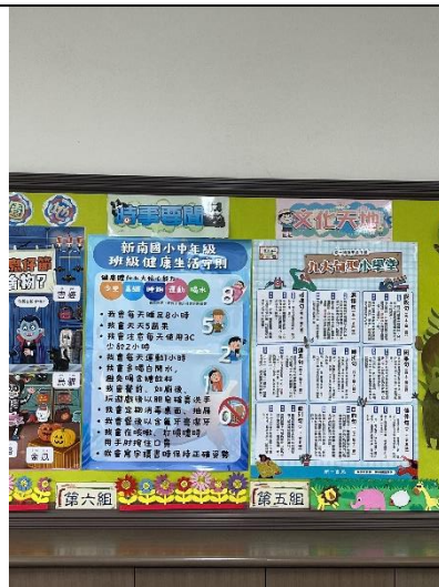
班級張貼健康生活公約(中年級)