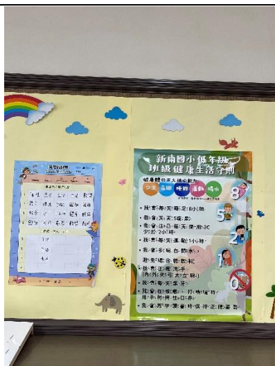
班級張貼健康生活公約(低年級)