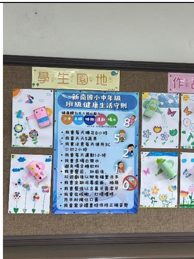
班級張貼健康生活公約(中年級)