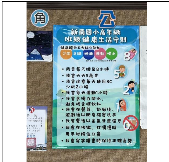
班級張貼健康生活公約(高年級)