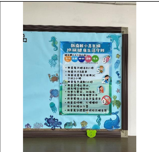
班級張貼健康生活公約(高年級)