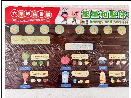
佈告欄張貼六大類食物布置