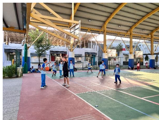
教師下課時間和同學一起運動