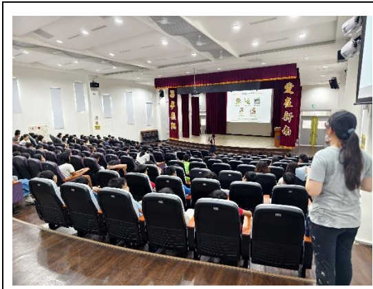
期初友善校園-反自殺宣導