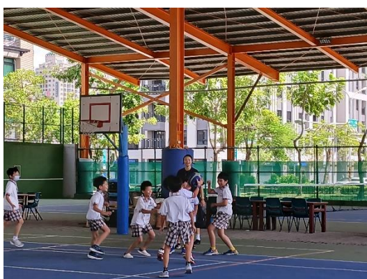
教師下課時間和同學一起運動