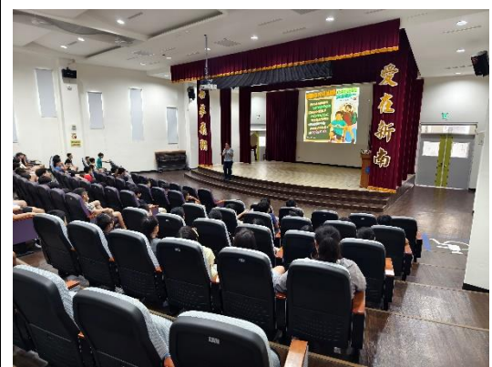
期初友善校園宣導