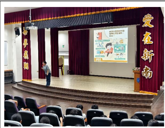
期初友善校園-反霸凌宣導