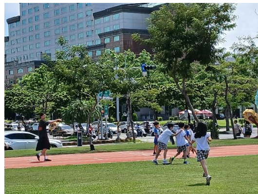
教師陪學生跑操場