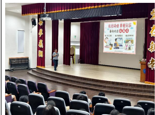
期初友善校園-反霸凌宣導