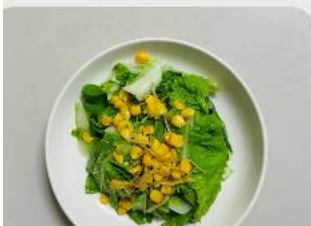
蔬菜 薑炒尼龍白菜