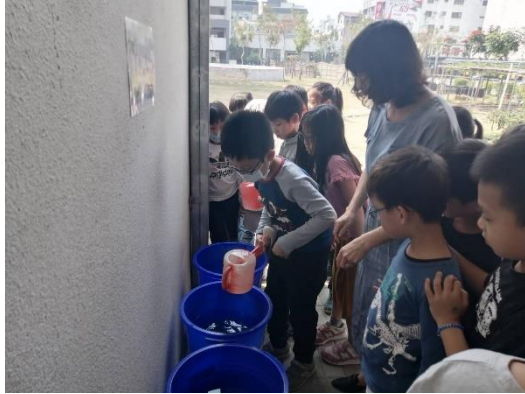
洗米洗菜水回收再利用