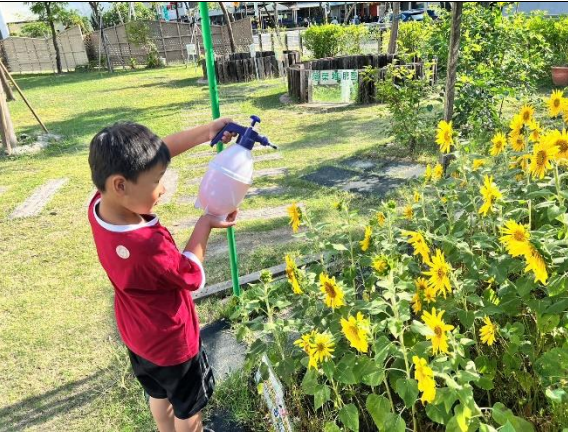
說明：學生噴灑辣椒水，天然防蟲