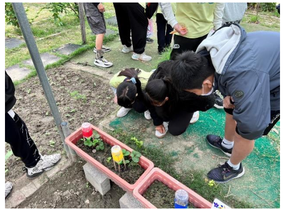
說明：學生於自然課到農園觀察植物