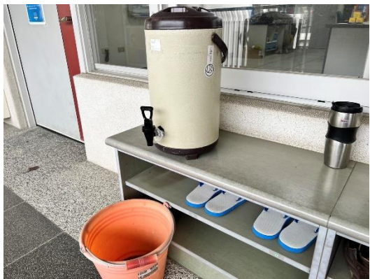
校內研習使用桶裝茶飲