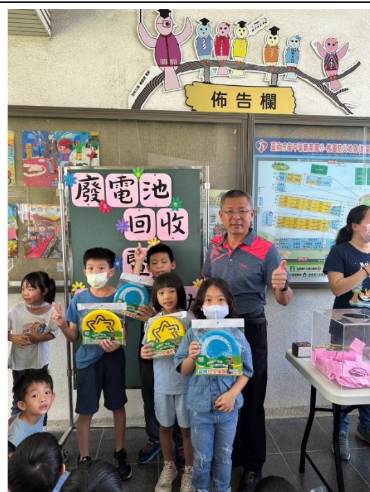
廢電池回收摸彩活動