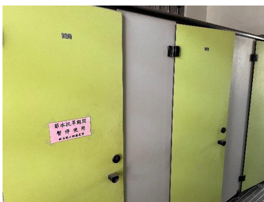
節水期間減少廁所使用隔間