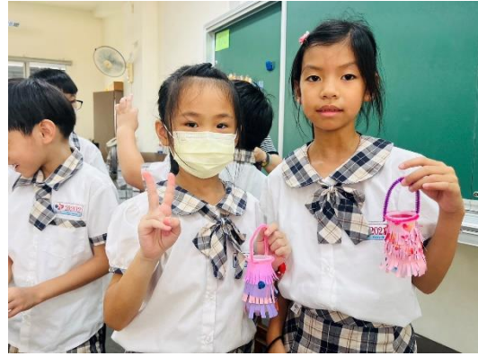
結合美勞課-養樂多空瓶創意小燈籠