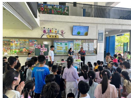
廢電池回收摸彩活動