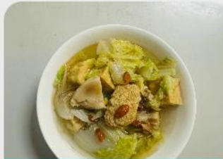
湯品 素麻油四寶湯