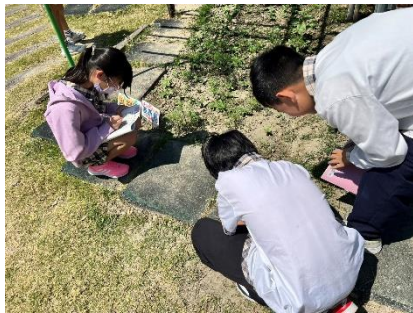
說明：學生到農園觀察並記錄