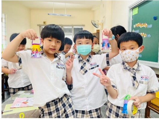
結合美勞課-養樂多空瓶創意小燈籠