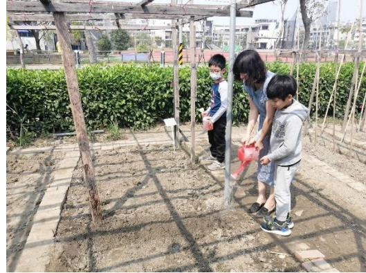
洗米洗菜水回收再利用