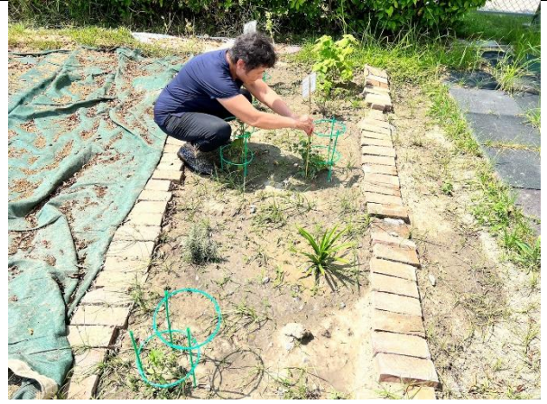
說明：大廚種植多種香草