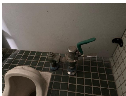
加裝省水沖水裝置