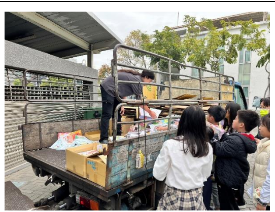
全校期末大掃除回收