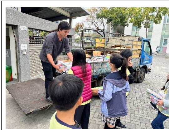
全校期末大掃除回收