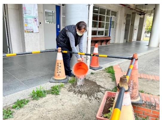
飲水機廢水回收再利用