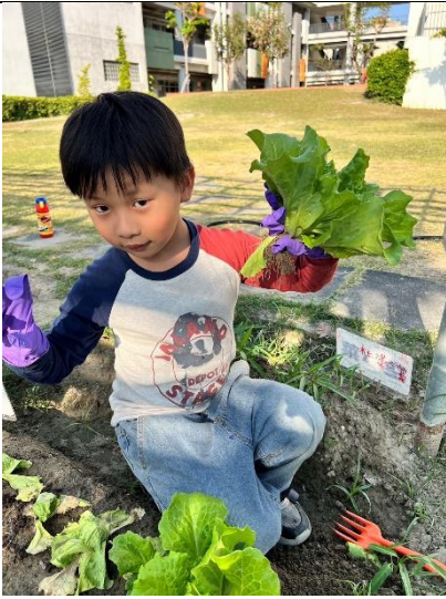
說明：學生採收大陸妹