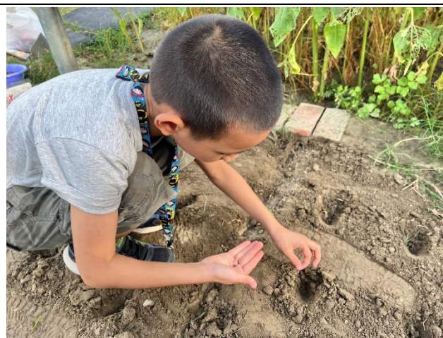
說明：學生嘗試整地與除草