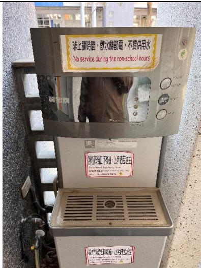
張貼節約用水告示