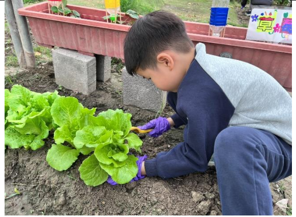
說明：學生採收大陸妹