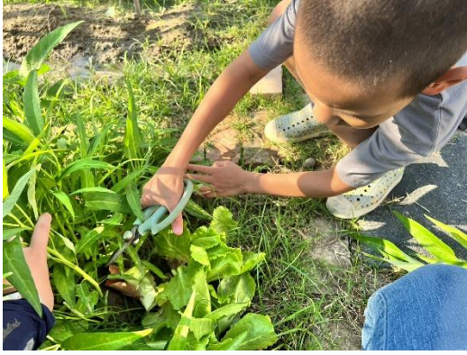
說明：學生採收空心菜