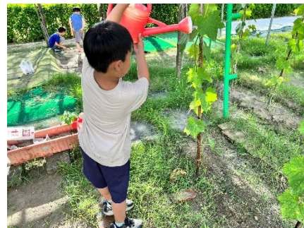
說明：學生幫絲瓜澆水