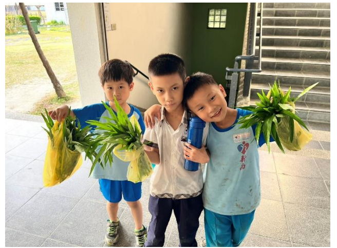
說明：收穫滿滿真開心