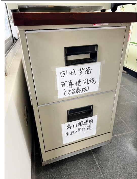
背面紙回收再利用