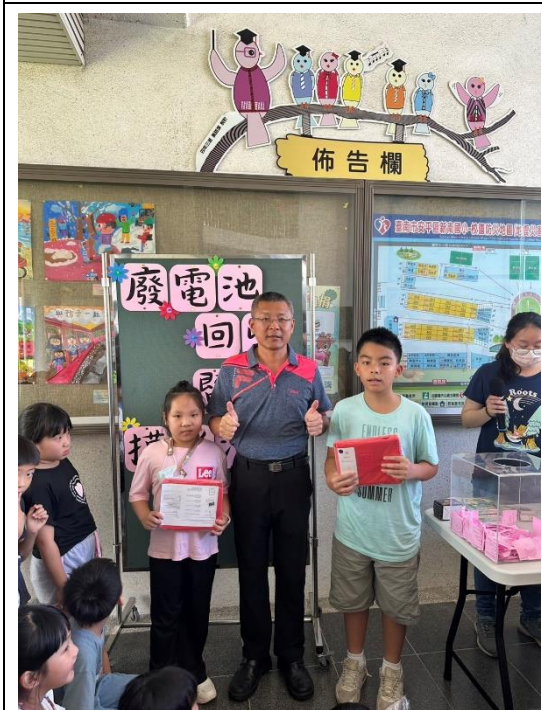
廢電池回收摸彩活動