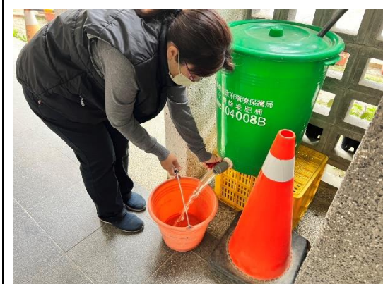
飲水機廢水回收再利用