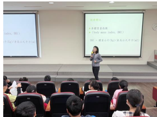
營養師說明 BMI 的計算方法