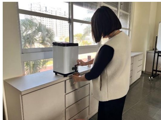
校內研習使用桶裝茶飲