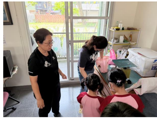
廢電池回收兌換摸彩券