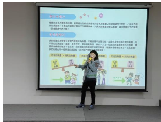
營養師說明體重與體位的概念