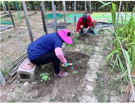
說明：志工協助整理農園環境