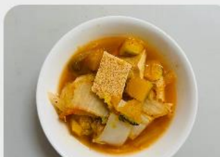
湯品 素泡菜豆腐湯