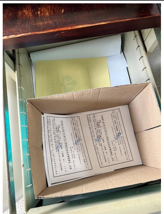
背面紙回收再利用