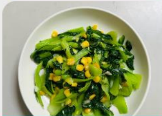
蔬菜 青江黑珍珠菇