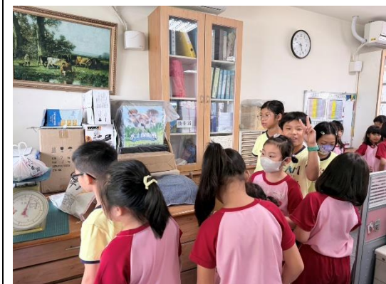
廢電池回收兌換摸彩券