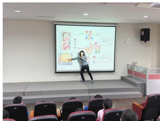
以圖示說明體位適中的重要性