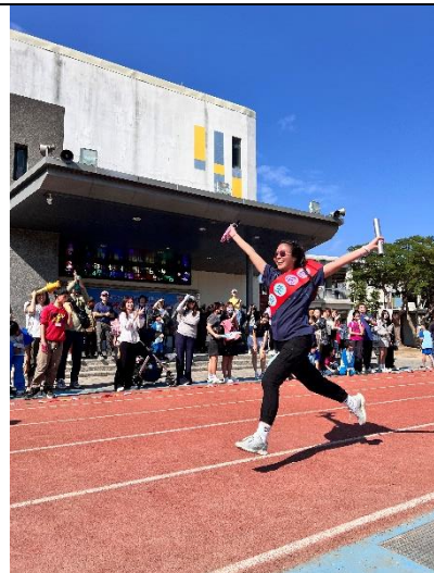
由校長帶領同仁參加校慶運動會 校友組大隊接力