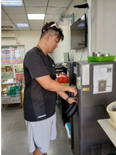
教師平時喝足白開水