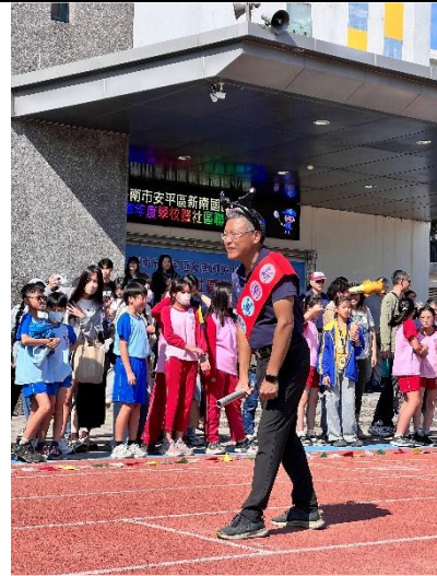
由校長帶領同仁參加校慶運動會 校友組大隊接力