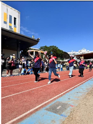
由校長帶領同仁參加校慶運動會 校友組大隊接力