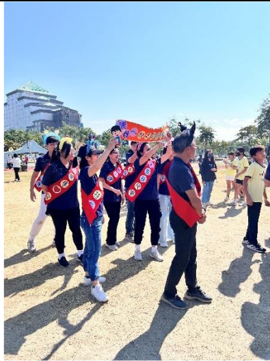
由校長帶領同仁參加校慶運動會 校友組大隊接力