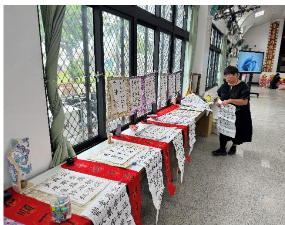
說明：於活動中心佈置優良作品