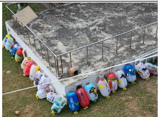
說明：彩繪燈籠展示於校園