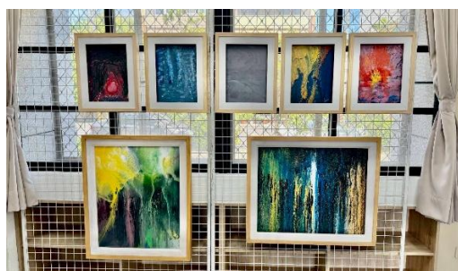
說明：營造藝術氣息的學習環境。