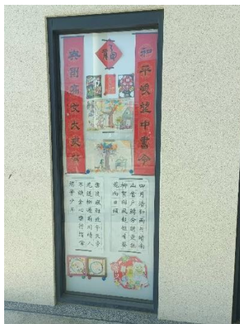
說明：張貼學生精美書法作品。