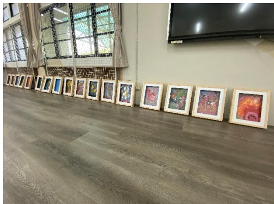
說明：陳列學生繪畫作品。