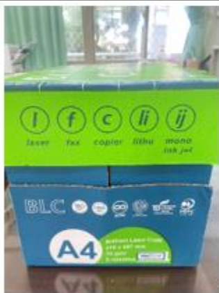
使用環保影印紙張