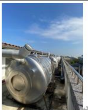
中水處理系統提供南北棟廁所沖洗用水