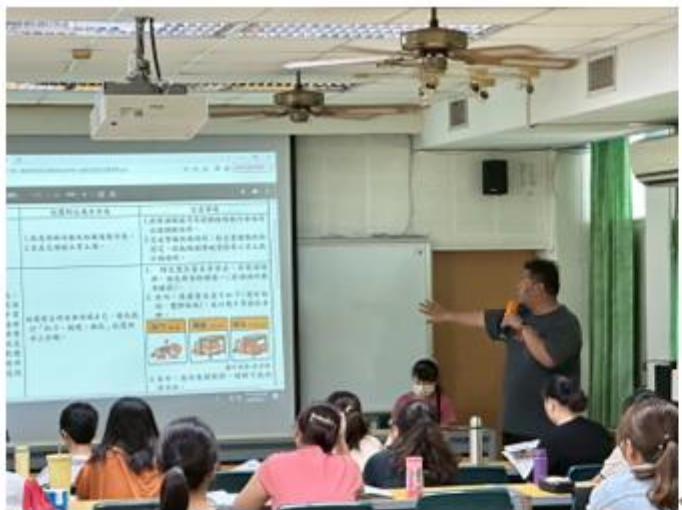
導師會報使用環保杯。◀