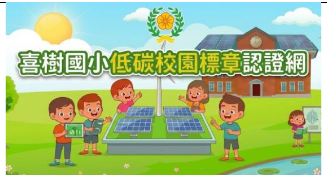
低碳示範校園標章-資源循環