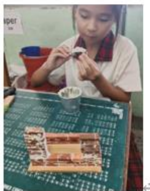
學生運用傳統三合土工法，以蚵灰、糖水與糯米汁製作古早窗屋模型，傳承台灣先民智慧。