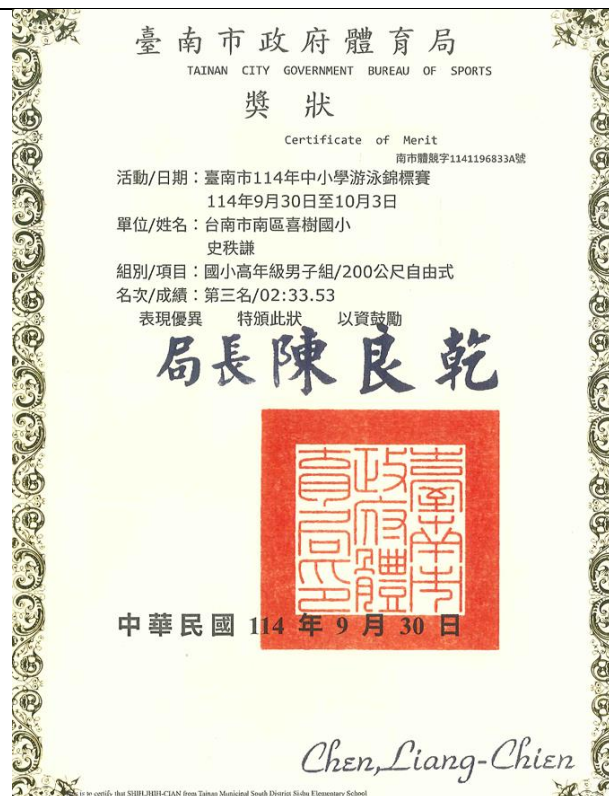
114 中小學游泳錦標賽