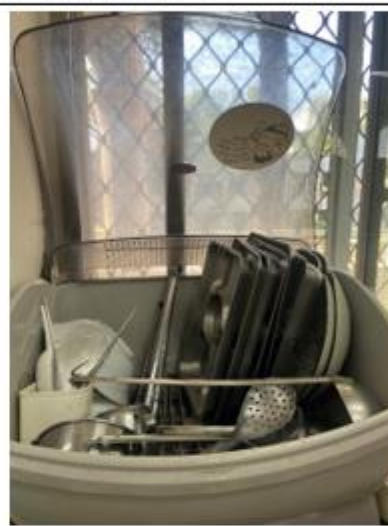
辦公室行政人員午餐使用餐具。