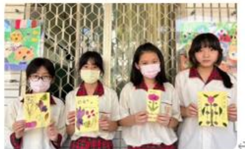
學童巧手將自然花卉壓製成精美書籤，展現環保創意與藝術美感。