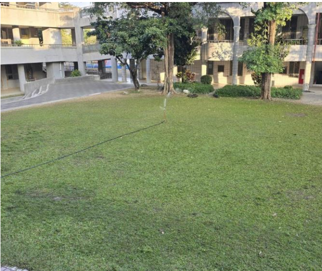
綠意盎然大草原，可舒緩疲勞眼睛

https://sites.google.com/view/sspsgasc/%E9%A6%96%E9%A0%81