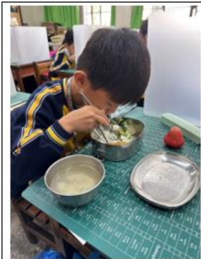
教師用及學生用午餐用具，皆使用餐具。