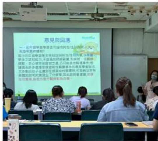
研習宣導事項，運用電子檔方式討論。