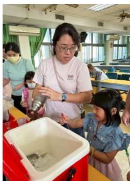
家長與小朋友製作飲料重複使用杯具。◀