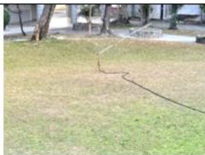
兩水收集系統：於學校南棟及北棟教室設置集雨管，提供各班平日澆灌班級花台使用。