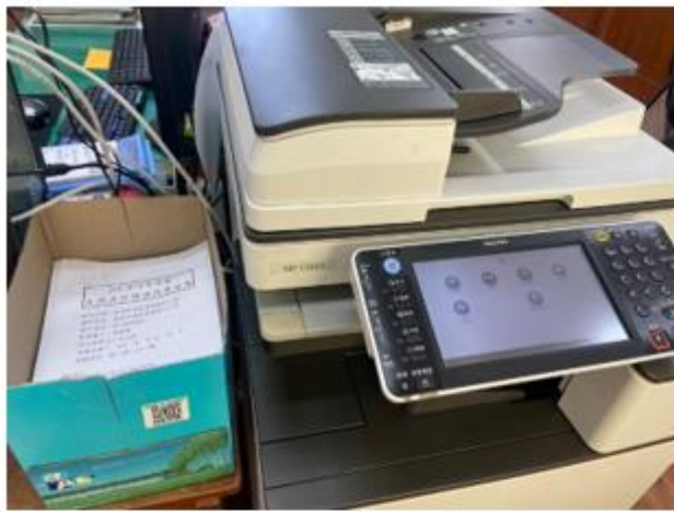
影印機旁提供背面空白紙張提供使用