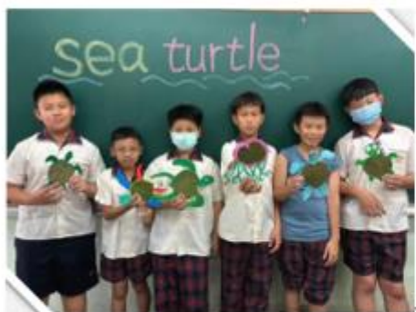
將回收紙板轉化為精美海龜造型明信片，賦予廢棄物藝術新生命。