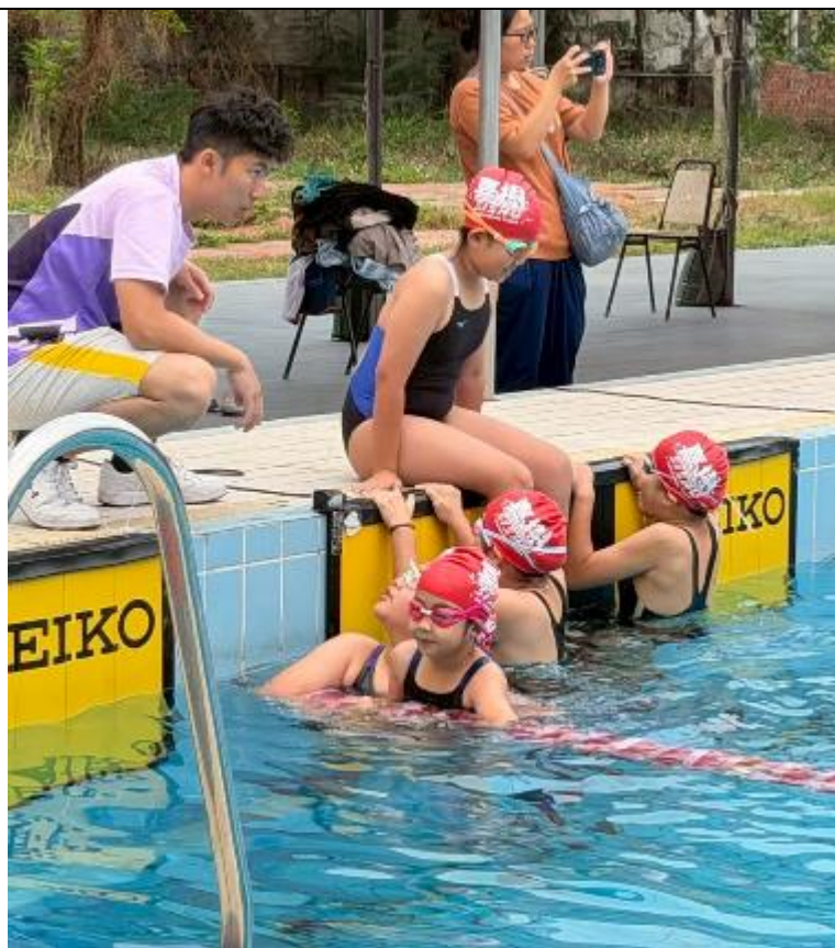
說明：喜樹國小游泳隊比賽休息區