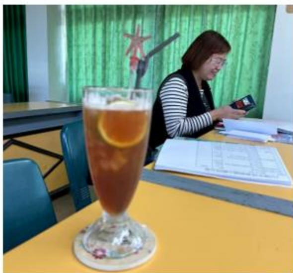
運用玻璃杯裝調飲，避免使用一次性材料。◀