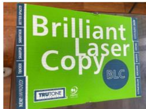
使用環保影印紙張