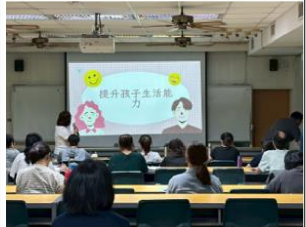
教師會報宣導事項，運用電子檔方式討論。