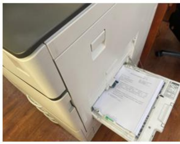
影印機旁提供背面空白紙張提供使用