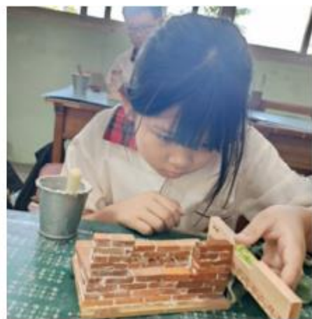
學童專注打造三合土紅磚小屋，循環利用蚵殼灰製作傳統建材，傳承台灣永續建築智慧。