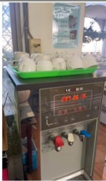
飲水機旁張貼無紙杯，請自備水杯等公告。