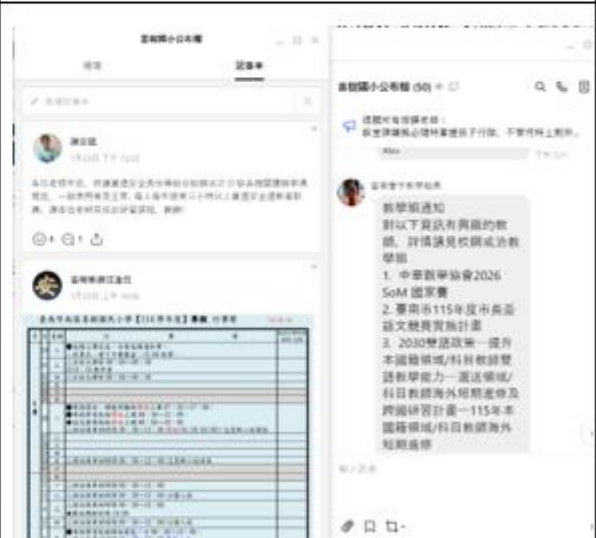
使用 line 群組公告校內相關事項及檔案減少書面布達