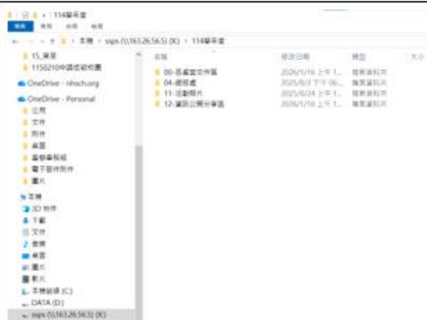
校內電子檔擺放共用雲端