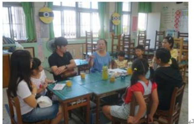
親師座談循環使用杯具。◀