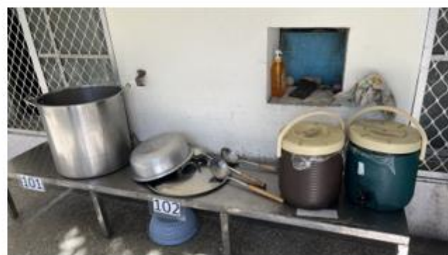
活動使用茶桶替代杯裝飲料。