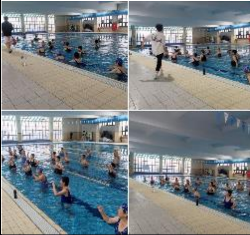
說明：樂齡學習中心-水中有氧。