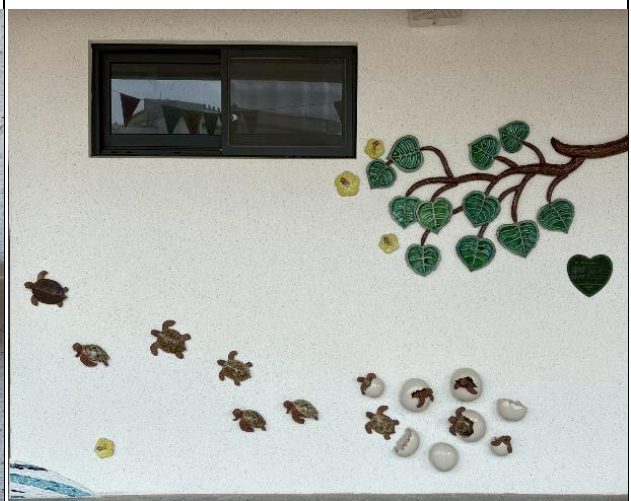
說明：幼兒園牆壁招募校外團體建造海龜。