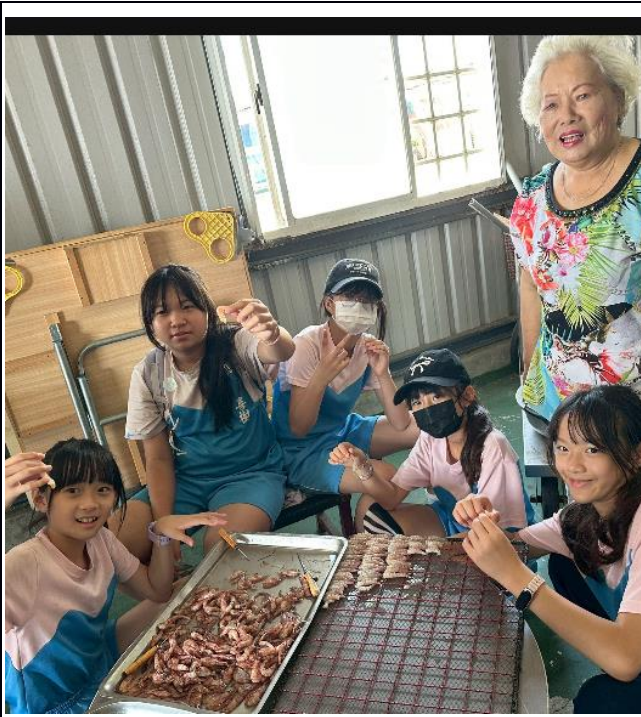
說明：戶外教育-海洋教育。