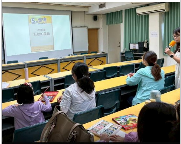
說明：志工招募校外團體。