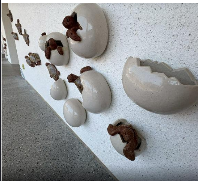
說明：幼兒園牆壁招募校外團體建造海龜。