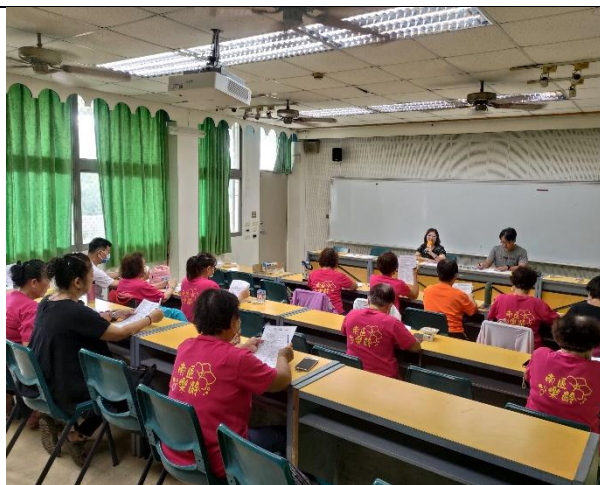
說明：樂齡學習中心會議。