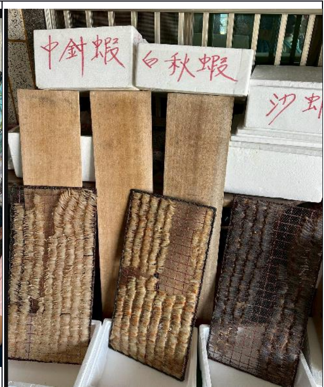
說明：戶外教育-海洋教育。