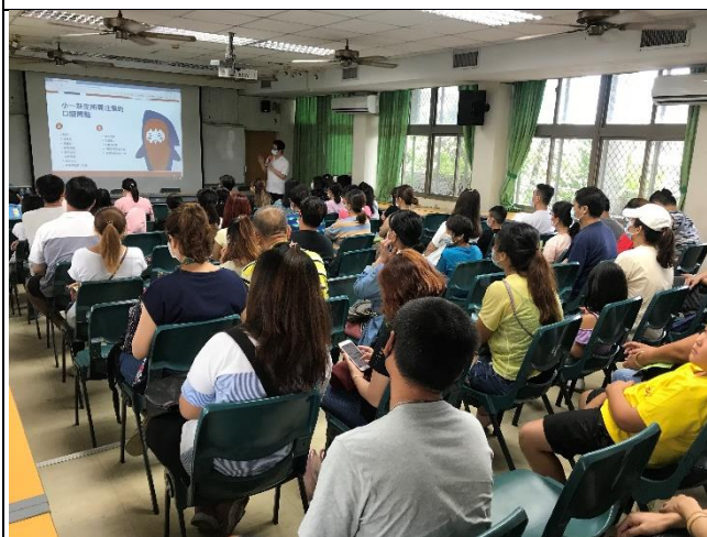
說明：邀請牙醫診所醫生。