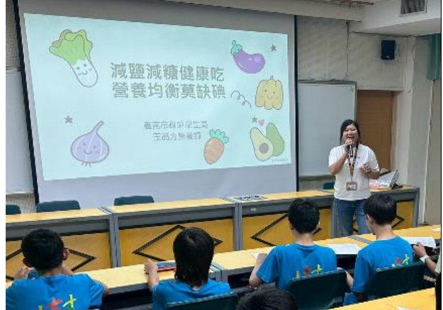
說明：南區衛生所入校飲食均衡。