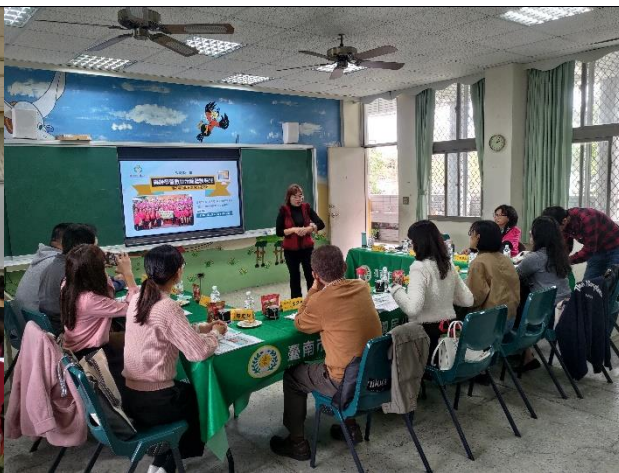
說明：樂齡學習中心會議。