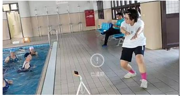
說明：樂齡學習中心-水中有氧。