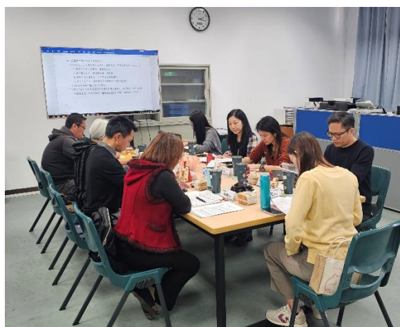
說明：戶海中心邀請里長。