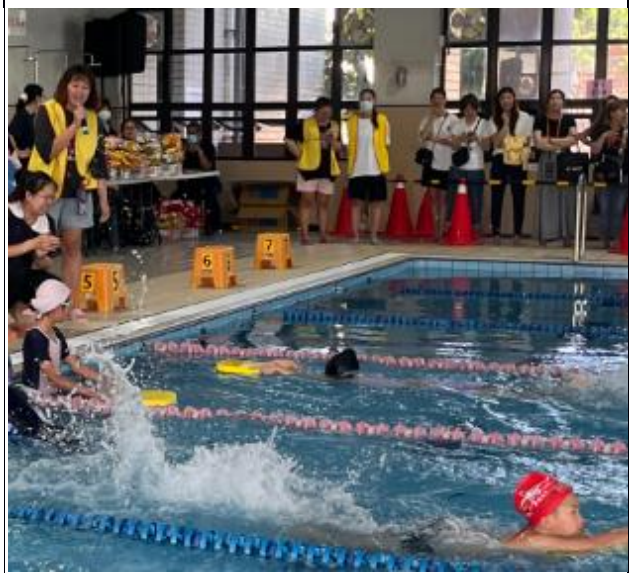
志工教職 工作名單