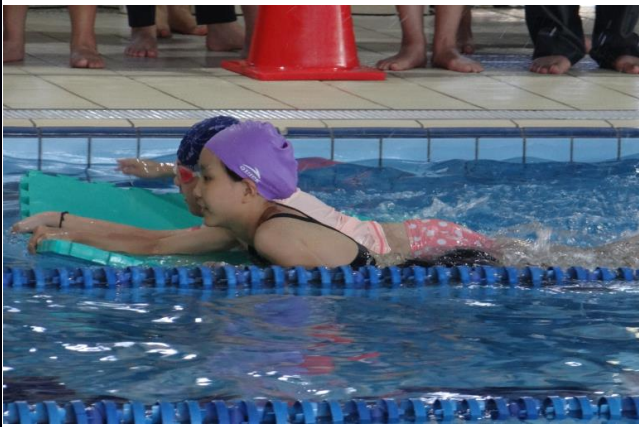
說明：中年級大浮板分組競賽。