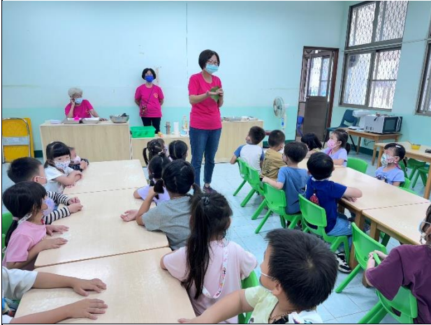
幼兒園-樂齡阿嬤來教我們做紅龜粿