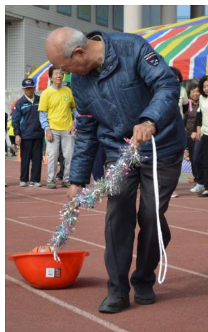
說明：運動會社區人士參加。