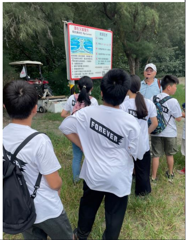
說明：黃金淨灘邀請當地社區人士解說。