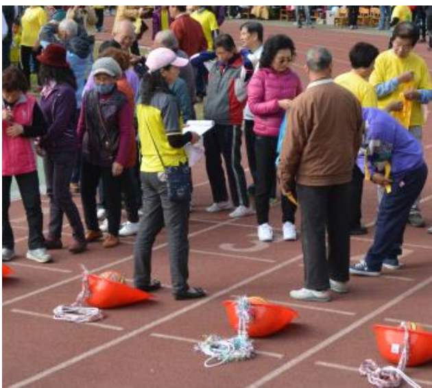
說明：運動會社區人士參加。