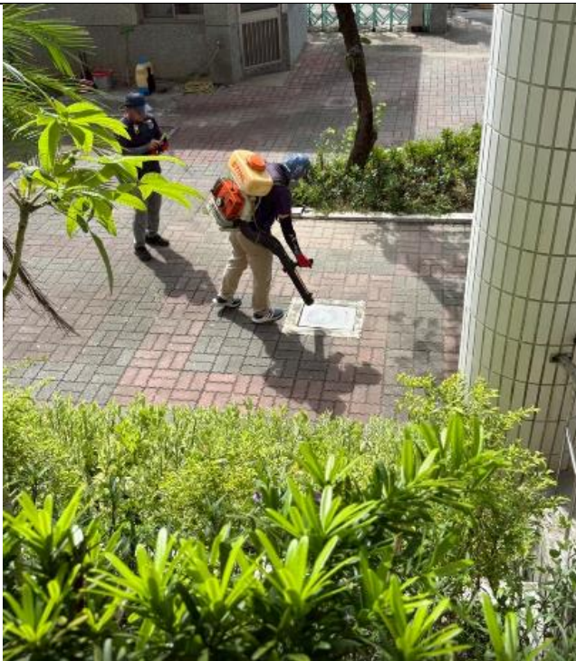
水溝蓋噴漂白水消毒