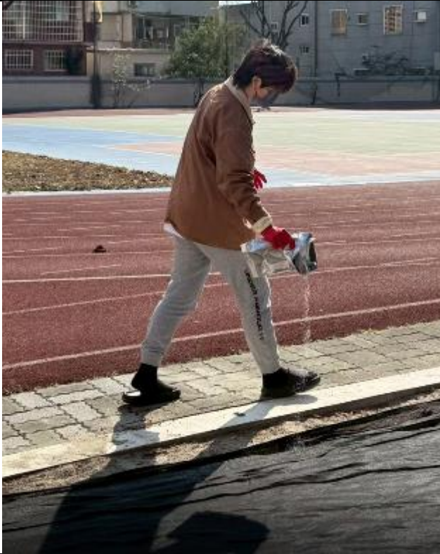
操場易積水處灑登革熱藥劑