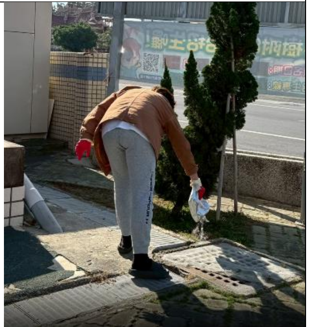
衛生組灑登革熱藥劑