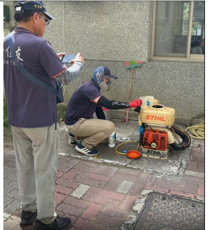
走廊噴漂白水消毒