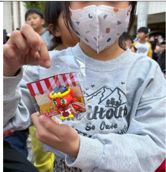
視力保健有獎徵答