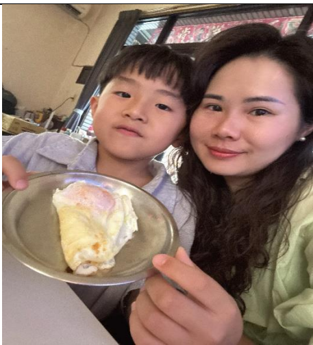
說明：將煎蛋送給媽媽品嚐