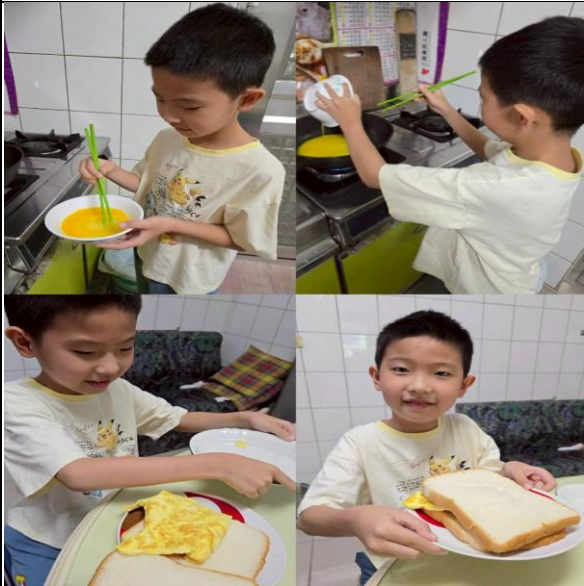
說明：學生完成吐司煎蛋