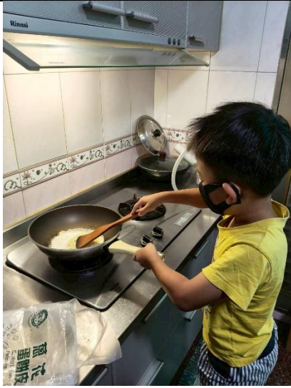
說明：學生第一次煎蛋