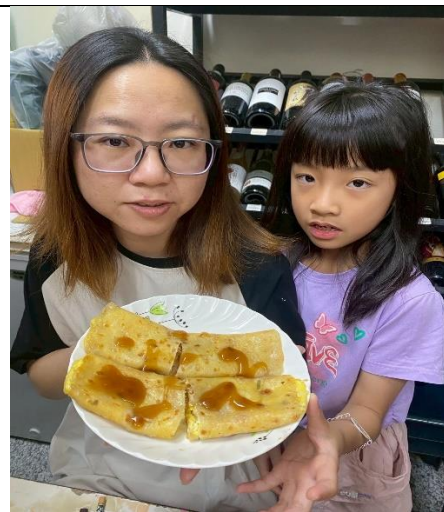
說明：做好蛋餅獻給媽媽祝她母親節快樂