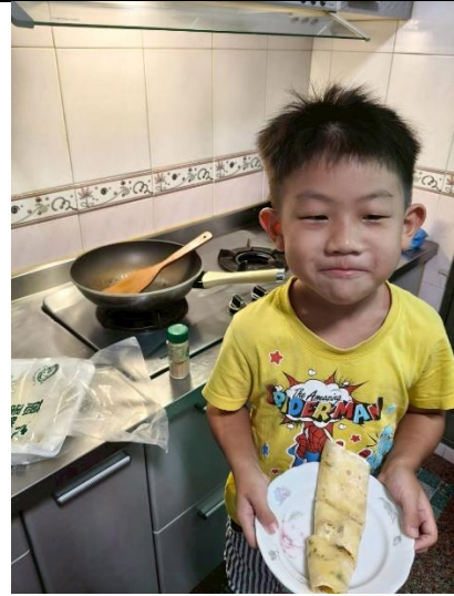
說明：學生第一次做蛋餅