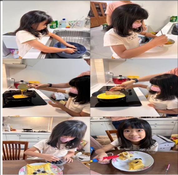
說明：學生設計做法國吐司並加上藍莓