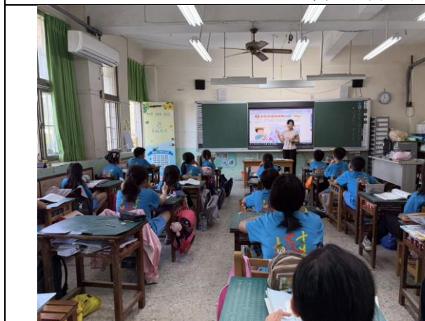
佐證資料(教案、教學過程紀錄等)