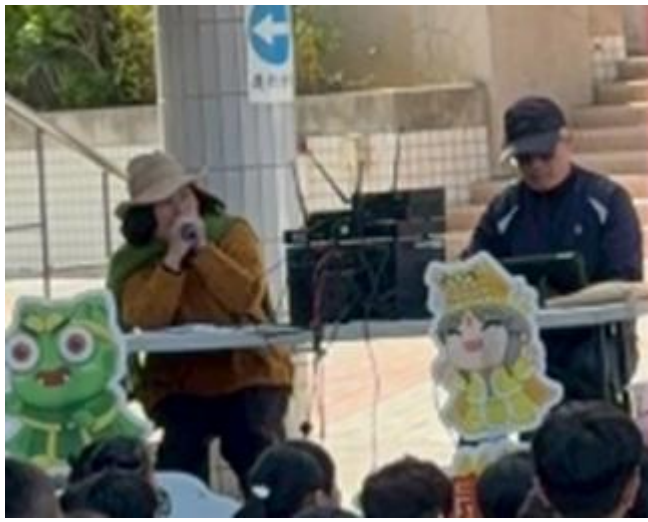
幕後功臣、配音+音效