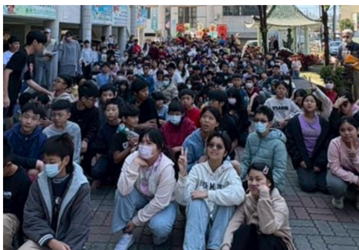
114 年度健康促進校園視力保健巡迴宣導活動申請