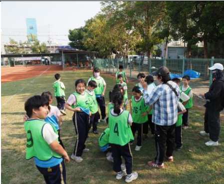
參加 115 年中小學普及化樂樂棒