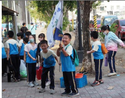
參加 115 年中小學普及化樂樂棒