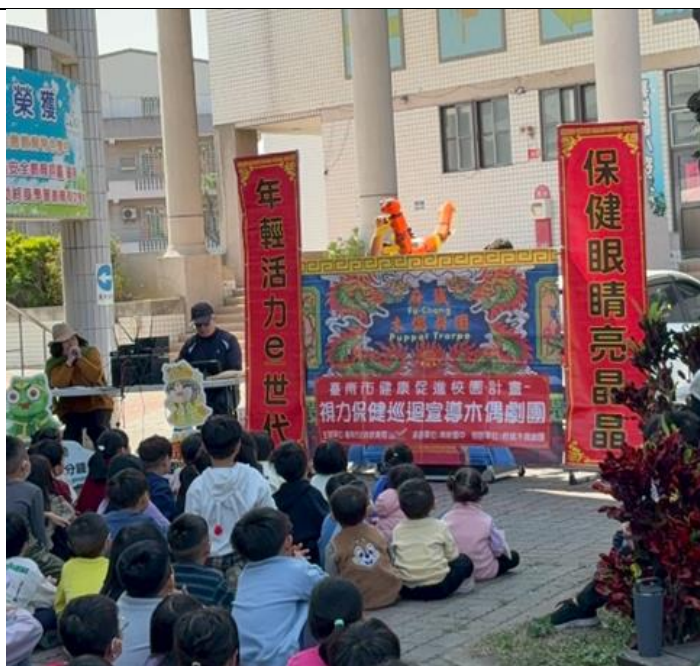
視力保健偶戲表演