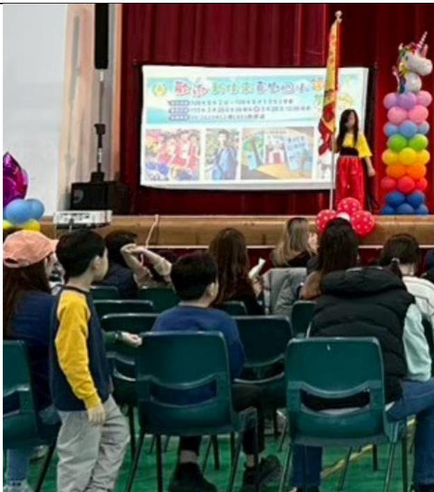
小一迎新活動宣講健康促進議題