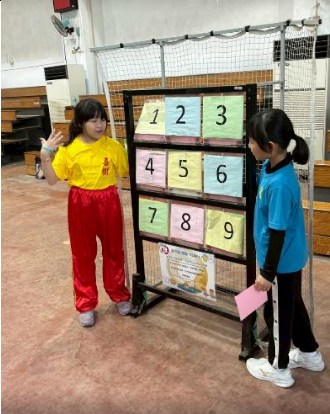
透過招生活動運用闖關 向家長宣導口腔保健重要性