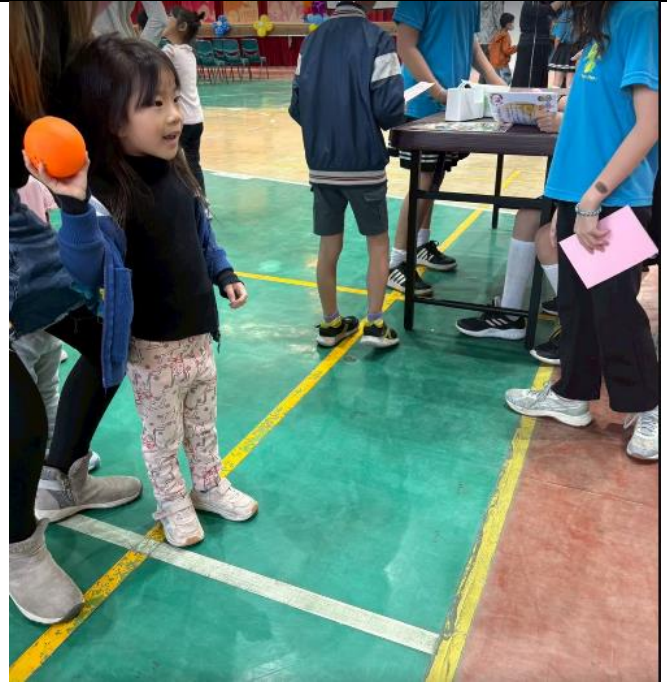
透過招生活動運用闖關 向家長宣導口腔保健重要性