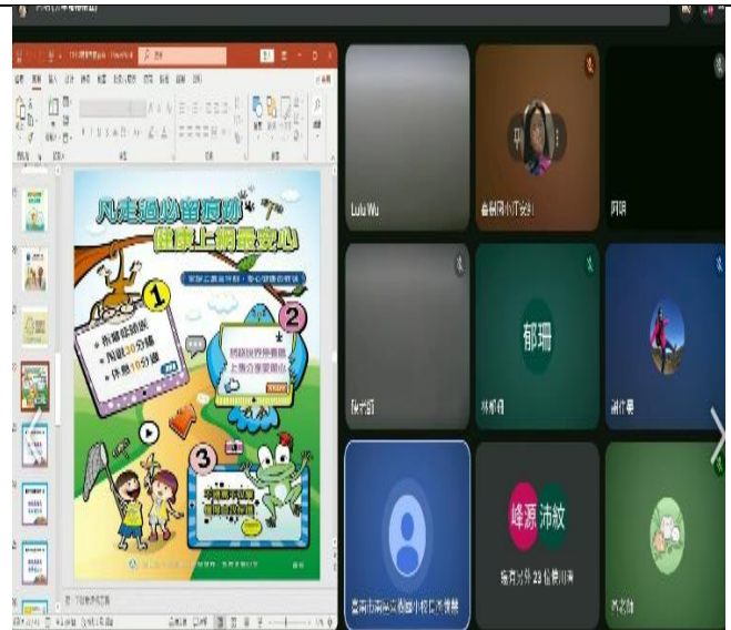
開學典禮友善校園-健康資訊