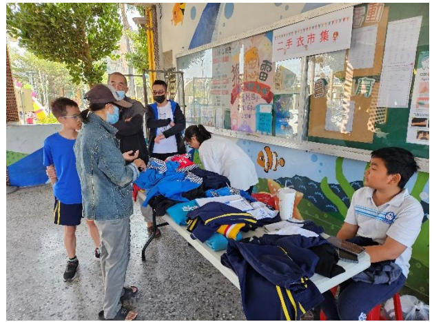
推動各種資源再利用策略與制度：二手衣市集