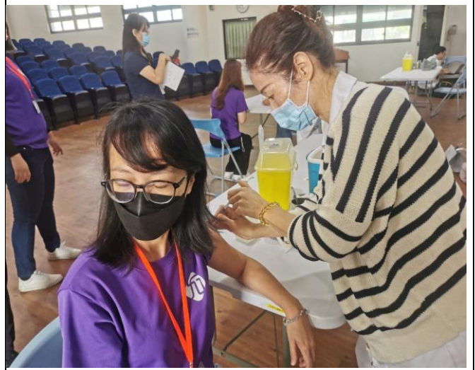
說明：家長施打新冠疫苗