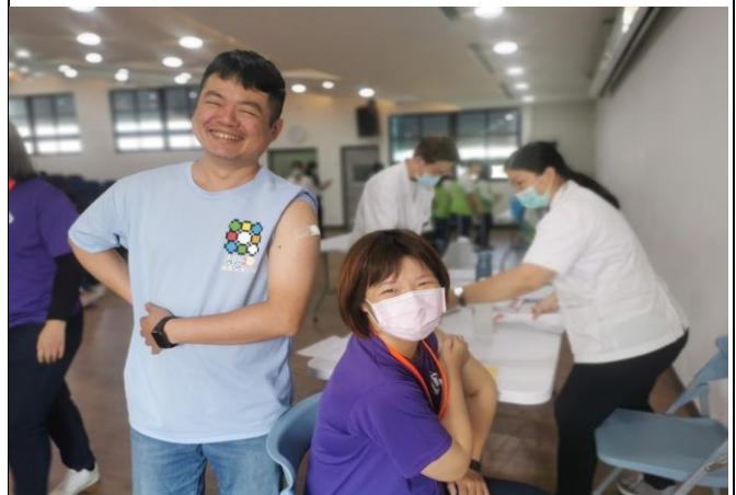
說明：家長會長展現表率進行施打疫苗