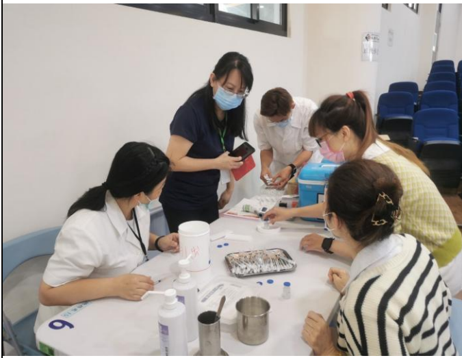
說明：健康中心進行疫苗施打時間討論