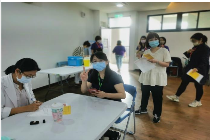
說明：教職員工進行施打新冠疫苗