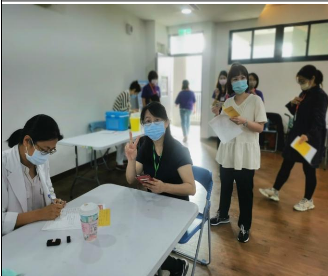
說明：教職員工進行施打新冠疫苗