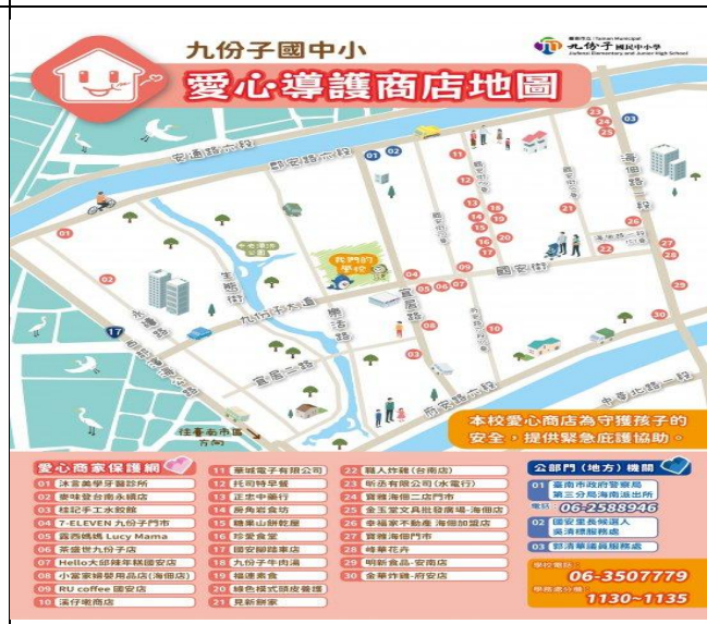
說明：附近簽約店家與愛心店家(可提供學生若遇難時期進行短暫庇護)