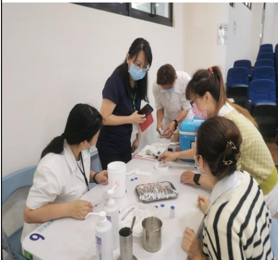
說明：健康中心進行疫苗施打時間討論