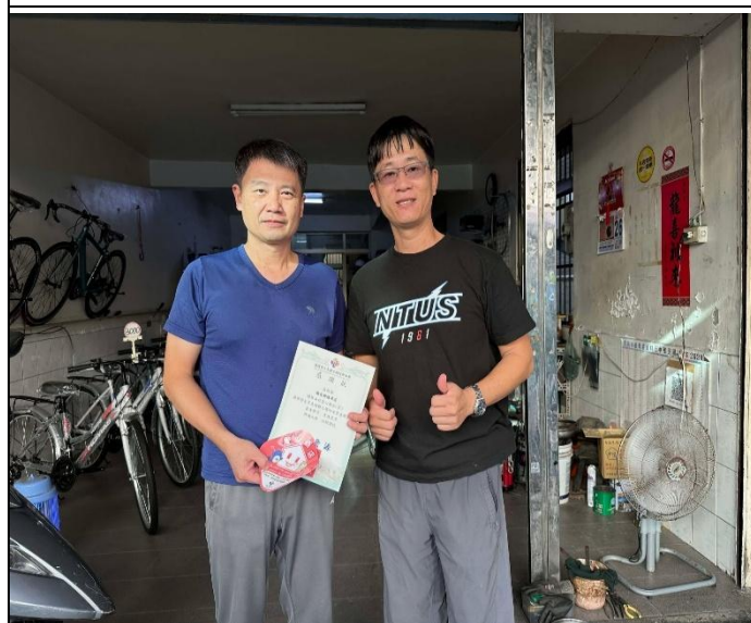
說明：與附近店家進行簽約，可以買運動用品折扣