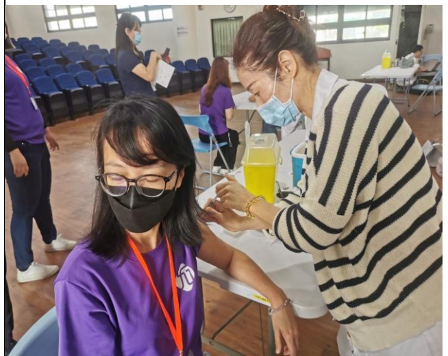
說明：家長施打新冠疫苗