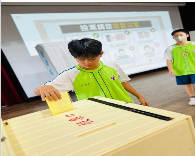
說明：學生投入神聖一票