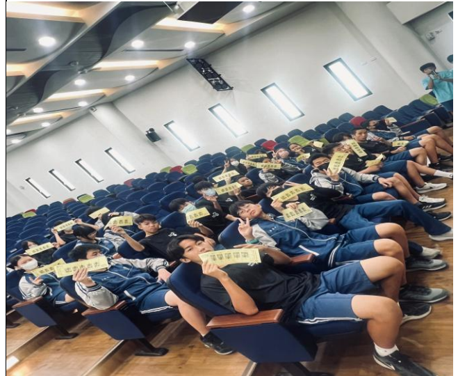
說明：專業開票團隊