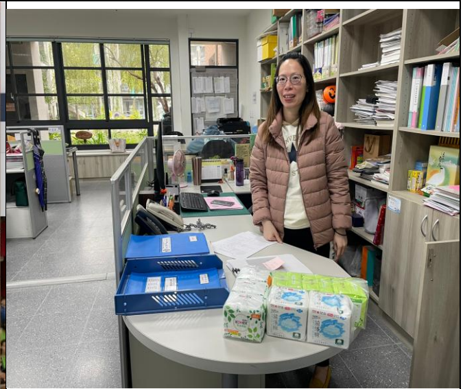
說明：進行衛生棉放置站，讓學生領取更方便