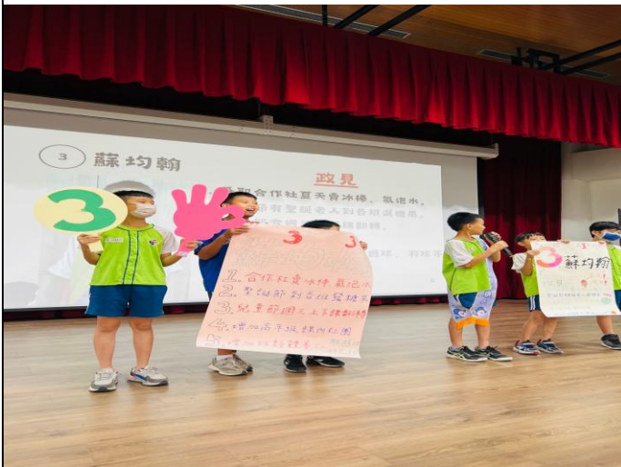
說明：小市長選舉進行民主議題