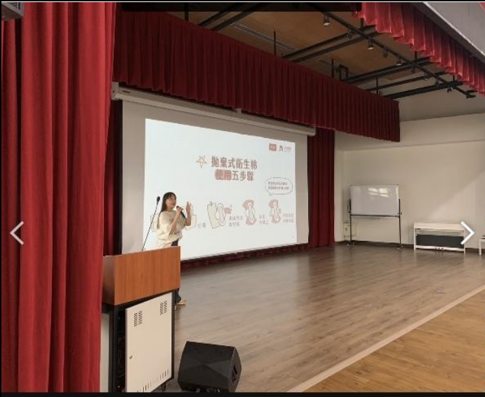
說明：邀請嘉義基督教醫院護理師進行月經教育分享