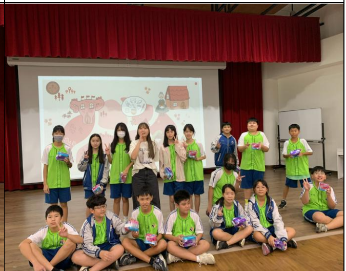
說明：兩性平權-各型別都可以領取衛生棉