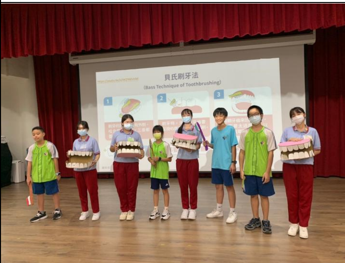
說明：兩性平權-邀請各性別參與活動