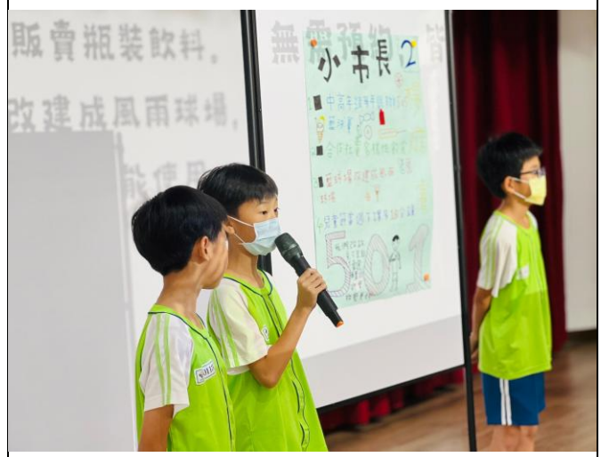
說明：小市長發表意見