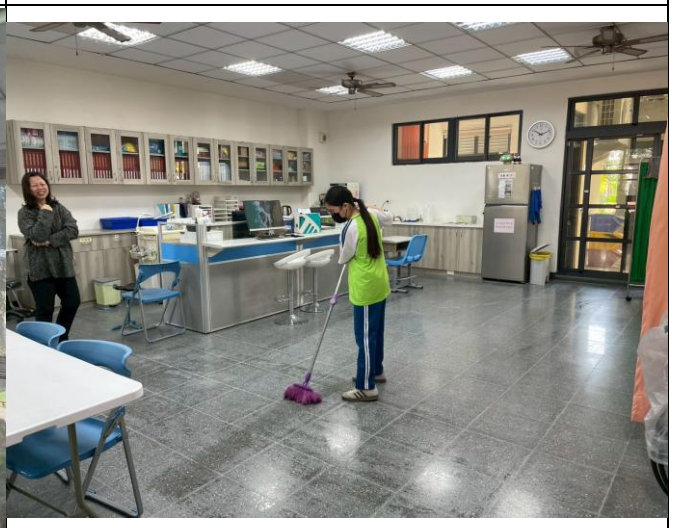
說明：將健康中心進行消毒，保持環境安全