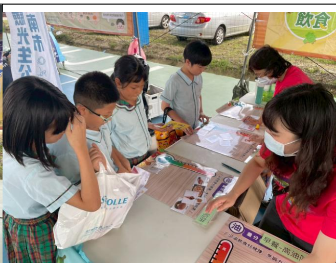
說明：飲食教育活動宣導