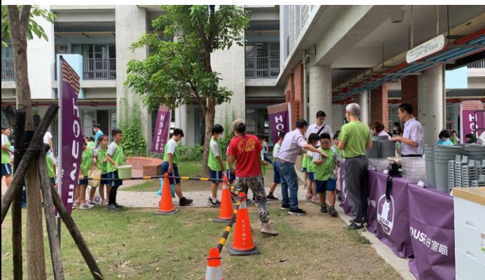
說明：學生進行獎品兌換