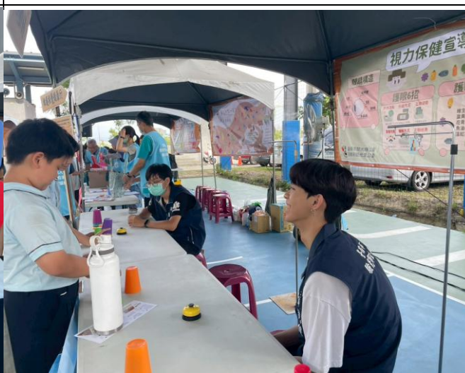
說明：視力保健宣導