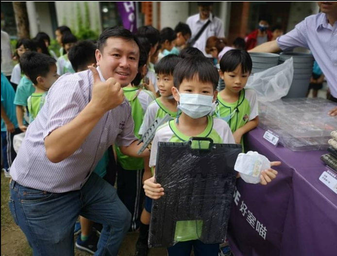
說明：依照家裡的回收物品換獎品