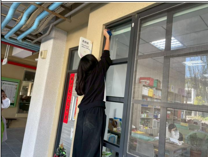
說明：整理各辦公室進行美化整理