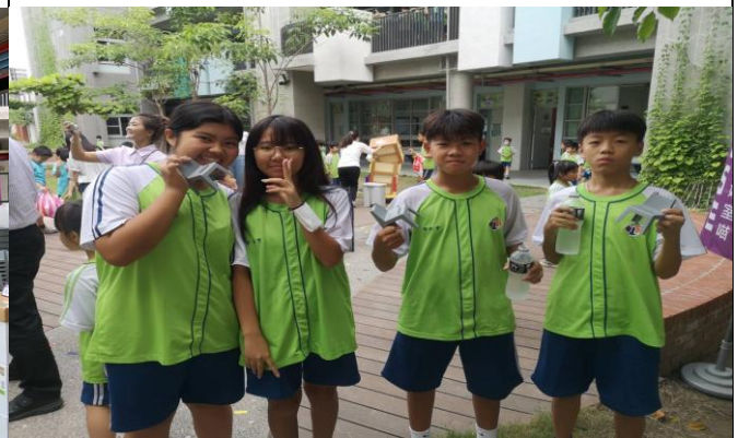
說明：學生獲得資源回收概念合影