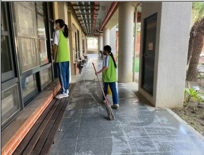
說明：進行教室與辦公室清潔。