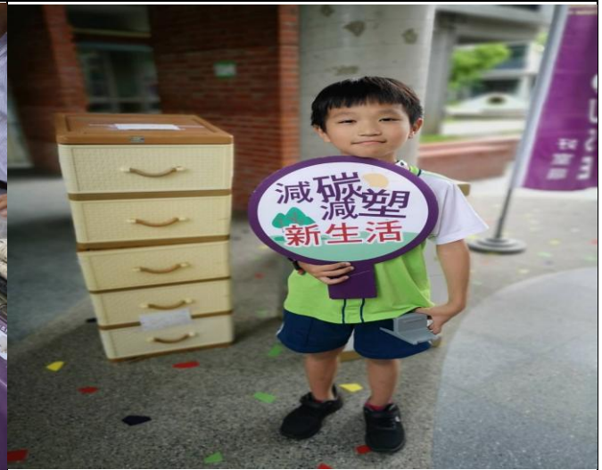
說明：學生透過資源回收概念進行收集換取獎品