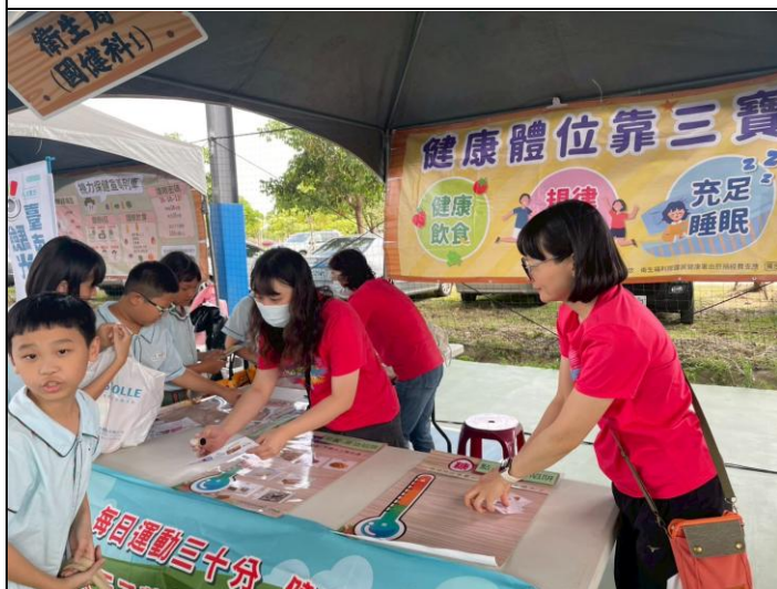
說明：健康體位的活動宣導