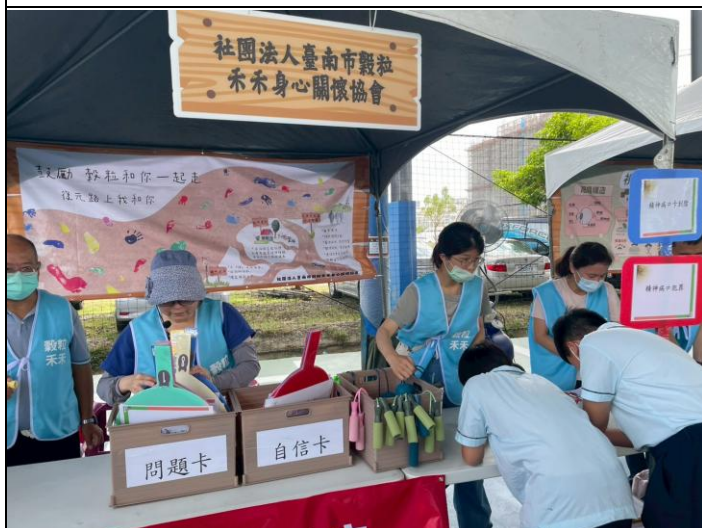
說明：正向心理的概念宣導