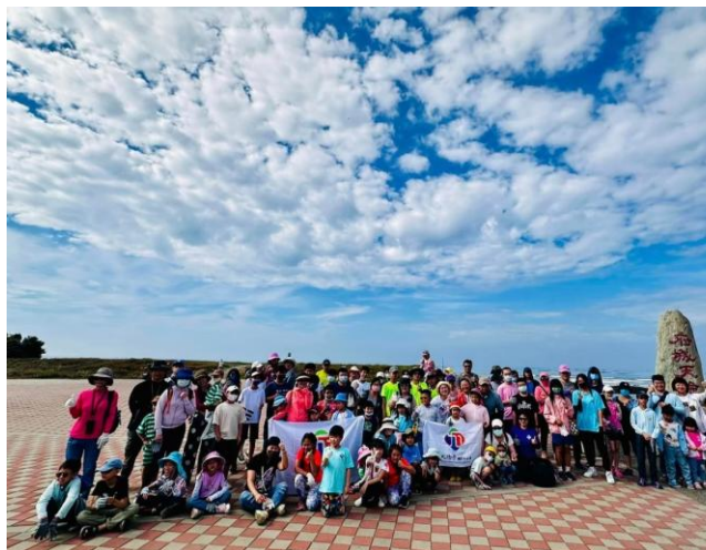
說明：活動紀錄留影