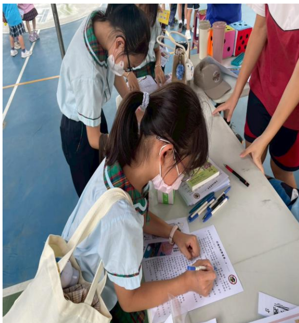
說明：學生於校園定期參加健康闖關。