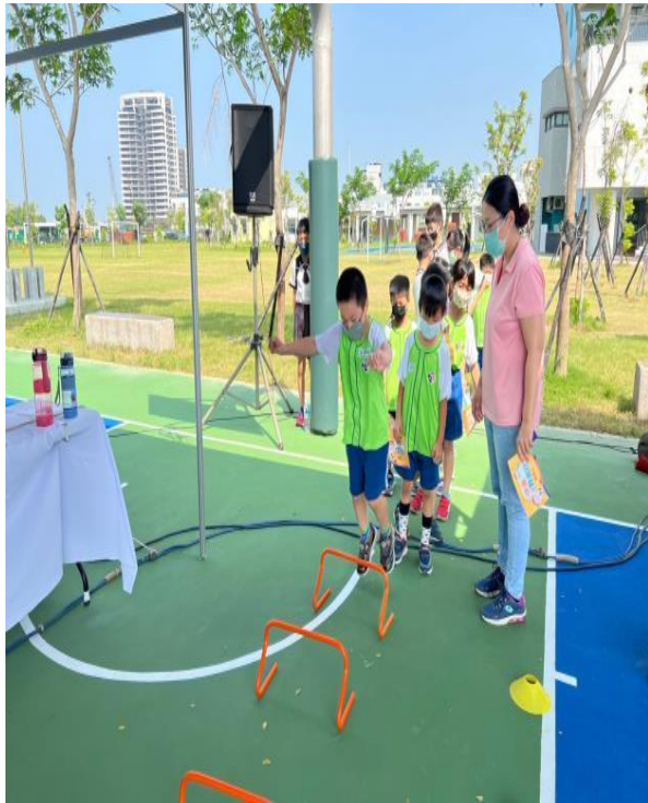
說明：學生於校園定期參加健康闖關。