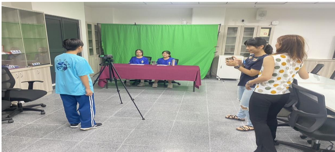
說明：教師進行節目錄製與內容指導(健康促進)