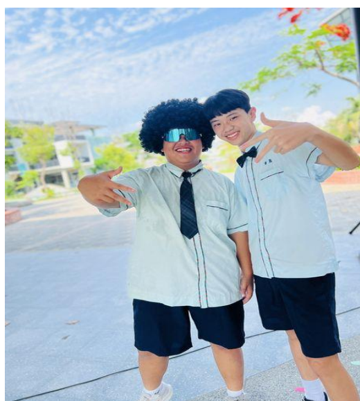
說明：校園健康主持人