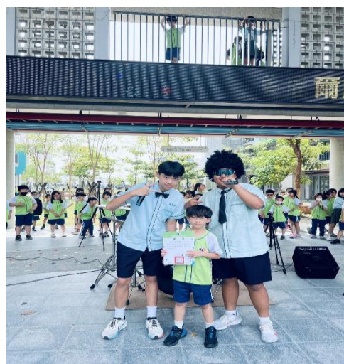
說明：鼓勵學生展現自我與健康一面