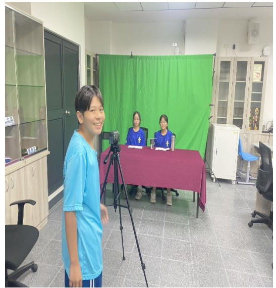
說明：進行節目錄製