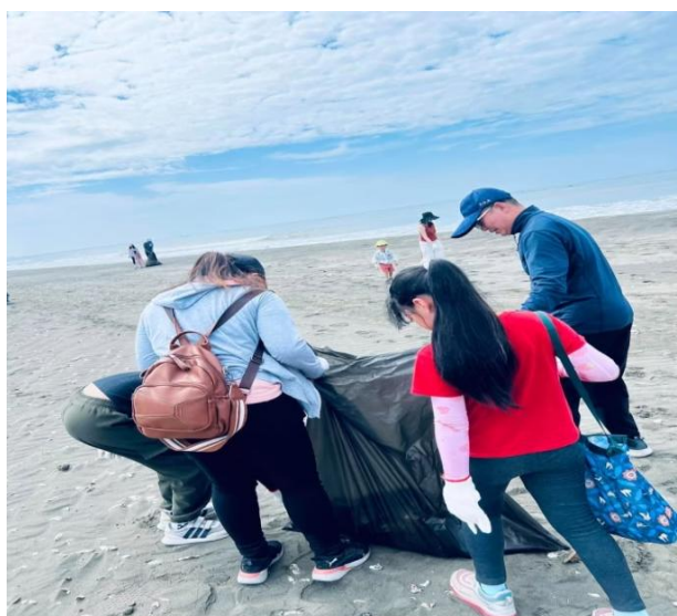
說明：校長與學生一同協力淨灘