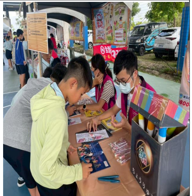
說明：每年定期參加健康促進闖關