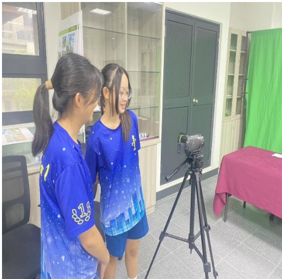
說明：學生使用錄影設備