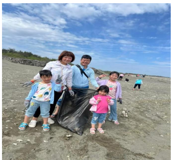
說明：家長會長一同參與活動