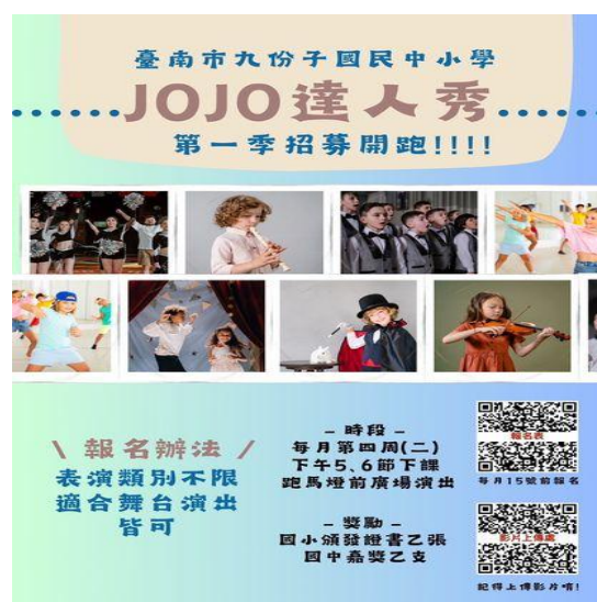
說明：進行校內各年級進行初選