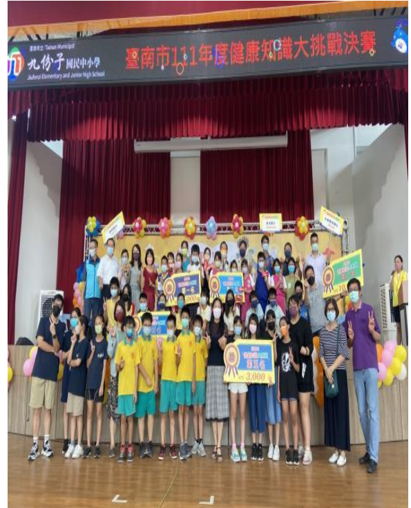
說明：每年定期參加健康促進闖關。