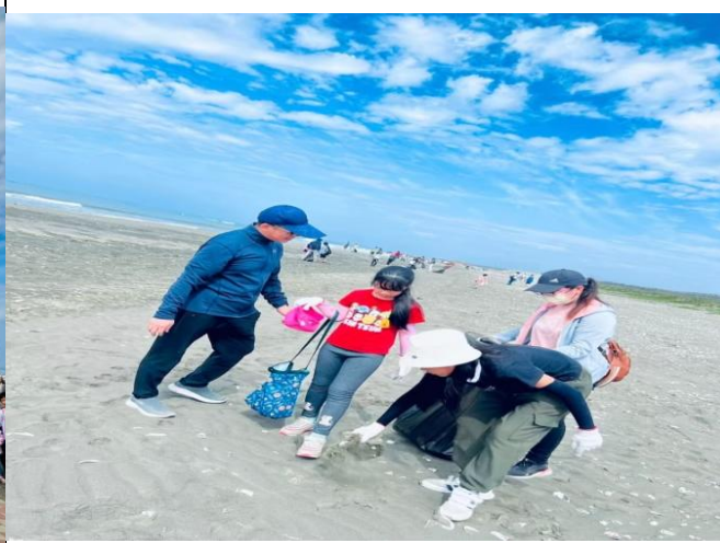
說明：校同一同前往參加