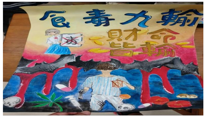
參加健康促進創意標語競賽