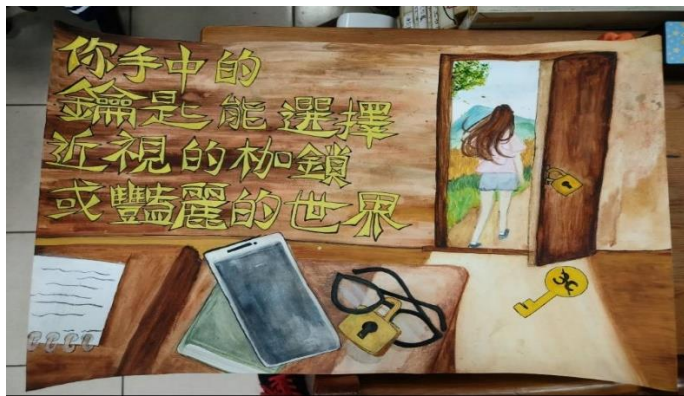
參加健康促進創意標語競賽