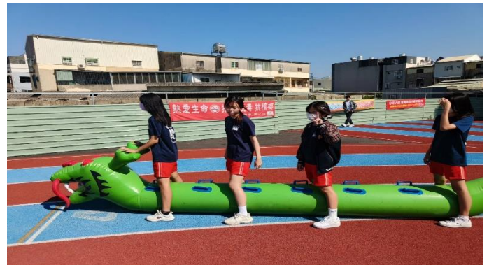
學生在結合公部門舉辦的校慶運動會擔任運動大使，陸上龍舟，健康上路。