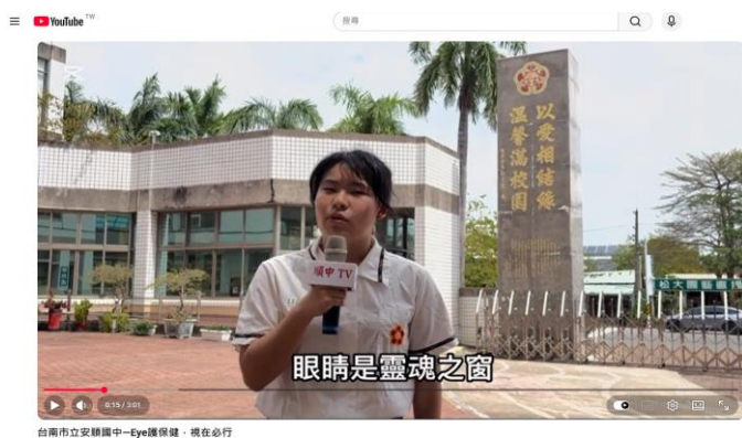
參加教育部國民及學前教育署舉辦的「健康促進學校輔導計畫校園健康主播評選」