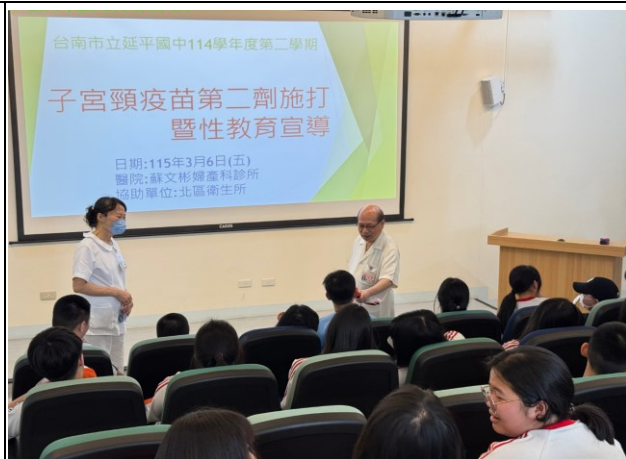
說明：蘇文彬婦產科診所