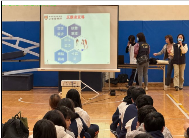
說明：台南市調查局