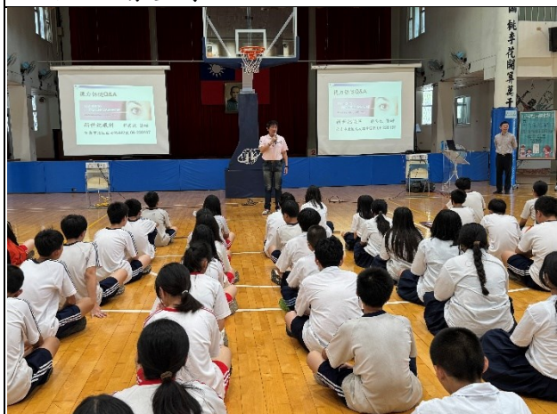
說明：視力保健宣導