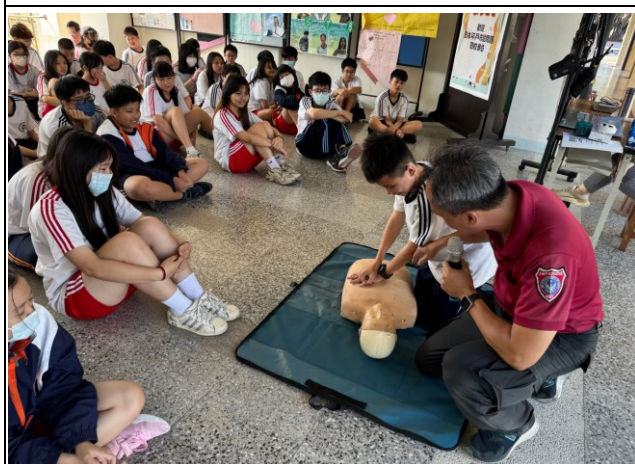
說明：台南市消防隊