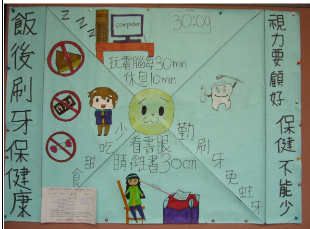
說明：口腔視力保健