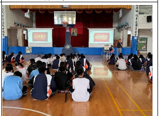
說明：口腔保健宣導