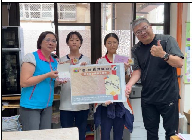
說明：救國團致贈眼鏡票卷