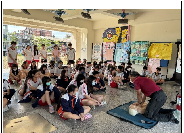
說明：急救教育宣導