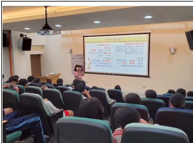
說明：登月計畫宣導