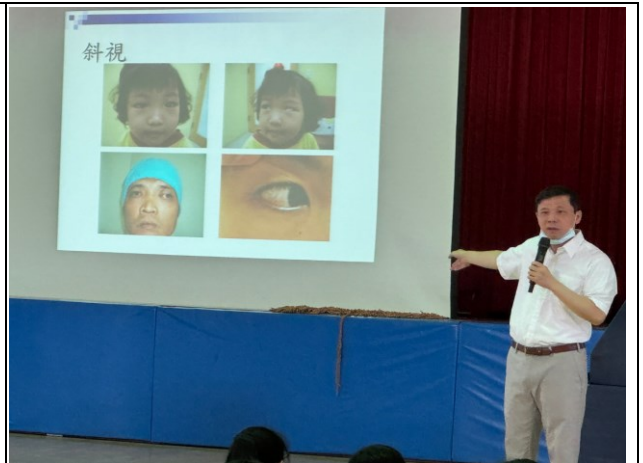
說明：新世紀眼科診所