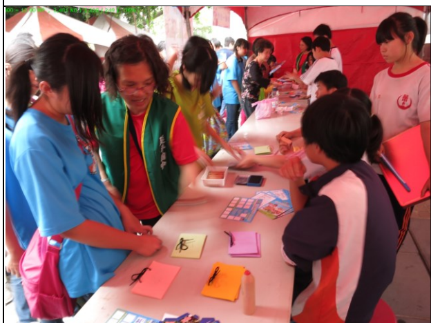
說明：社區市集擺攤活動