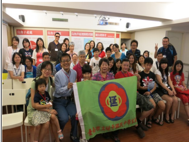
說明：社區與學校共同參觀烏魚子工廠