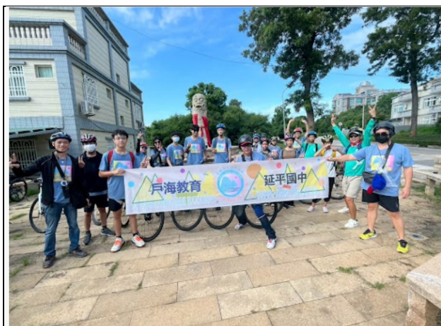
說明：社區戶外教育