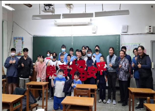
說明：向陽基金會加入晚自習研習會