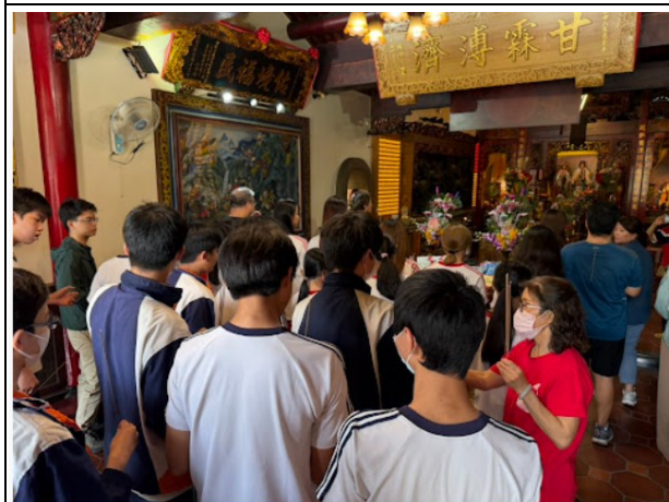
說明：學生到社區廟宇祈福活動