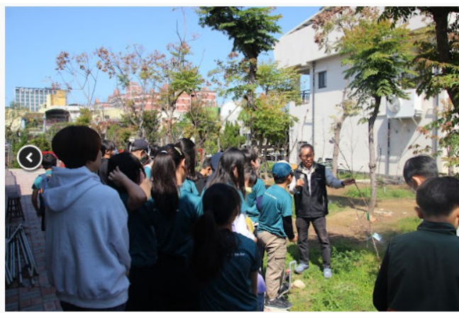
說明：邀請社區民眾至校觀賞櫻花