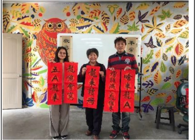
說明：社區志工寫春聯活動