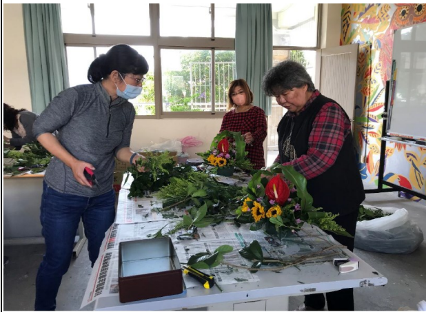
說明：社區志工插花課程