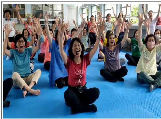
說明：志工團參與健康運動