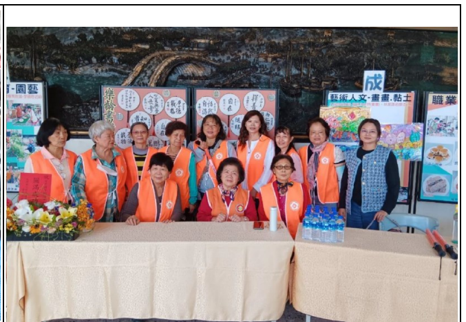
說明：志工團協助學校活動