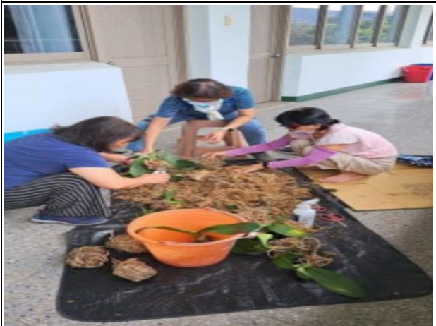
說明：志工協助校園花草整理