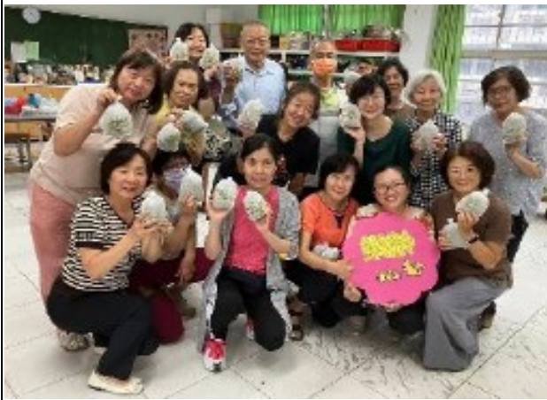
說明：志工手做活動