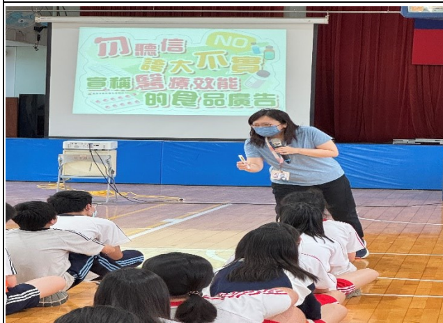
說明：食藥安全注意