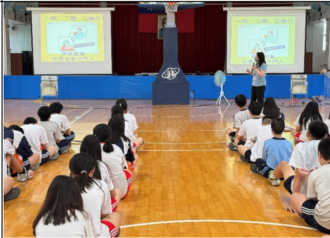
說明：珍愛生命守門人