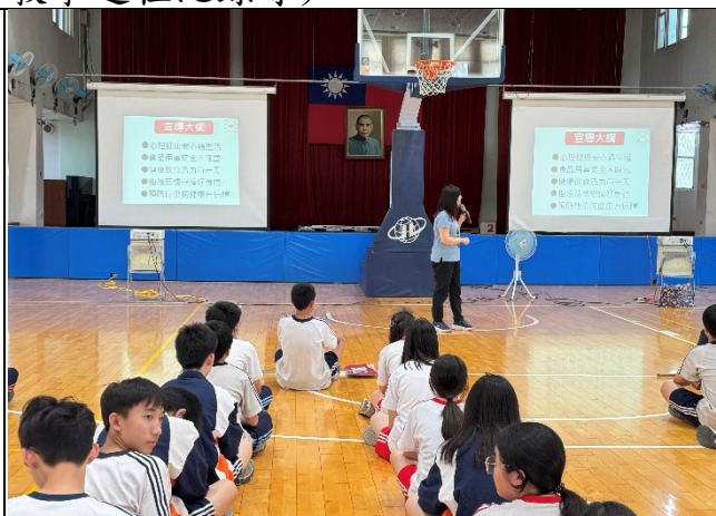
說明：宣導主題大綱