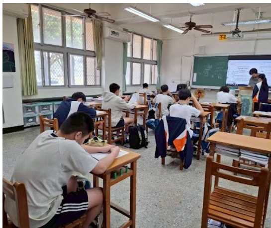
週六學習扶助才藝課程