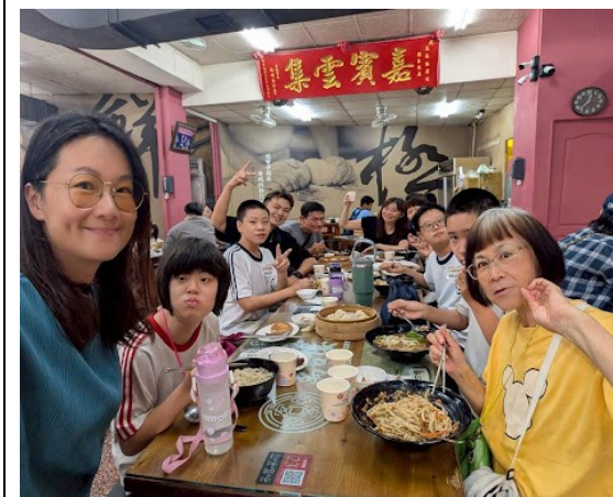
特教班與老師共同參加布袋球比賽