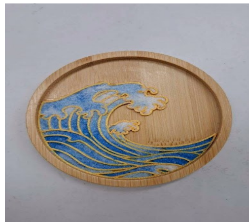
週六學習扶助才藝課程作品