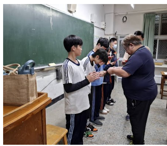
向陽基金會晚自習獎勵第一次段考表現優異