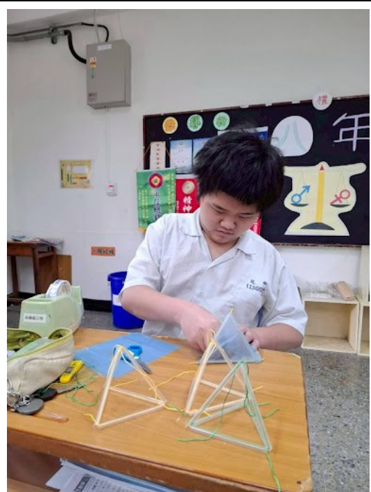
貝爾四面體風箏製作課程