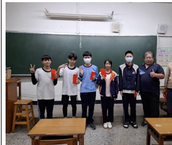
向陽基金會晚自習獎勵第一次段考表現優異