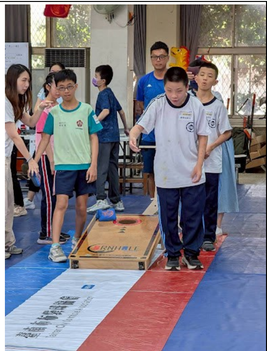
特教班與老師共同參加布袋球比賽