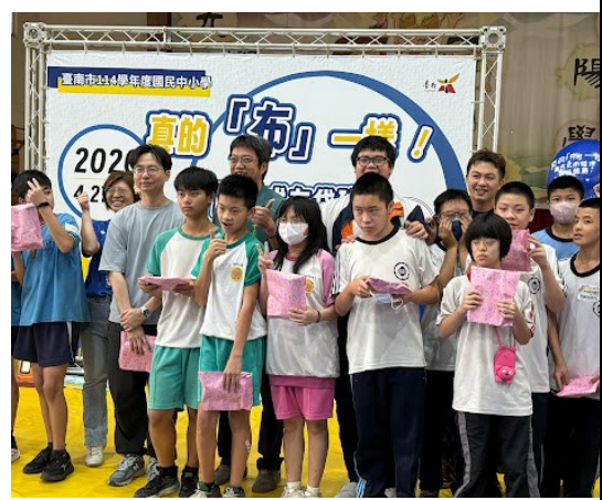
特教班與老師共同參加布袋球比賽