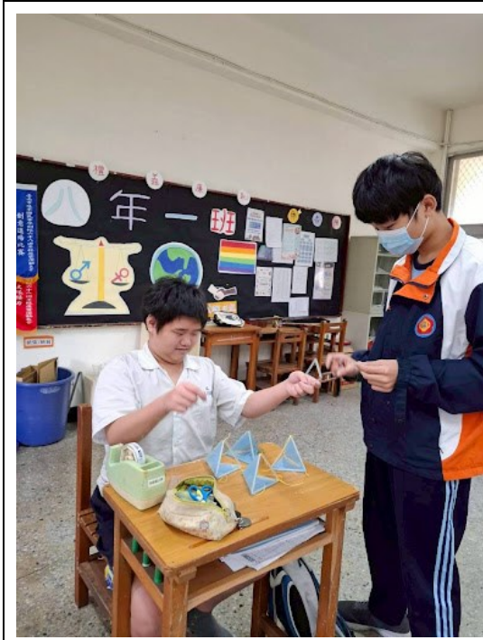
貝爾四面體風箏製作課程