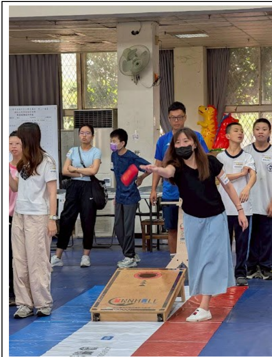
特教班與老師共同參加布袋球比賽