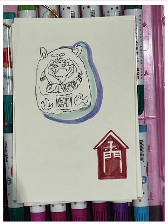
官田戶外教育暨食農教育