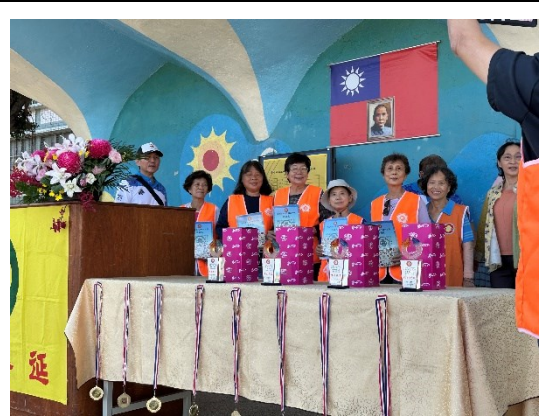
學校志工團共同倡議健康促進議題