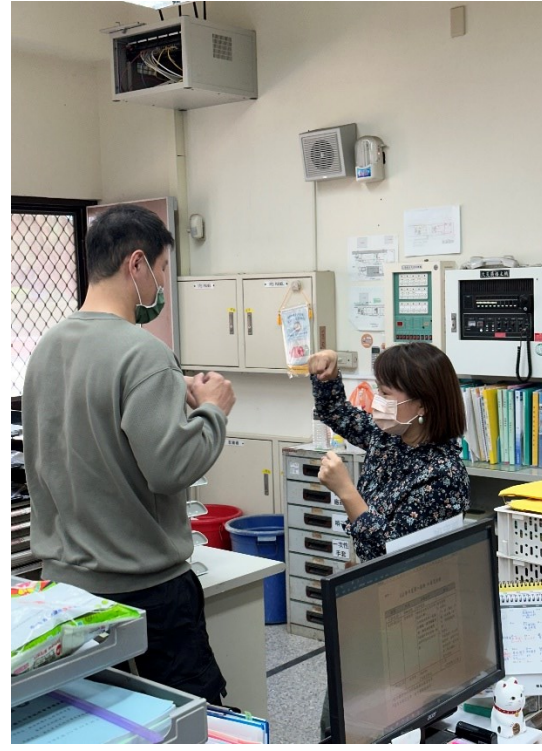
拳擊隊教練與註冊組長共同議課健康促進議題