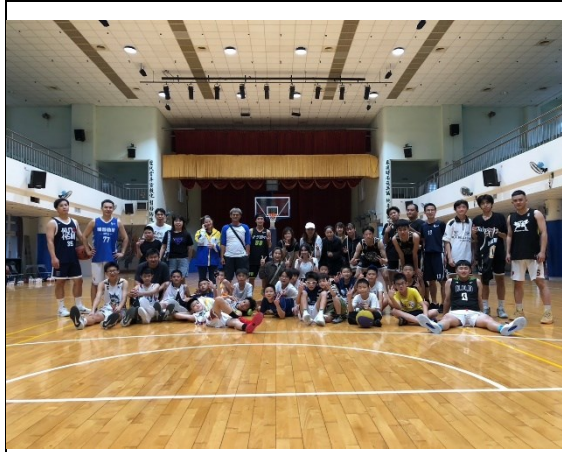
邀請籃球隊家長共同倡議健康促進， 以作為學生健康行為的楷模