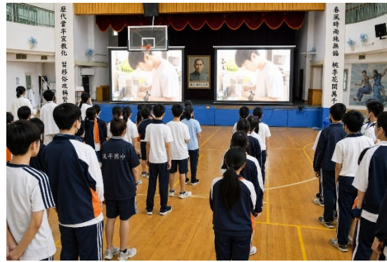
體衛組以身作則於宣導時加入自己刷牙的照片