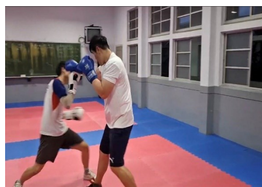
體衛組長在校實踐健康行為，並作為 養成學生健康行為的楷模