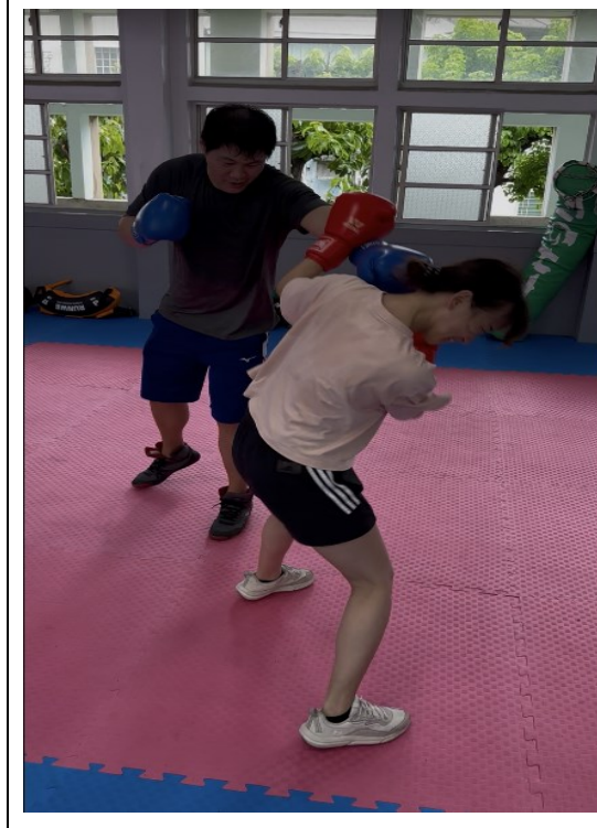
9 年級導師在校實踐健康行為，並作為養成學生健康行為的楷模