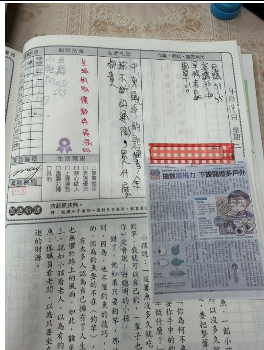
於聯絡簿宣導健康促進資訊