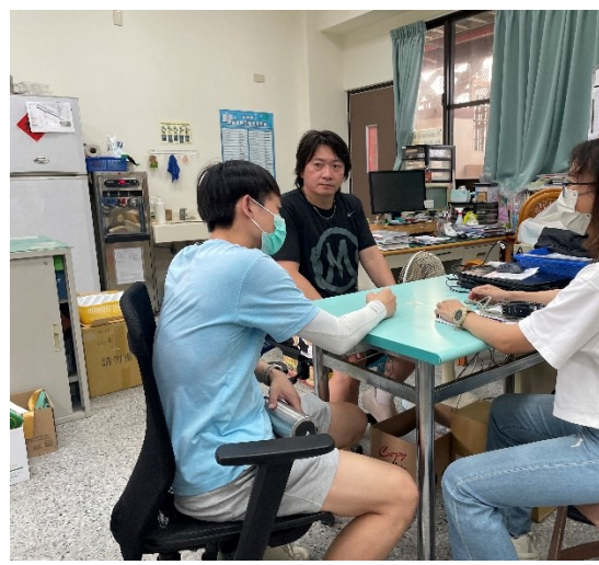
親師溝通時做實體健康促進倡議