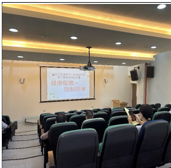
於班親會執行健康促進