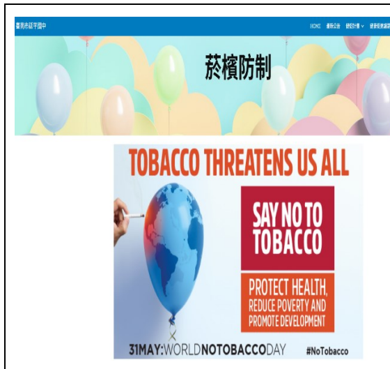
於本校健康促進網公告相關資訊