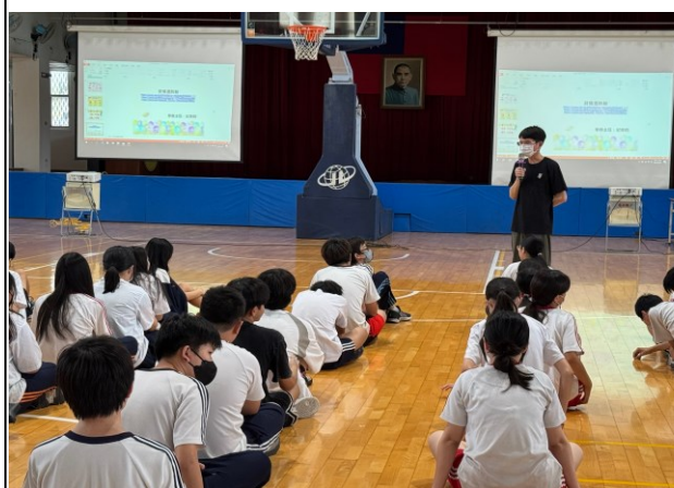
說明：香菸中含有害物質