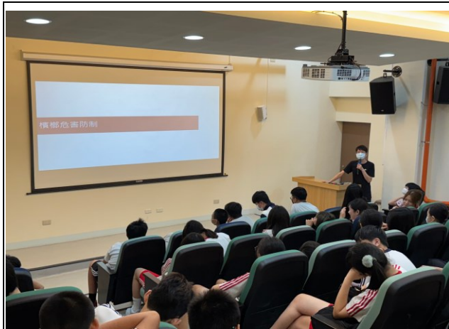
說明：檳榔危害防制