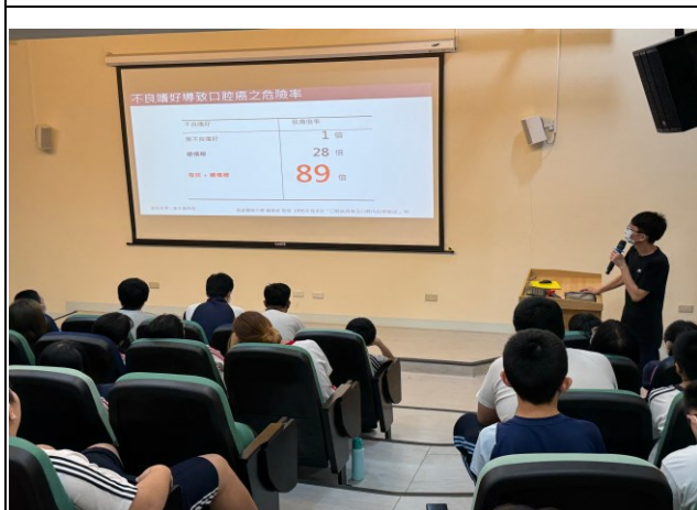
說明：口腔癌發生率