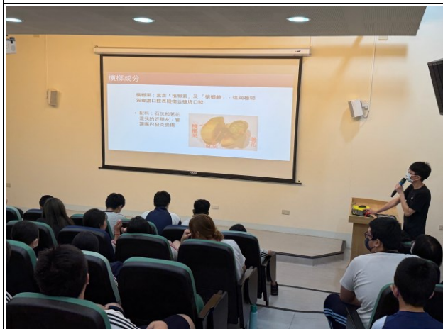
說明：檳榔成分介紹