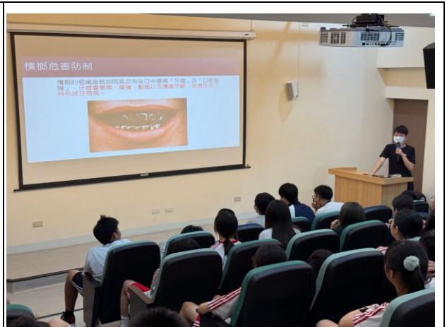
說明：口腔癌示意圖