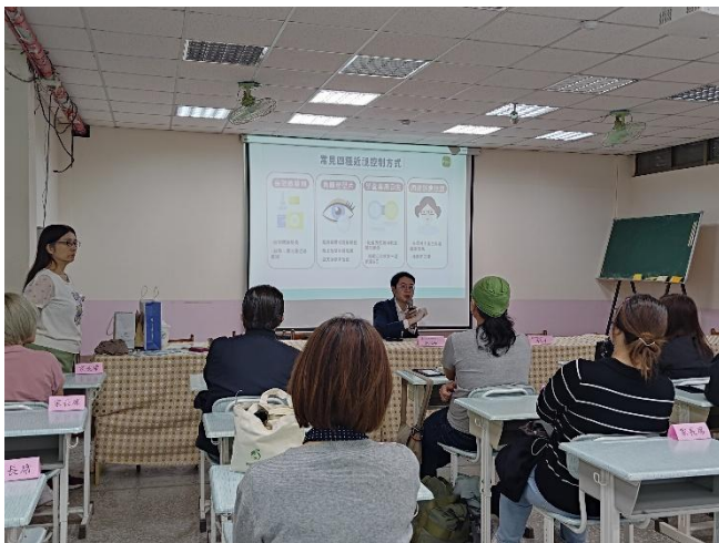
邀請高度近視學生家長參與視力保健講座