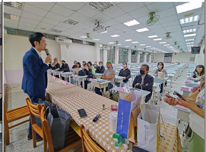
高度近視家長踴躍參與認真發問