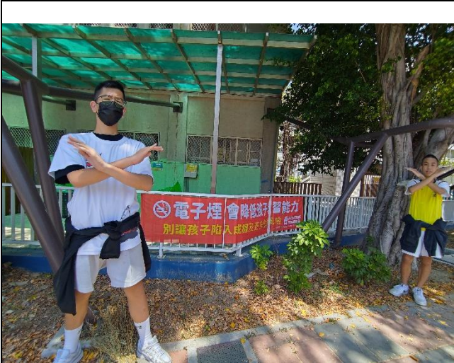
請學生志工宣導電子煙之危害