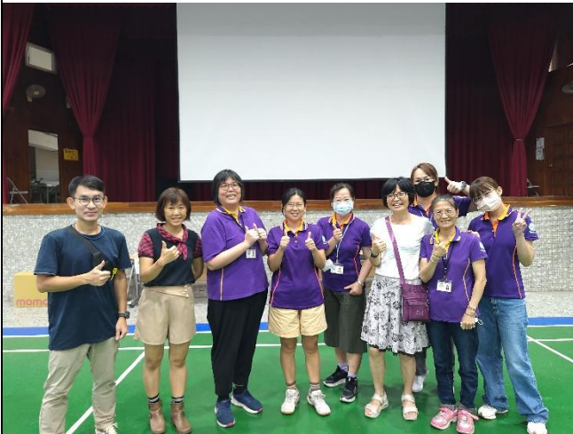
針對教職員工及家長志工流感注射