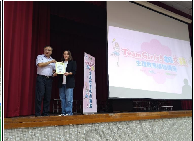
與廠商合作推廣月經平權教育