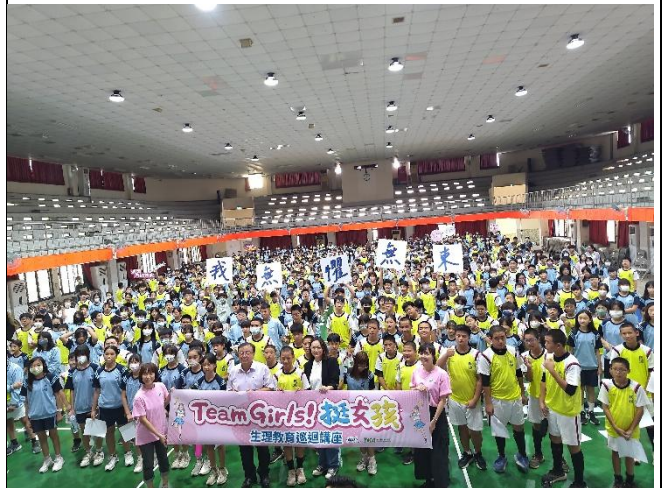
致贈男女學生生理用品，推廣月經平權大合照