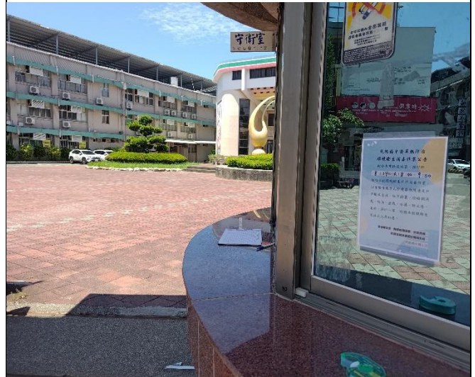
校園登革熱環境消毒大門張貼提醒社區民眾