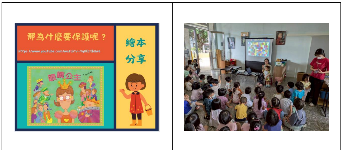
觀看繪本-眼鏡公主