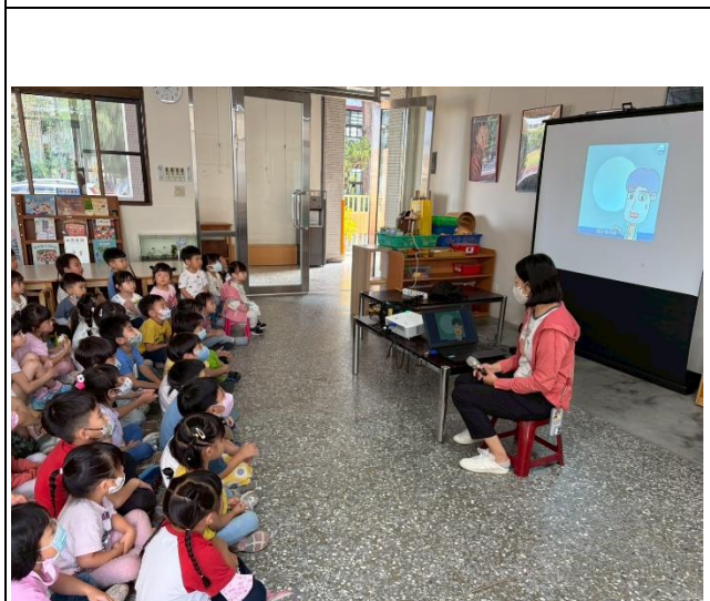
傳染病宣導影片欣賞