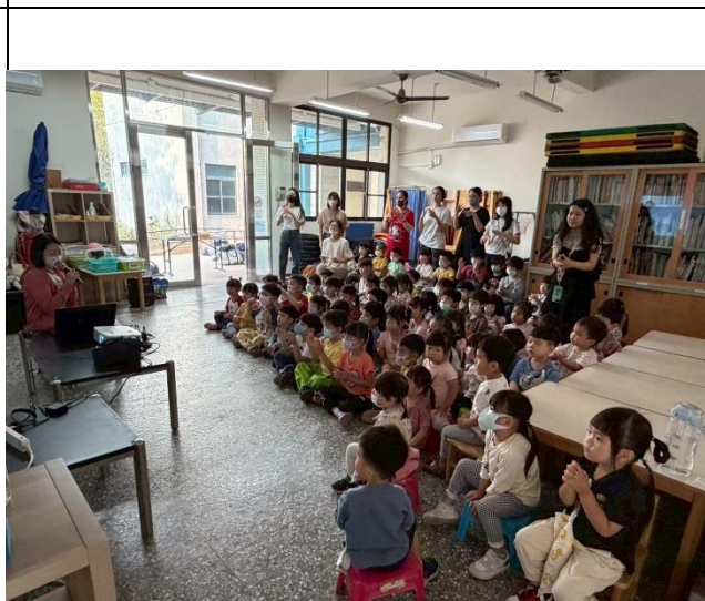
複習洗手步驟，洗手歌一起動一動