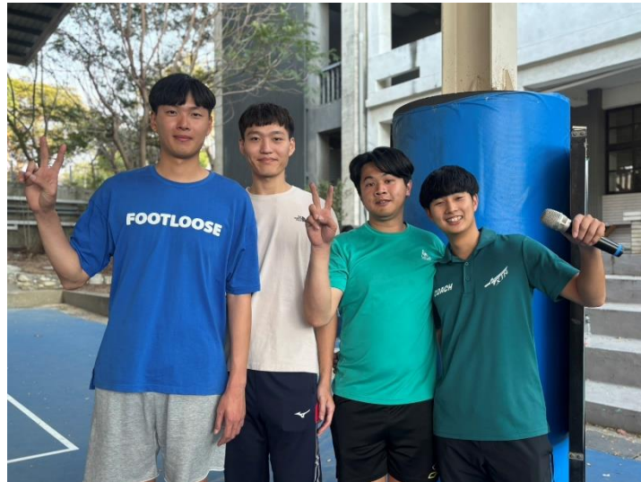
▲教師自組排球社團，利用下班時間運動