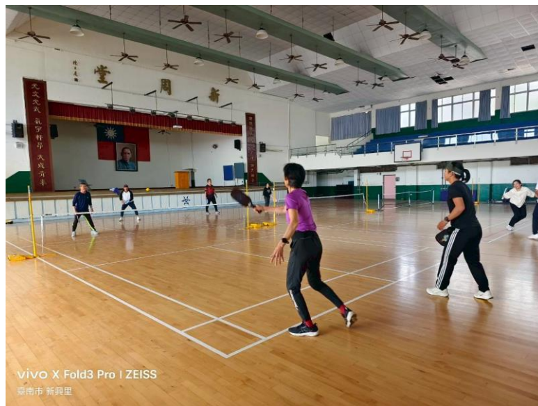
vivo X Fold3 Pro | ZEISS 臺南市 新興里