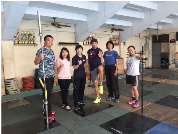
▲教師組成健身俱樂部