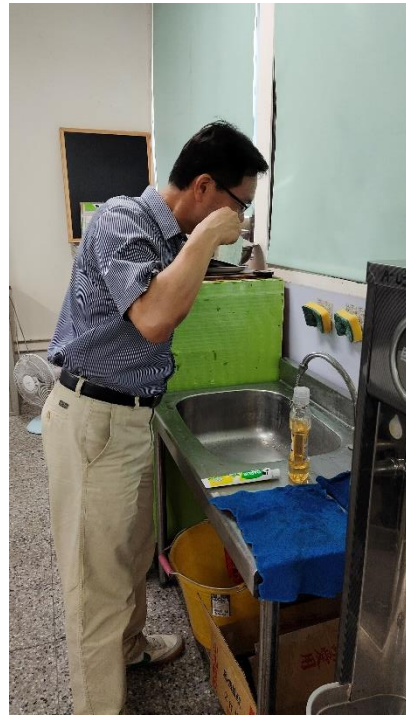
▲以身作則作為學生的學習楷模