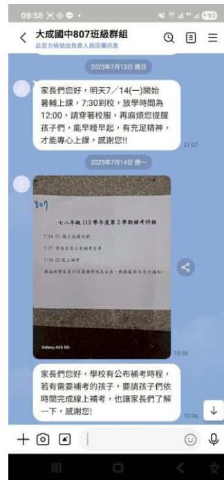
▲班級 LINE 群組