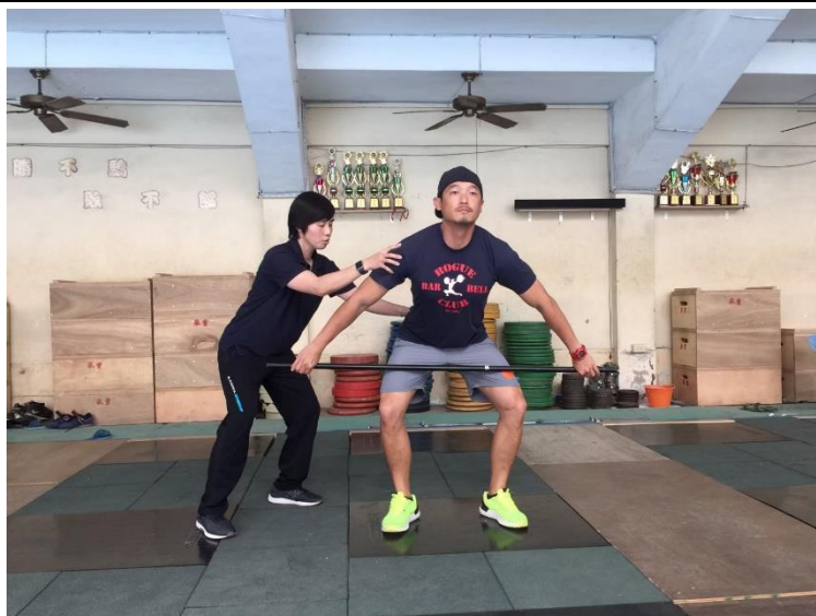
▲舉重教練指導專業動作