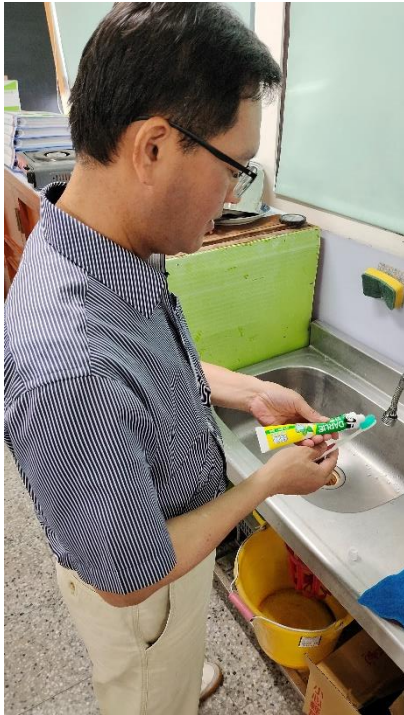
▲學務主任以身作則