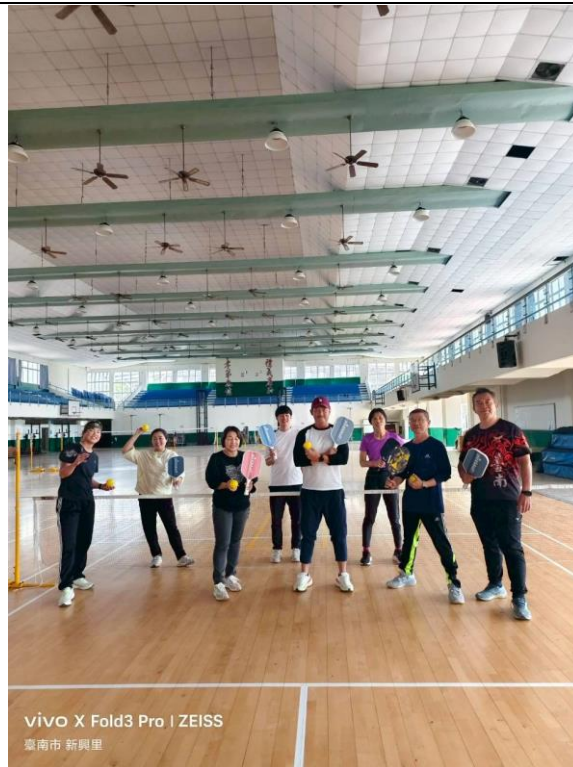
vivo X Fold3 Pro | ZEISS 臺南市 新興里