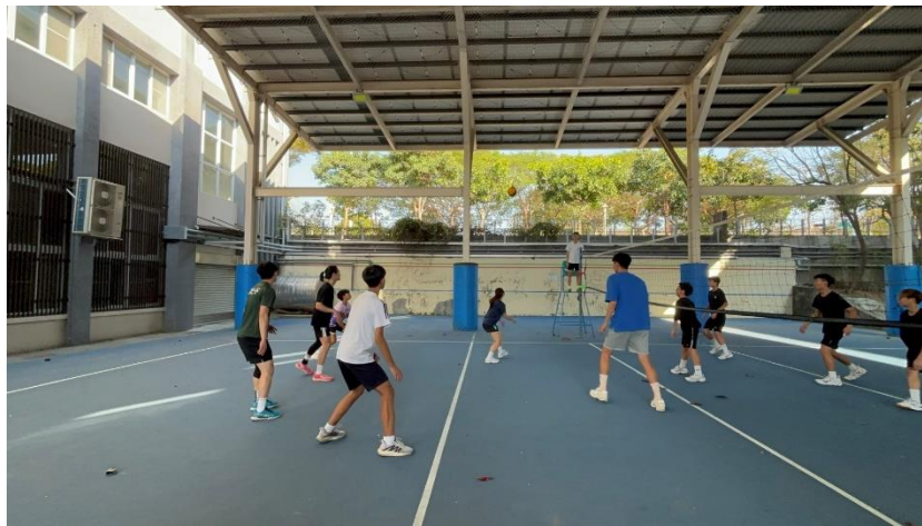
▲與學生一同打排球