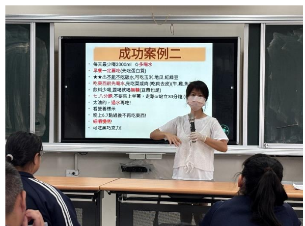
護理師分享減重成功學長姐的經驗