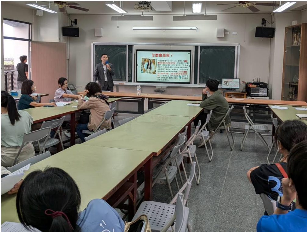
講師說明健檢的重要性