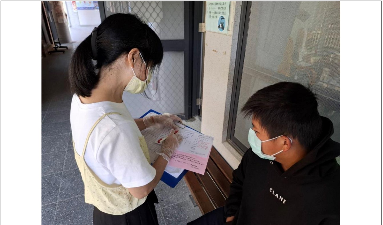
護理師正在詢問學生生病的症狀，叮囑注意事項，並提供相關資訊。