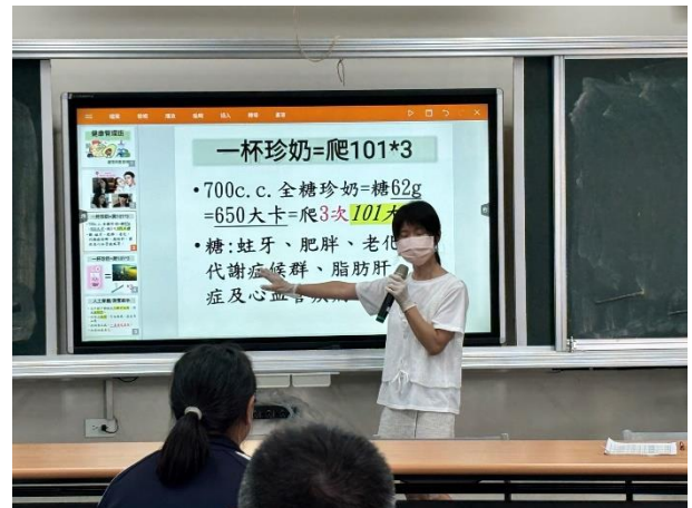
護理師說明含糖飲料對健康的影響