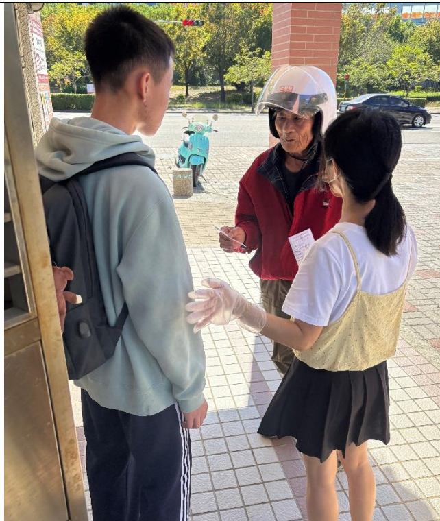
護理師於校門口向接送學生的家長說明注意事項