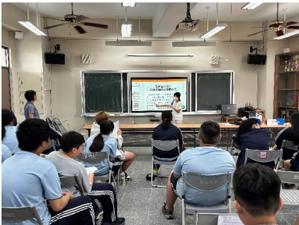
健康中心對體位不佳學生辦理健康營