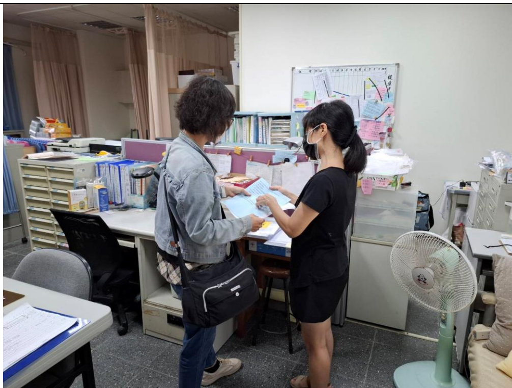
護理師提供老師疫苗施打資訊