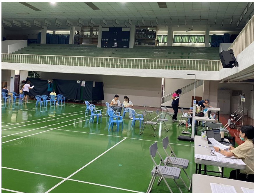
學校教職員工正在進行健康檢查