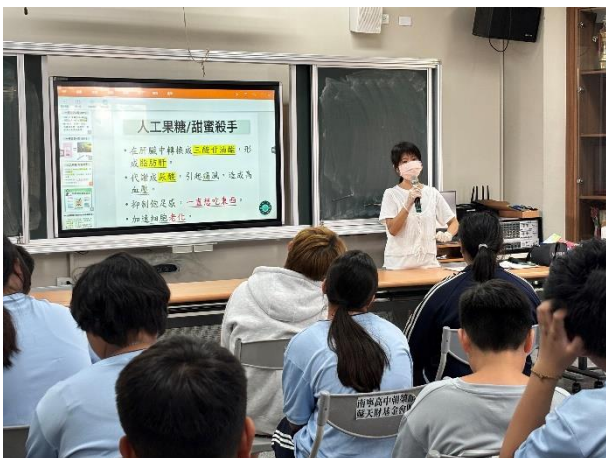
護理師說明人工果糖對健康的影響