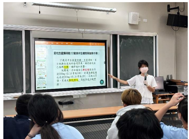
護理師說明不當飲食、少運動的影響