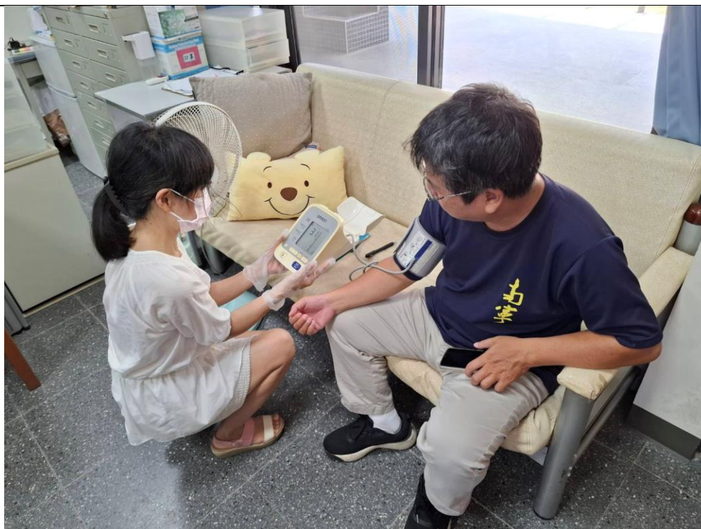
護理師提供教師基本健康檢測，協助教師照護自我健康