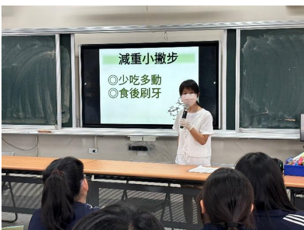
護理師說明有利減重的方式