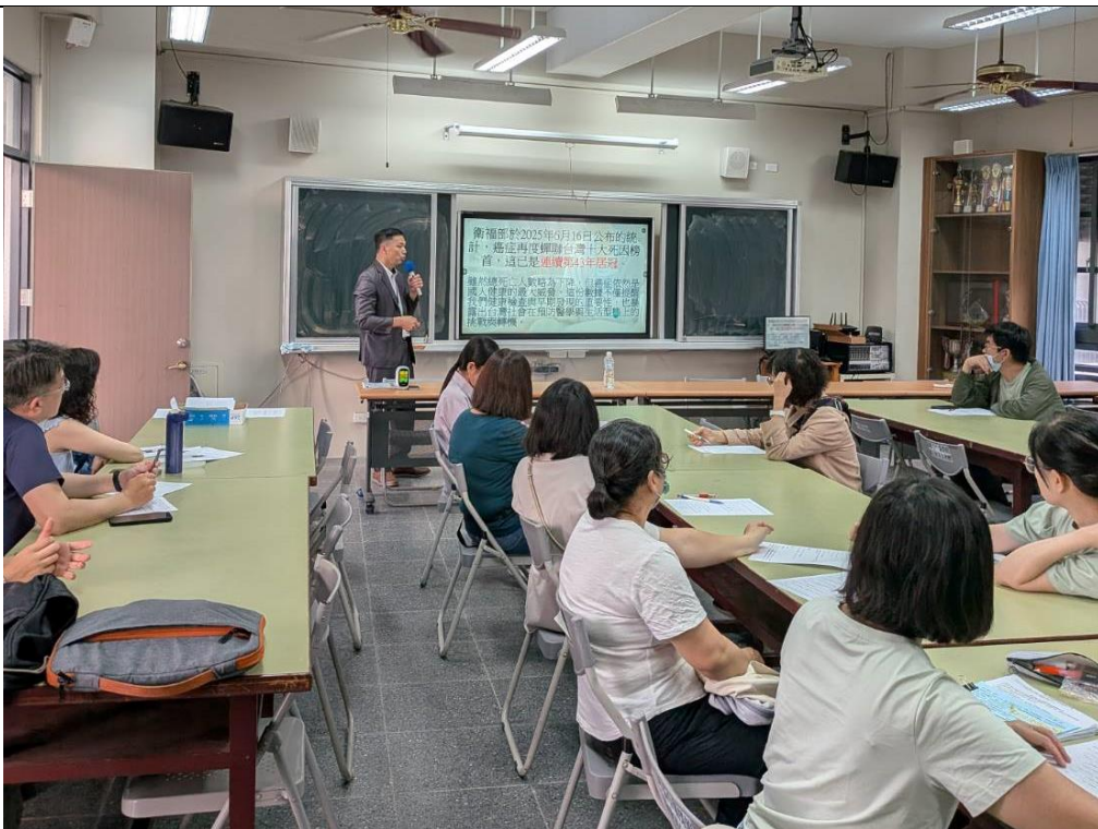
講師說明癌症為台灣十大死因之首，透過健檢可早先發現、治療