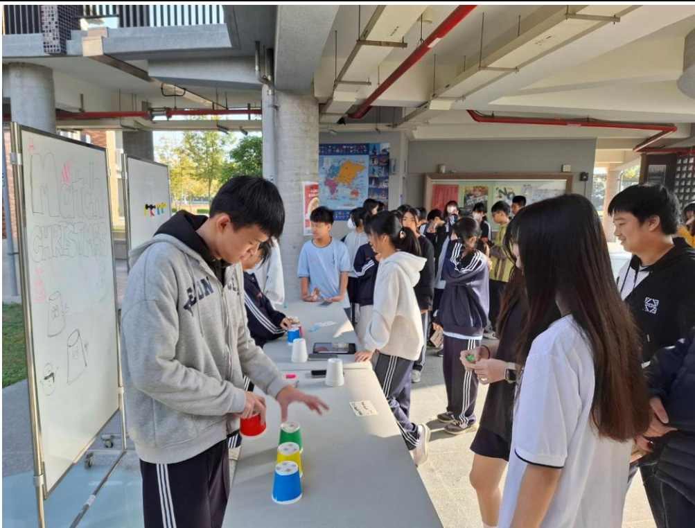
學生會舉辦耶誕節闖關活動，學生參與踴躍