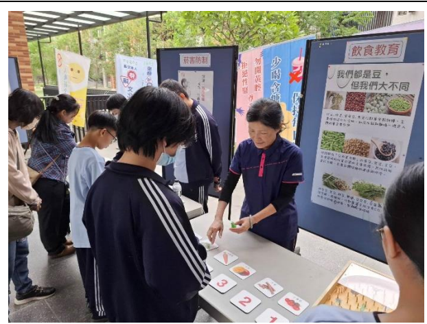
學生進行「飲食教育」闖關