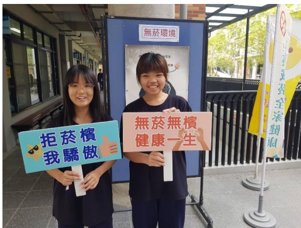
師生進行「拒菸宣言」