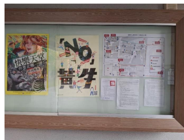
1F 電梯前佈告欄張貼健康議題海報