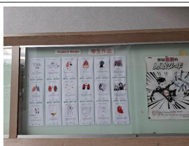
1F 穿堂佈告欄張貼學生菸害防制作品