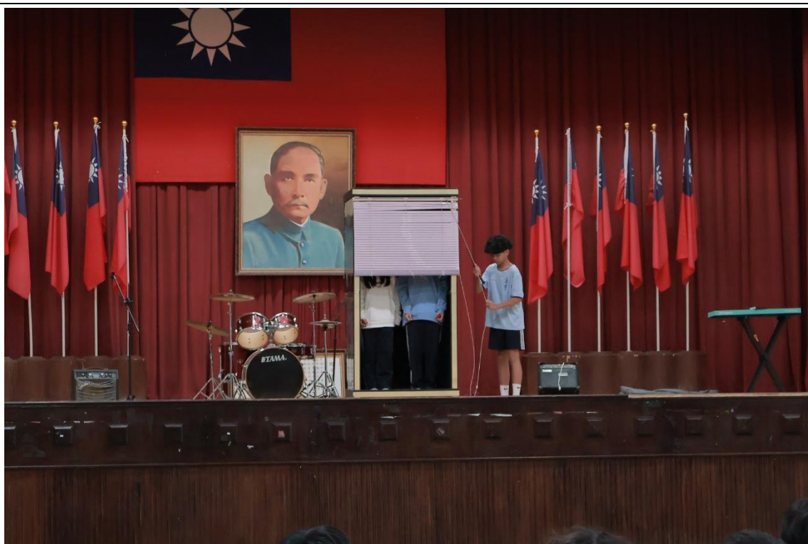
社團成果展—魔術社表演

(四) 舉辦社團成果展，師生同樂，讓學生有展示自我的機會，也鼓勵學生參與有益身心健康的活動。