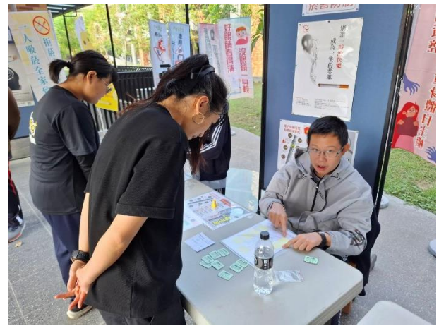
師生進行「菸害知多少」闖關