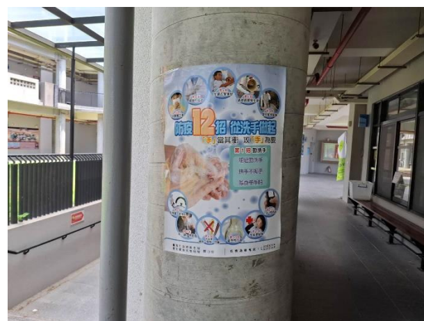
1F 走廊張貼健康議題海報