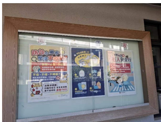
2F 走廊佈告欄張貼健康議題海報