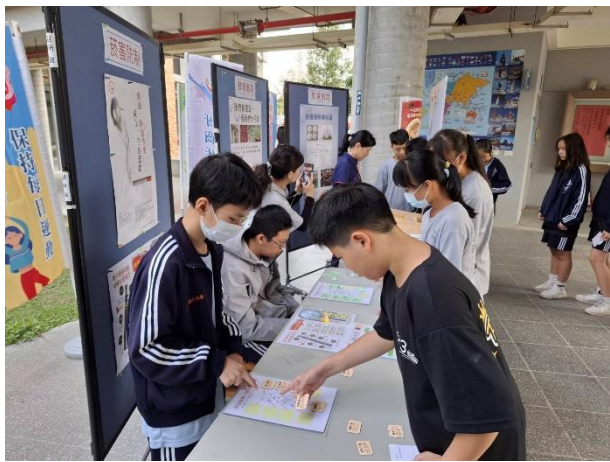
學生進行「菸害知多少」闖關