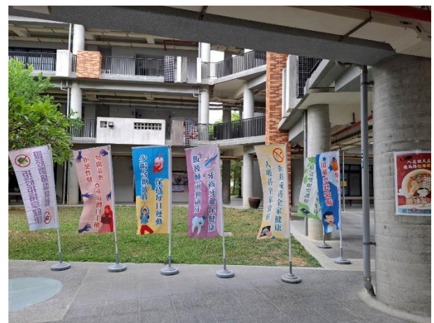
擺放健康標語旗幟宣導