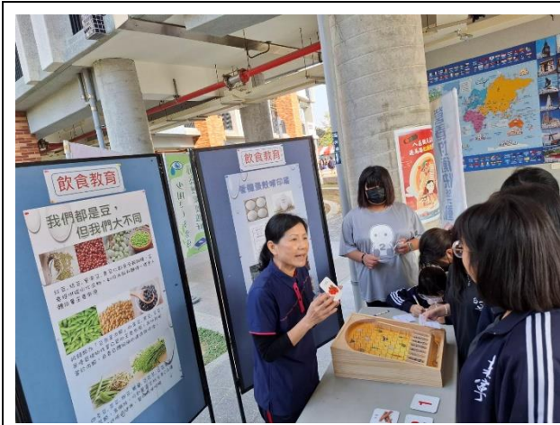
師生進行「飲食教育」闖關

(五) 運動會辦理健康促進闖關活動及放置健康標語旗幟，讓師生在活動的歡樂中，提升健康意識。