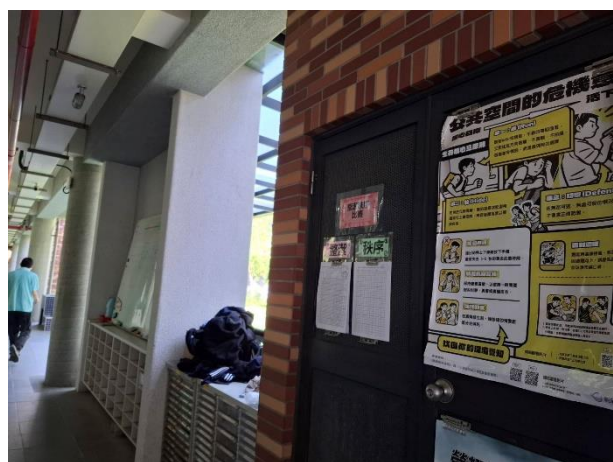
1F 走廊張貼健康議題海報