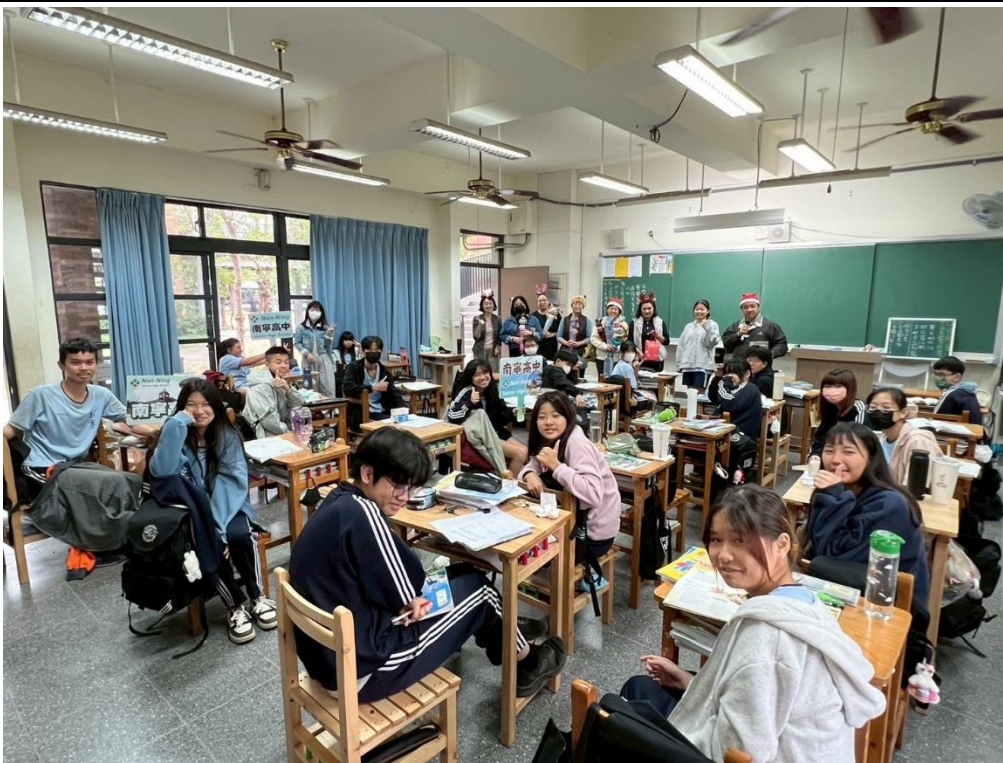
家長會長、校長與各處室主任，扮演耶誕老公公入班送耶誕禮物