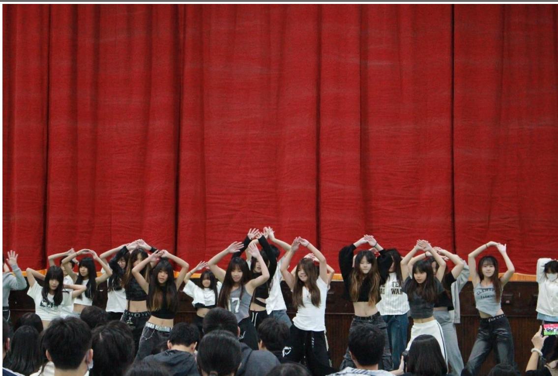
社團成果展—熱舞社表演