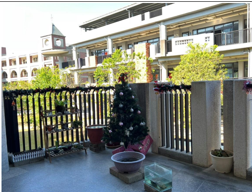
2F 走廊平台，進行運用裝飾品、植栽進行美化，增加溫馨氛圍