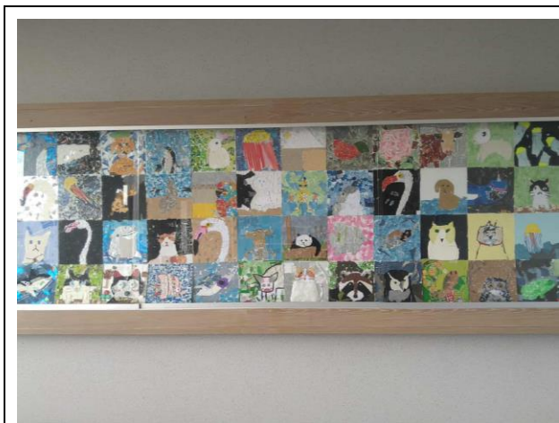
3F 平台佈告欄張貼學生美術課作品

(二) 在每層樓的佈告欄及重要走道張貼學生作品及宣導海報，建構友善、健康的校園氛圍。