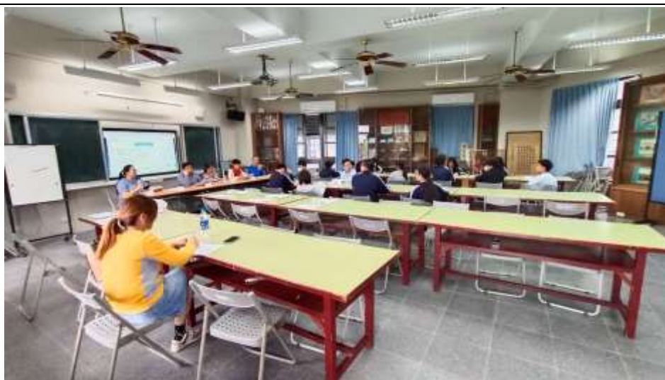
各處室主任回應同學提問