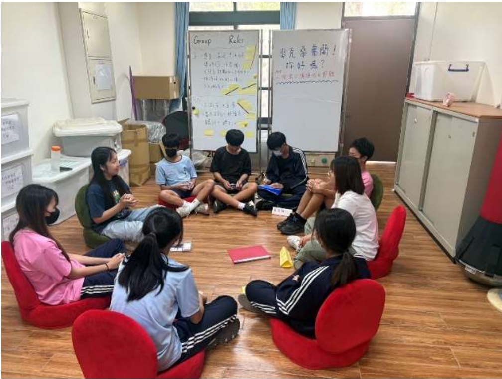
人際關係小團體課程