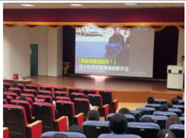
辦理反霸凌宣導講座