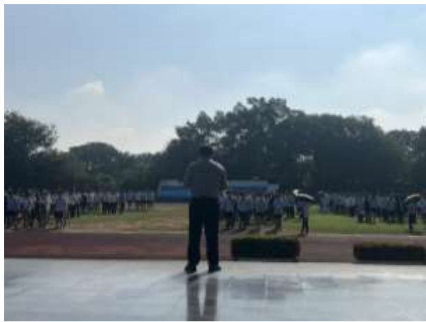
校長於升旗進行友善校園宣導