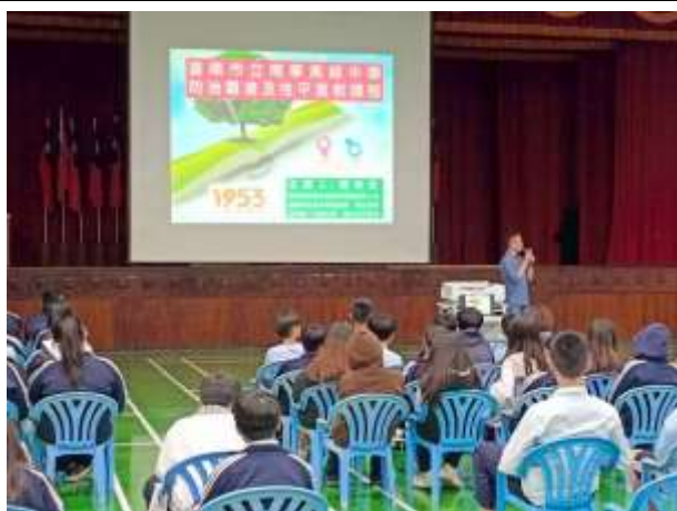
辦理反霸凌宣導講座