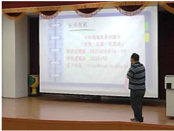
生輔組長於新生訓練進行反霸凌宣導