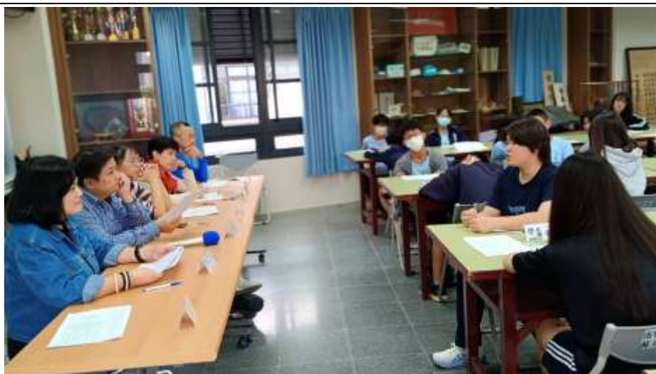
各班代表參與師生座談會