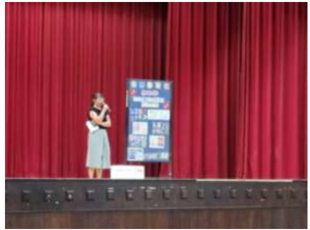
學務主任於開學典禮進行友善校園宣導