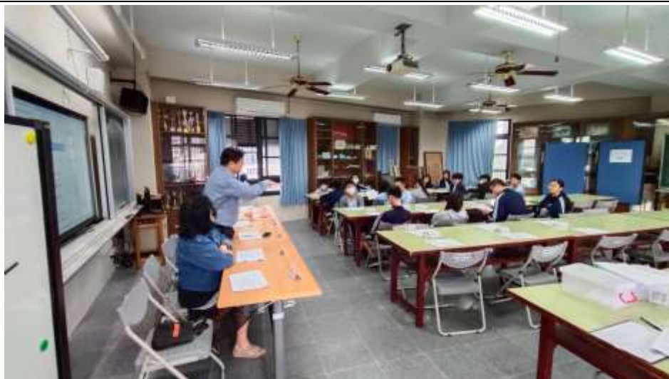
校長主持師生座談