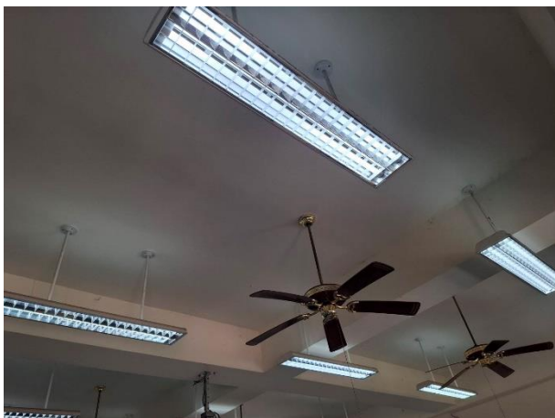
全校使用節能燈管