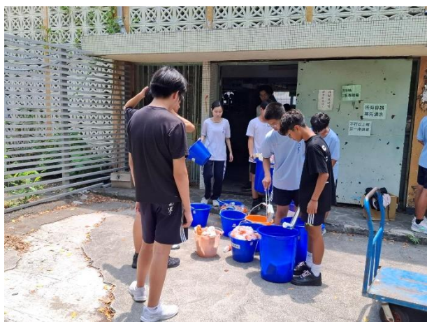
推行校園資源回收