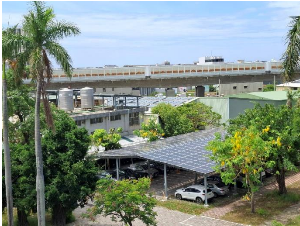
教師停車場屋頂鋪設太陽能板