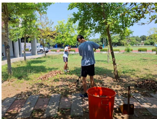
以橘色垃圾桶裝落葉取代大塑膠袋使用