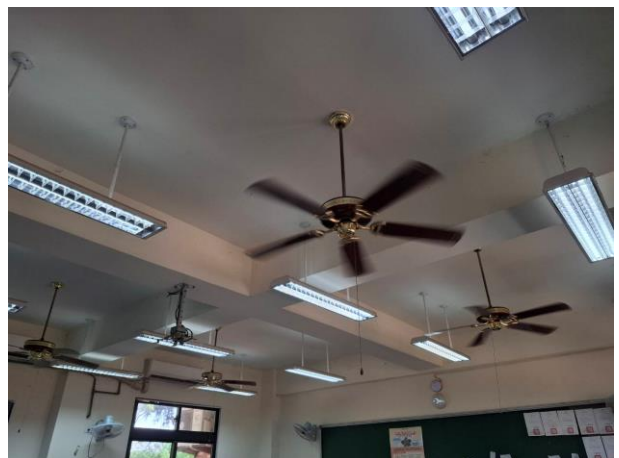
使用冷氣時搭配吊扇(壁扇)