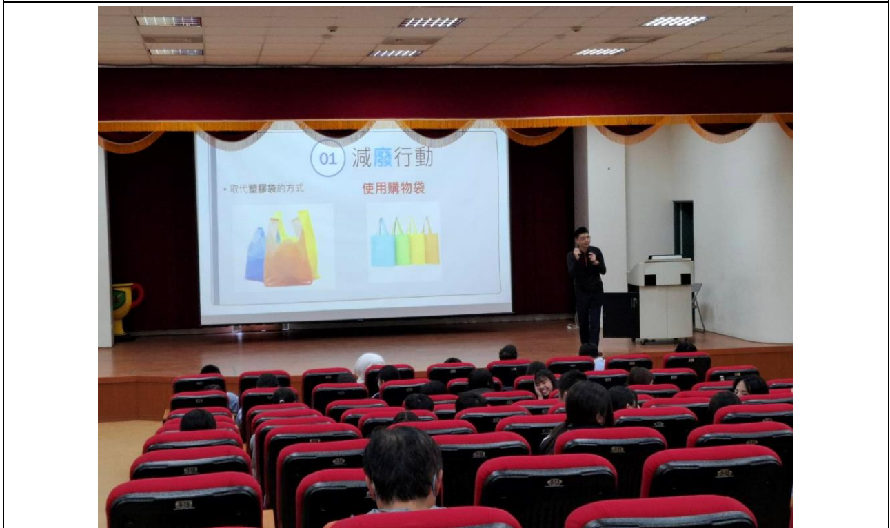
講師分享生活中如何進行綠色消費