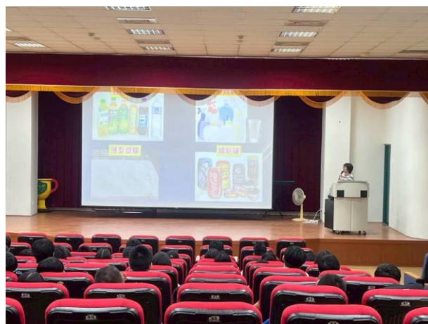
新生訓練時進行資源回收分類說明