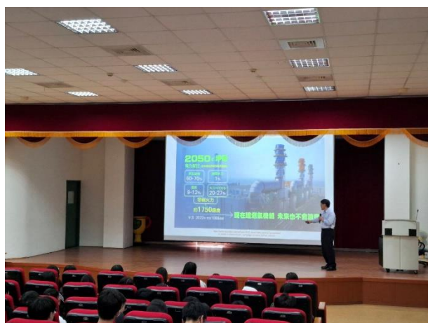
辦理淨零講座，講師說明再生能源利用與節能設備開發對減碳的影響