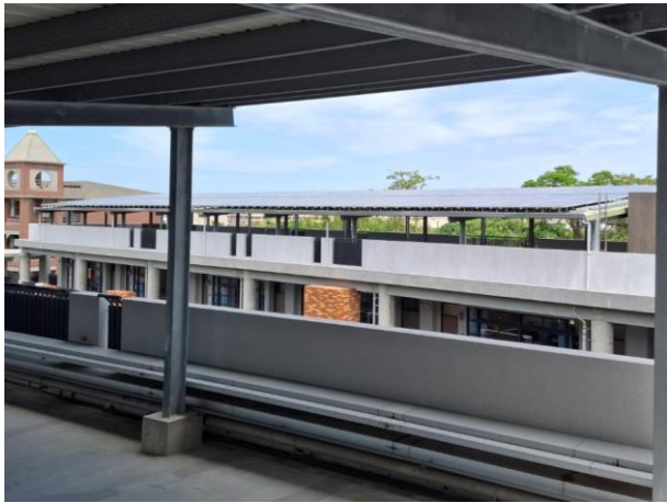
校舍建築屋頂鋪設太陽能板