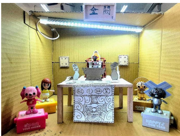
表藝課程—舞台模型製作 學生利用回收物製作舞台模型