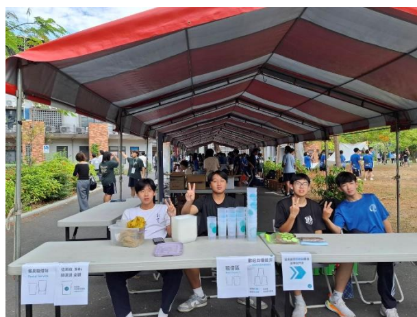
園遊會推行環保餐具的使用