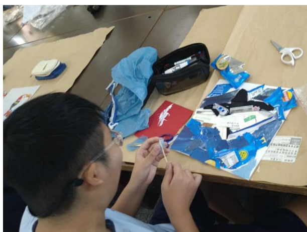
美術課程—動物方城市 學生利用回收物拼貼各種動物