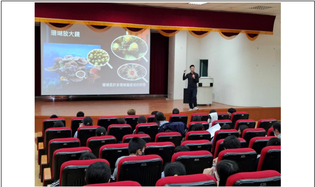
講師介紹海洋珊瑚生態