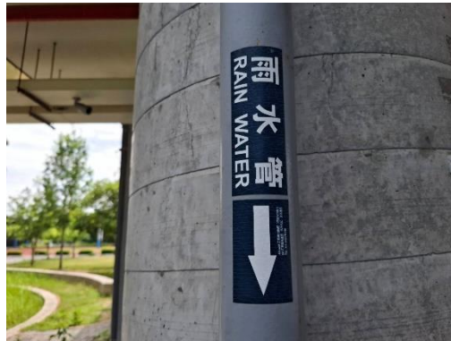
設置雨水回收裝置