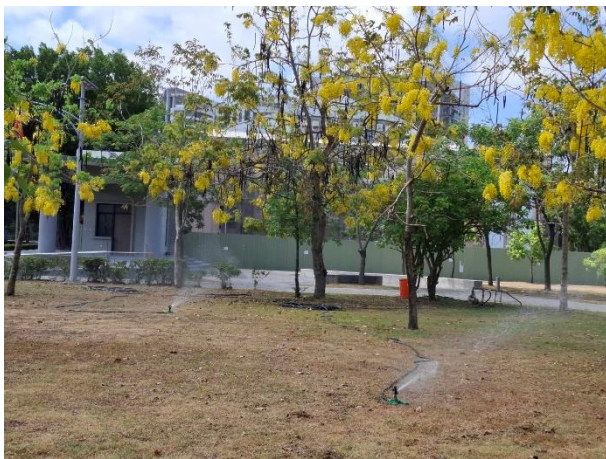
使用回收水澆灌植栽