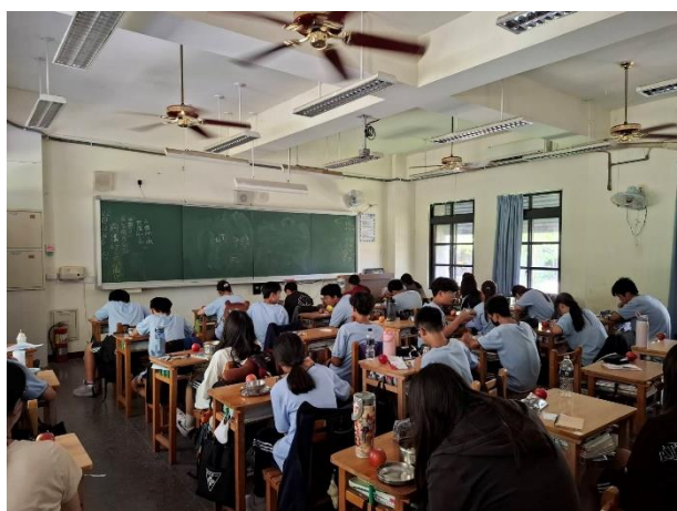
實施午餐關燈 1 小時措施