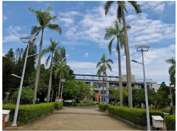
校門口路燈使用再生能源發電