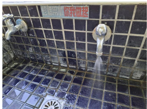
水龍頭裝置節水設備、張貼節水標語