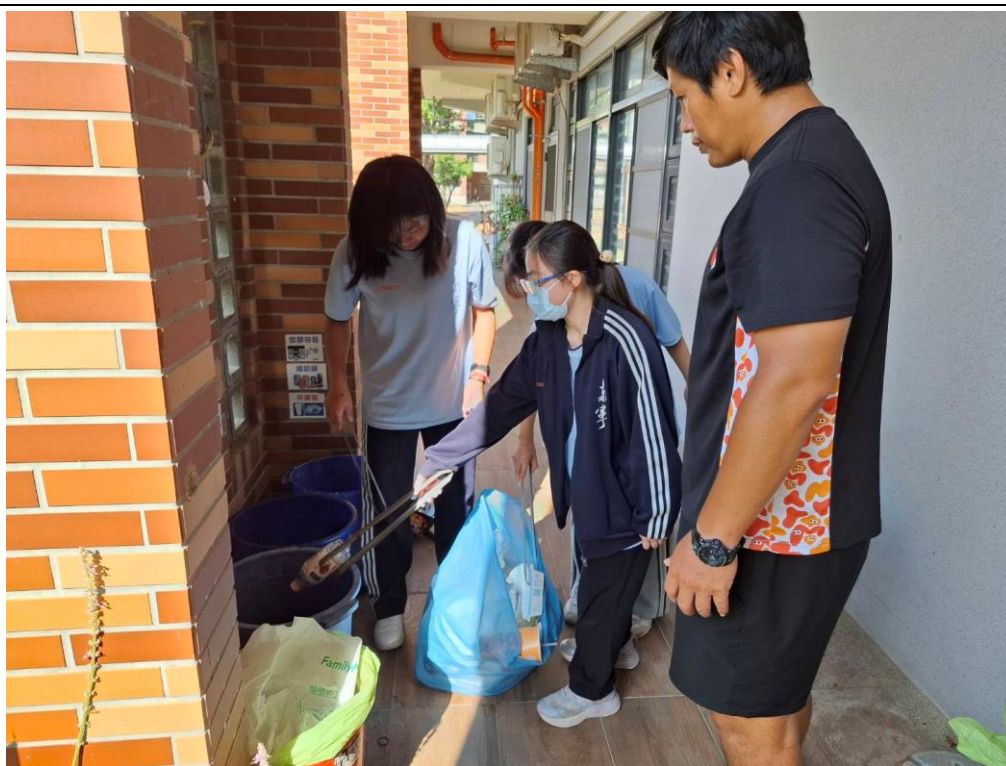
老師關心回收狀況，提醒學生要正確處理回收物，避免滋生傳染源。