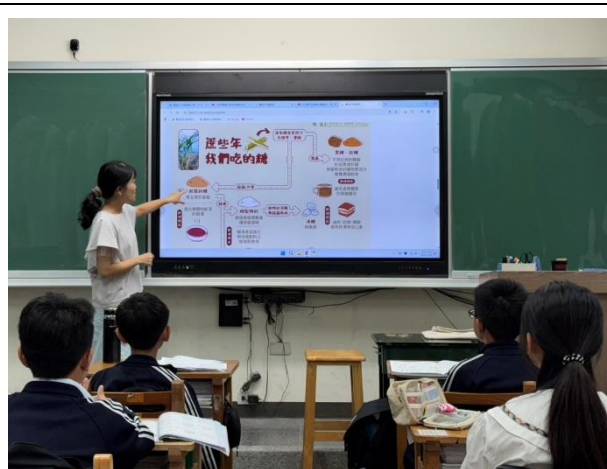
導師運用餐前5分鐘進行營養教育指導