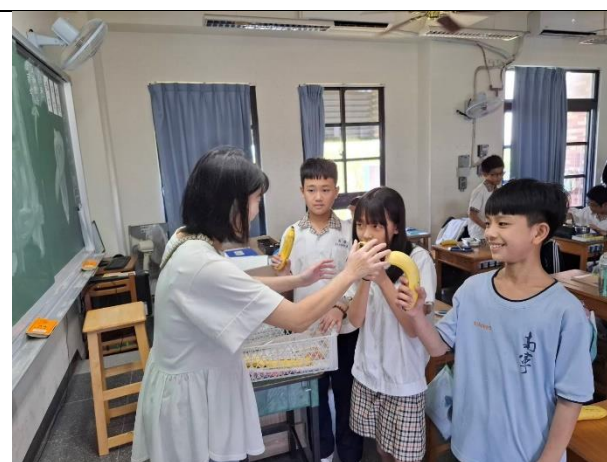
導師指導學生要均衡飲食，多吃蔬果