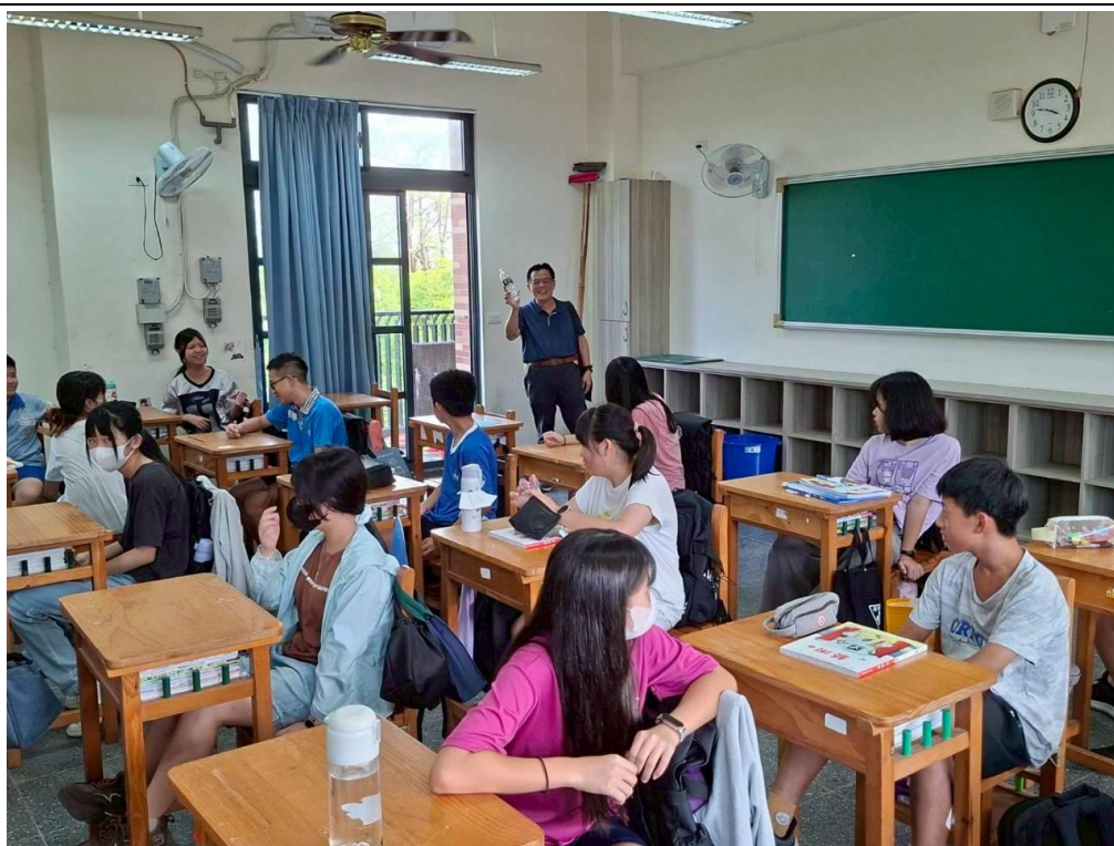
老師關心班級回收狀況，提醒學生要正確處理回收物，避免滋生傳染源。