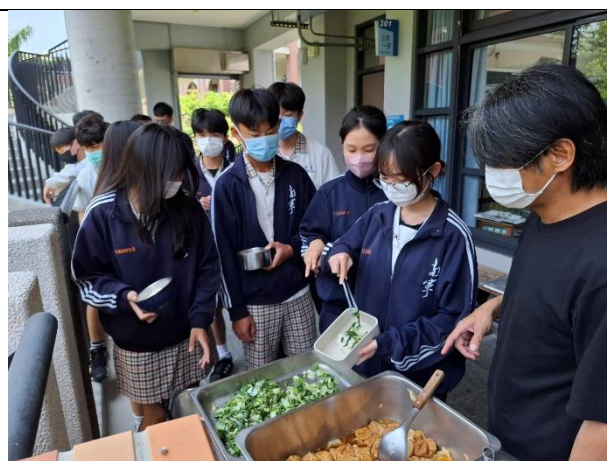
導師指導學生要均衡飲食，多吃蔬果