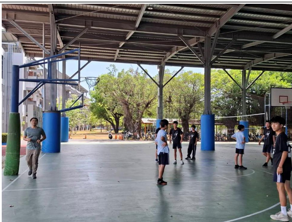
教師利用下課時間在光電球場跑步