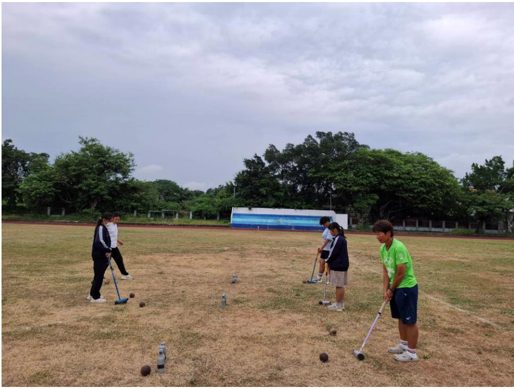
教師利用課後時間與學生在操場打木球