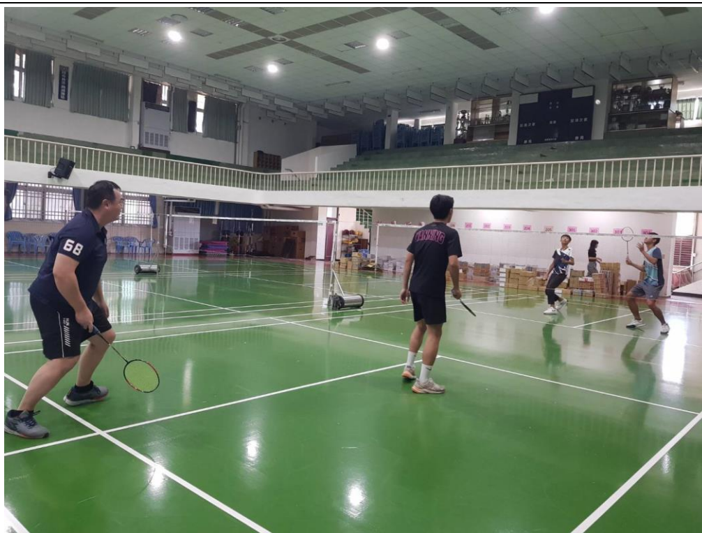
教師與學生一起進行羽球運動