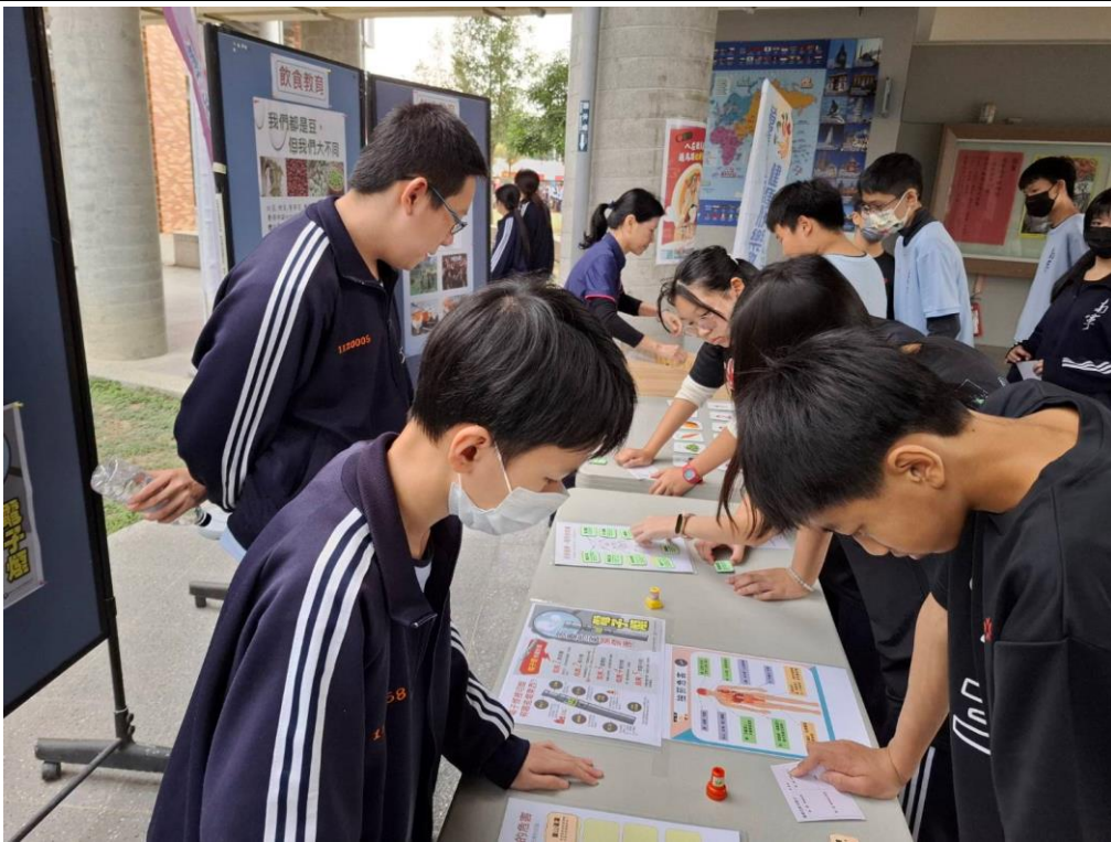
學生正在進行菸害知多少拼貼活動