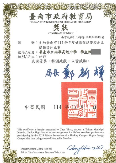
參加健康促進創意標語設計得獎同學獎狀