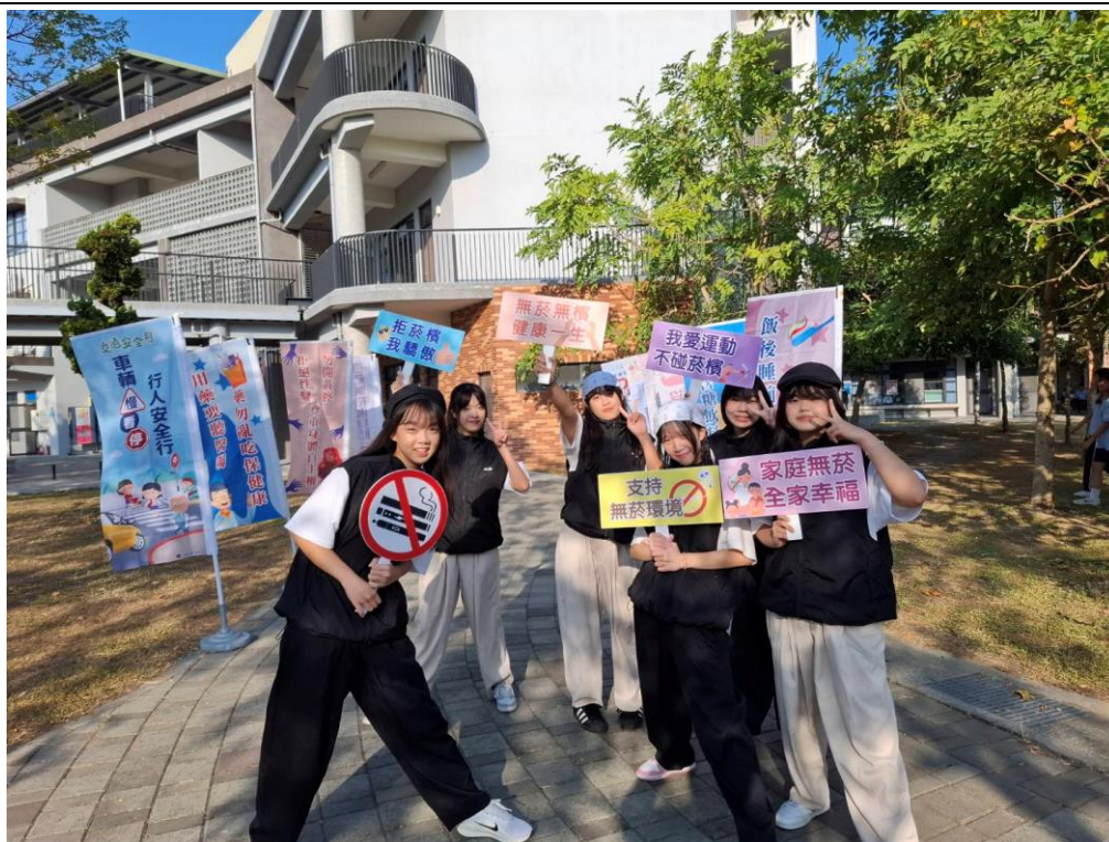
熱舞社同學擔任健康大使，宣傳菸檳危害