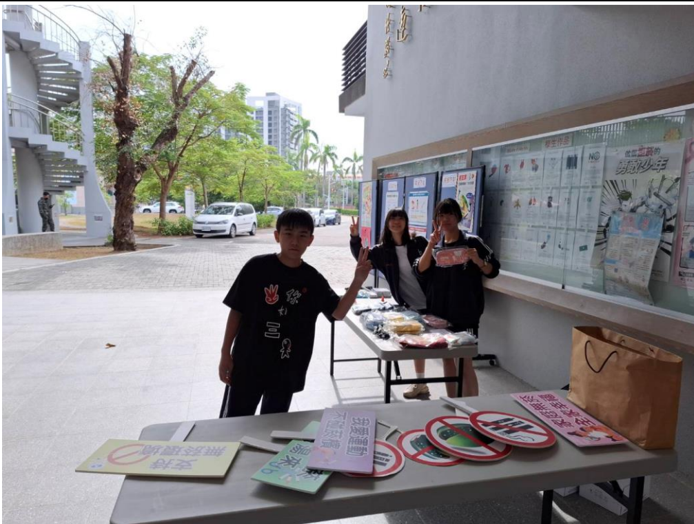
協助拒菸宣言活動及頒發獎品的志工學生