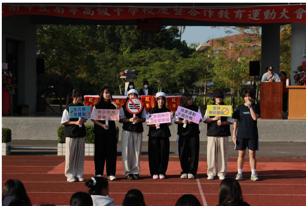
學生會會長發表健康宣言