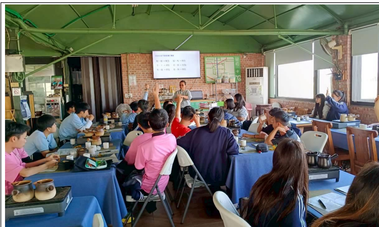
同學聆聽莊園的介紹