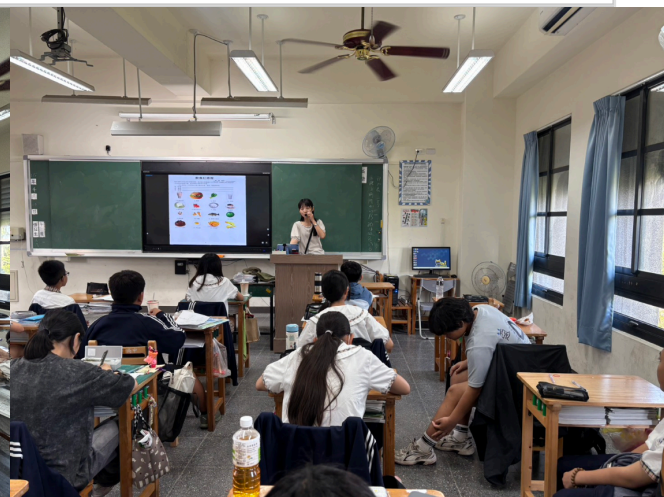
教師於教學活動中說明如何設計個人菜單