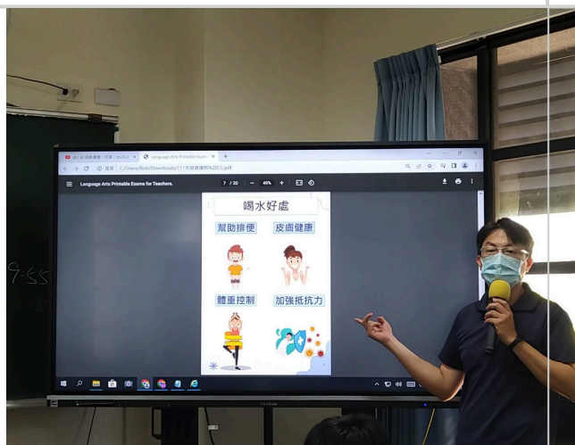
教師跟學生宣導正確的運動觀念