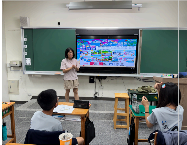
導師時間水域安全宣導