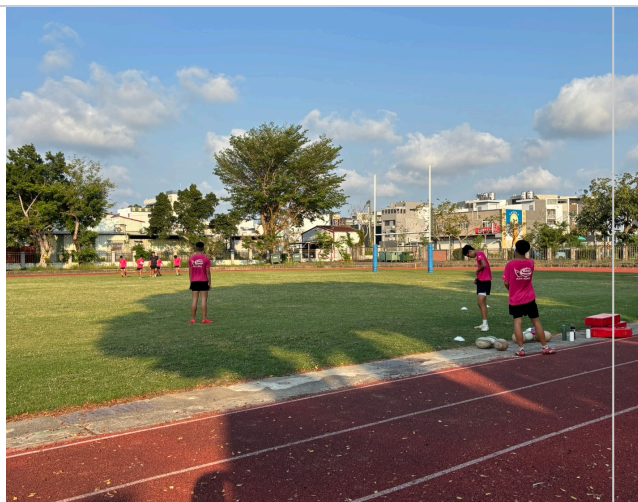
橄欖球隊於操場練習