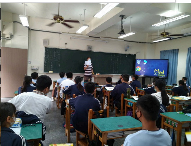
教師於班級跟學生說明健康護照如何填寫