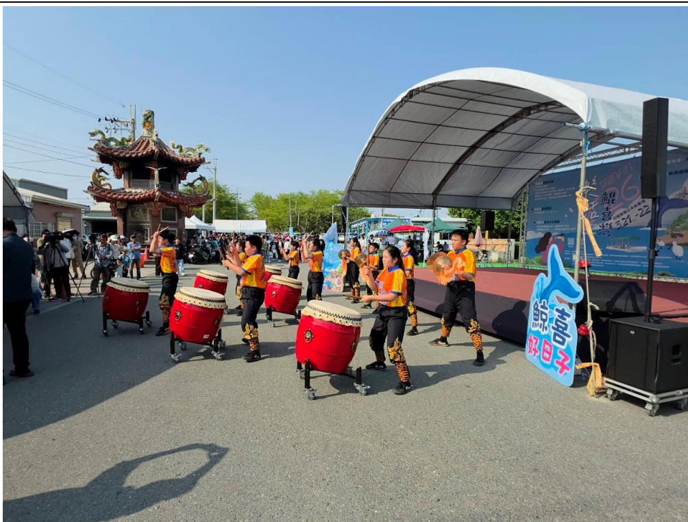
本校戰鼓隊學生表演

(二)參與南區區公所辦理之樂活鯤喜灣活動，響應文化傳承、環境永續及樂活健康的理念(115年3月)