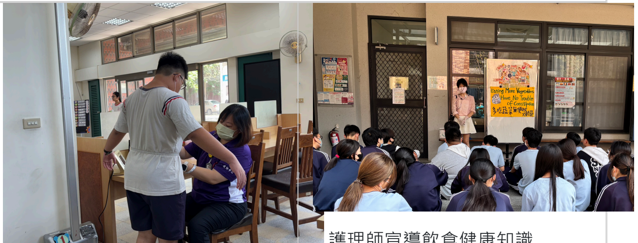
老師為學生量測腰圍