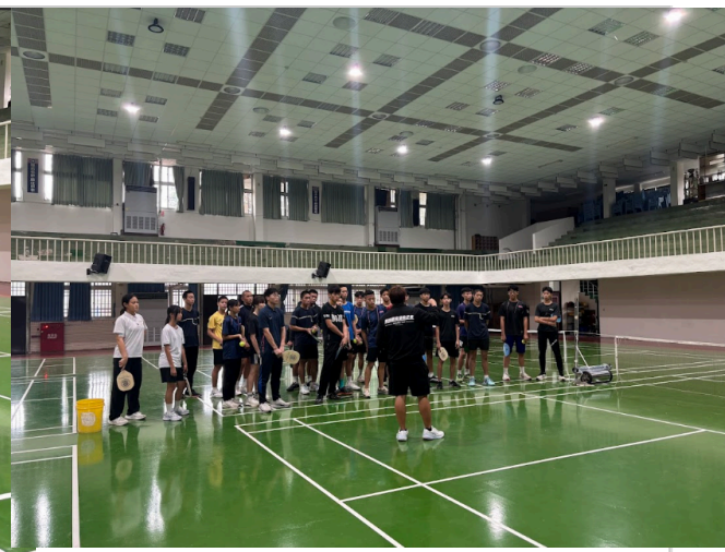
學生於體育研習活動，學習匹克球運動