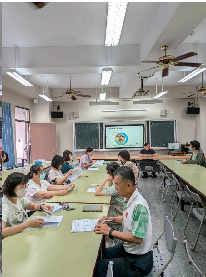
導師會報時水域安全宣導