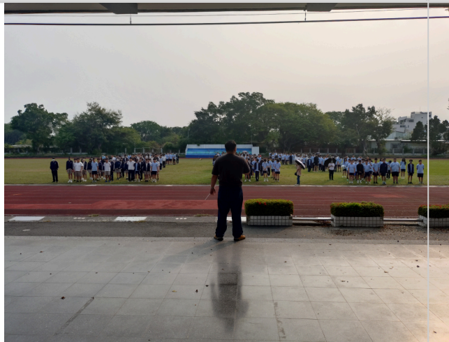
朝會時水域安全宣導