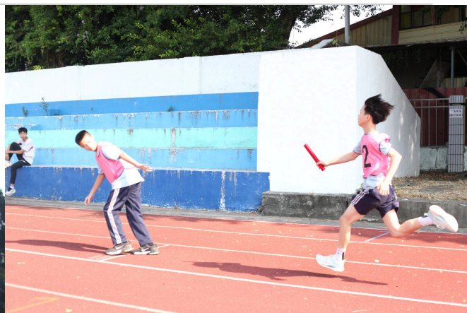
學生參與運動會大隊接力賽跑