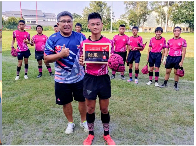
橄欖球隊參與114台南市長盃得獎照片