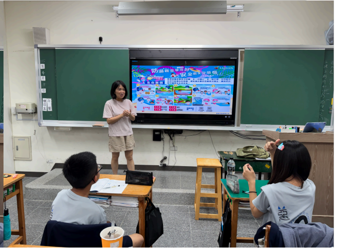
導師時間水域安全宣導