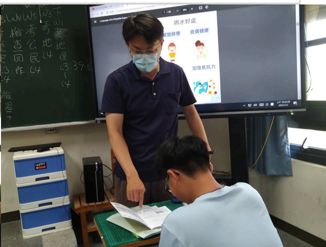
教師於班級指導學生填寫健康護照