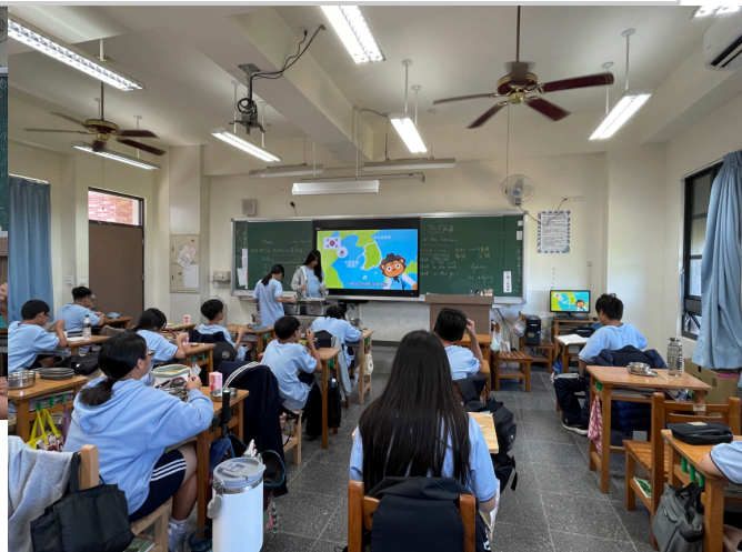
學生於午餐時間觀看餐前五分鐘知識