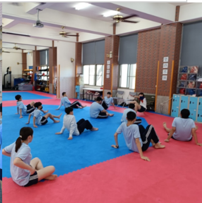
跆拳道社於道館練習