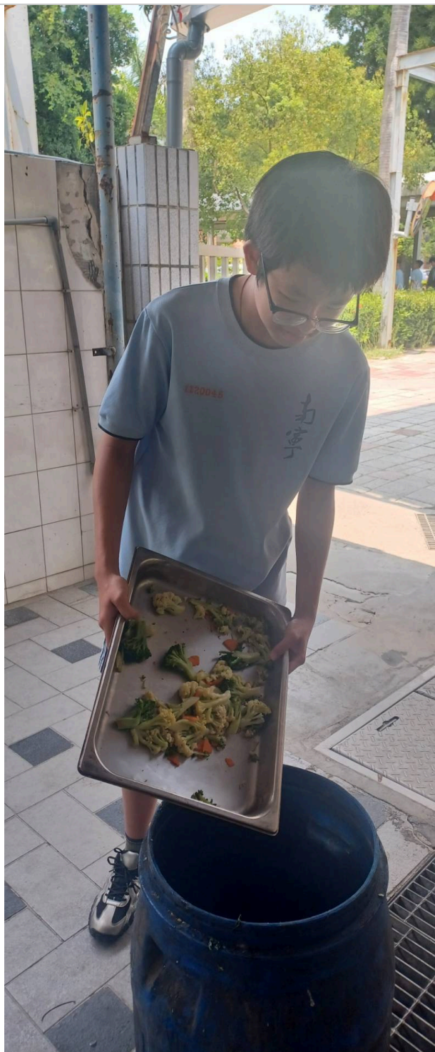
蔬菜就~沒關係我們繼續努力