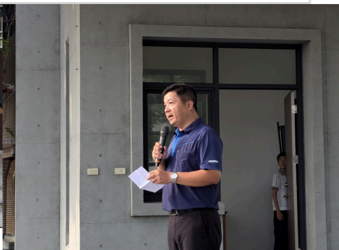
校長於朝會時加強宣導運動的重要性