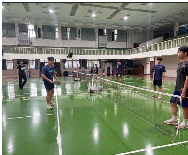
學生於體育研習活動，學習匹克球運動