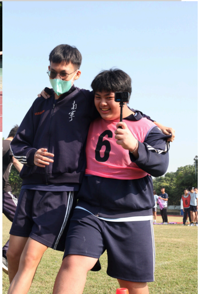
學生於校慶運動會，兩人三腳競賽