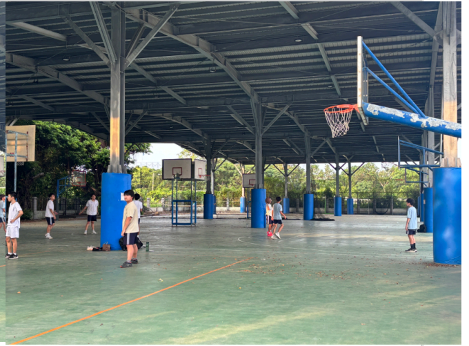
學生運用課餘時間，在籃球場打球