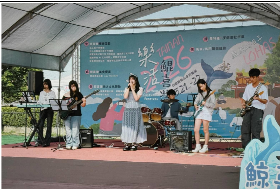
本校熱音社學生表演