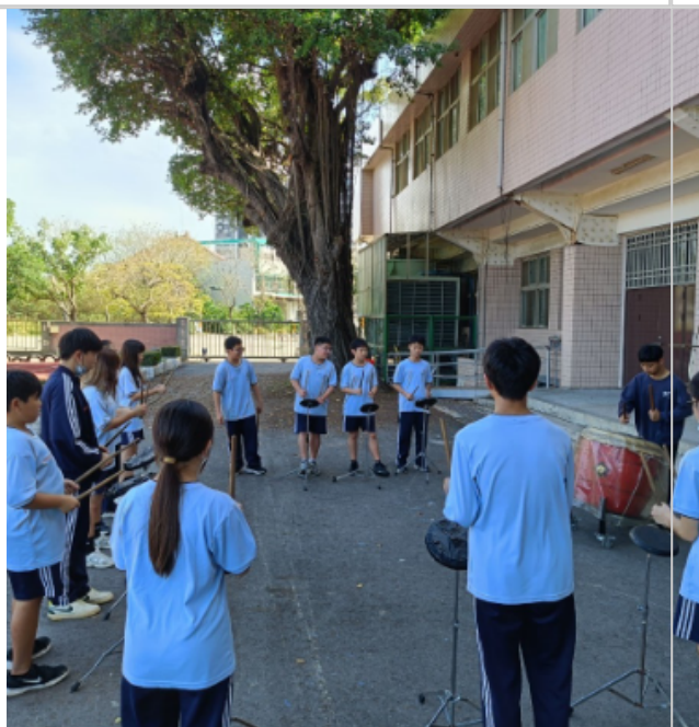
戰鼓隊於教室旁練習