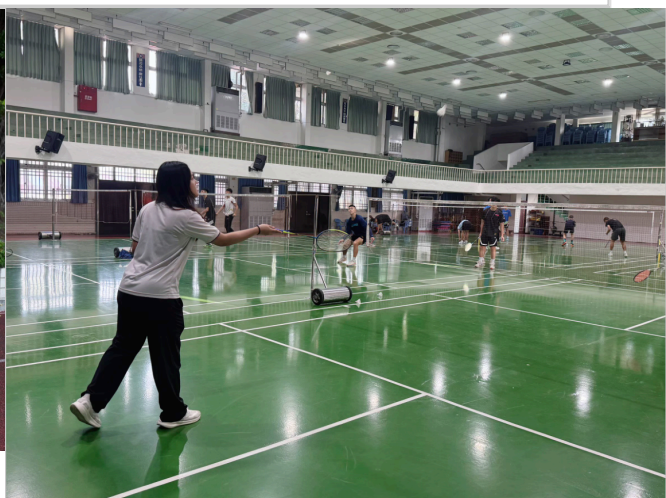
學生於課後使用運動器材(羽毛球)