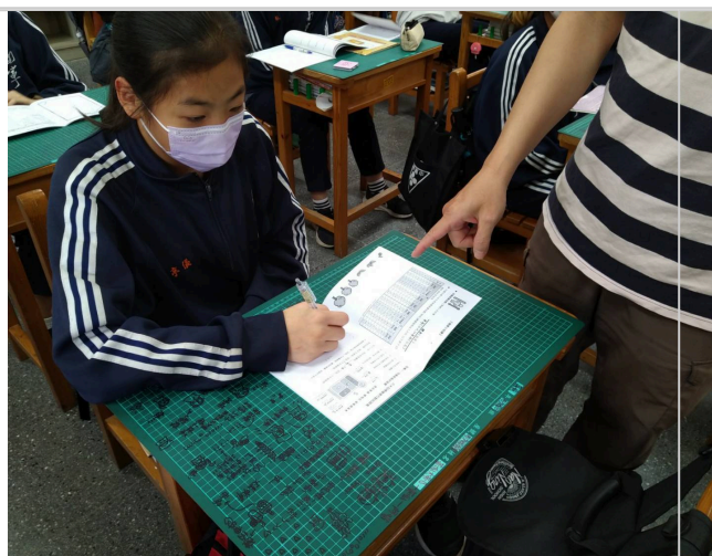
教師於班級指導學生填寫健康護照