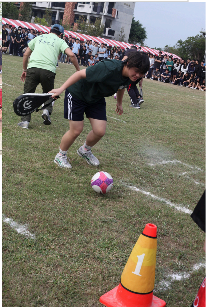
學生參與運動會趣味競賽