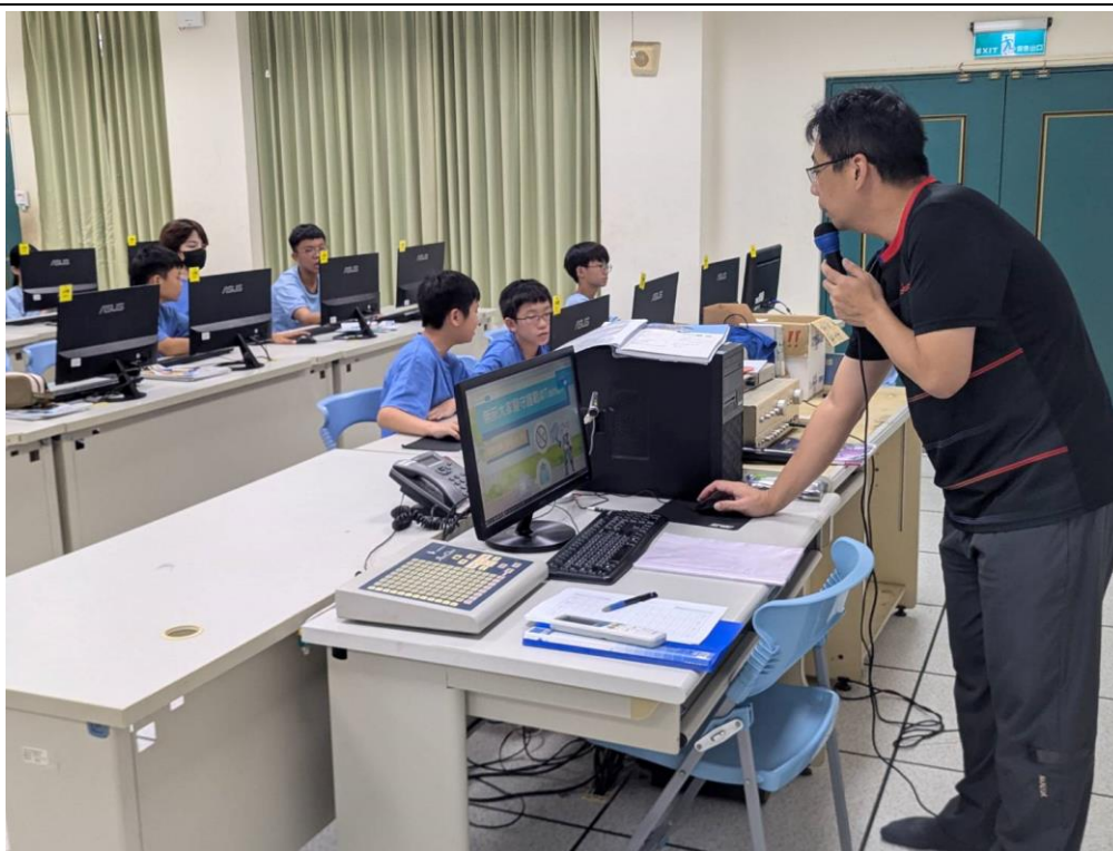
資訊老師說明「無菸大家醫守護戰@Tainan」線上活動的參與步驟