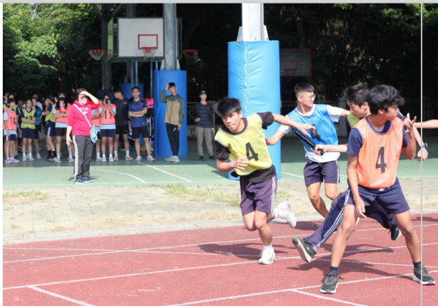
學生於校慶運動會，大隊接力競賽