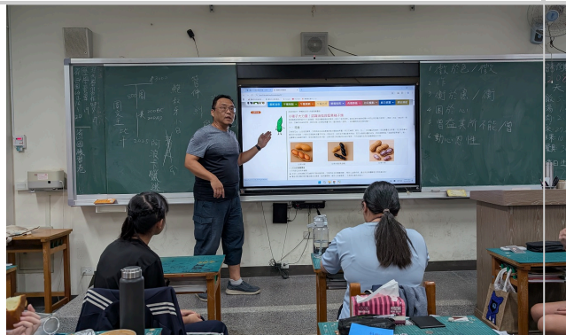
導師於午餐時間講解餐前五分鐘專欄