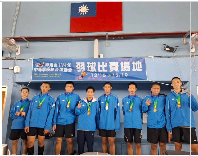
羽球隊參與114台南市中運得獎照片