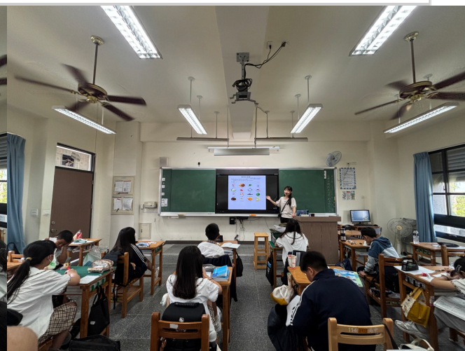
教師於教學活動中介紹食品的營養概念