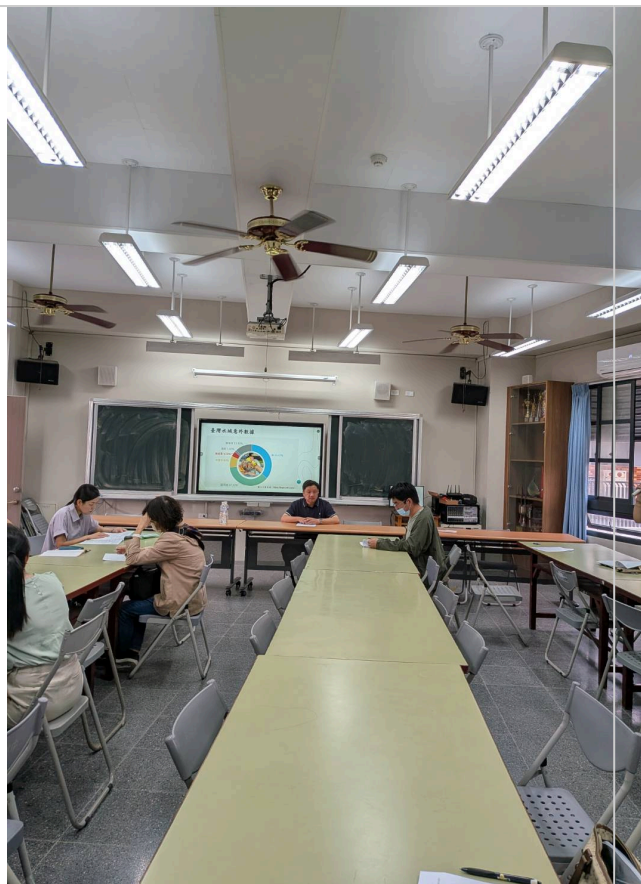
導師會報時水域安全宣導