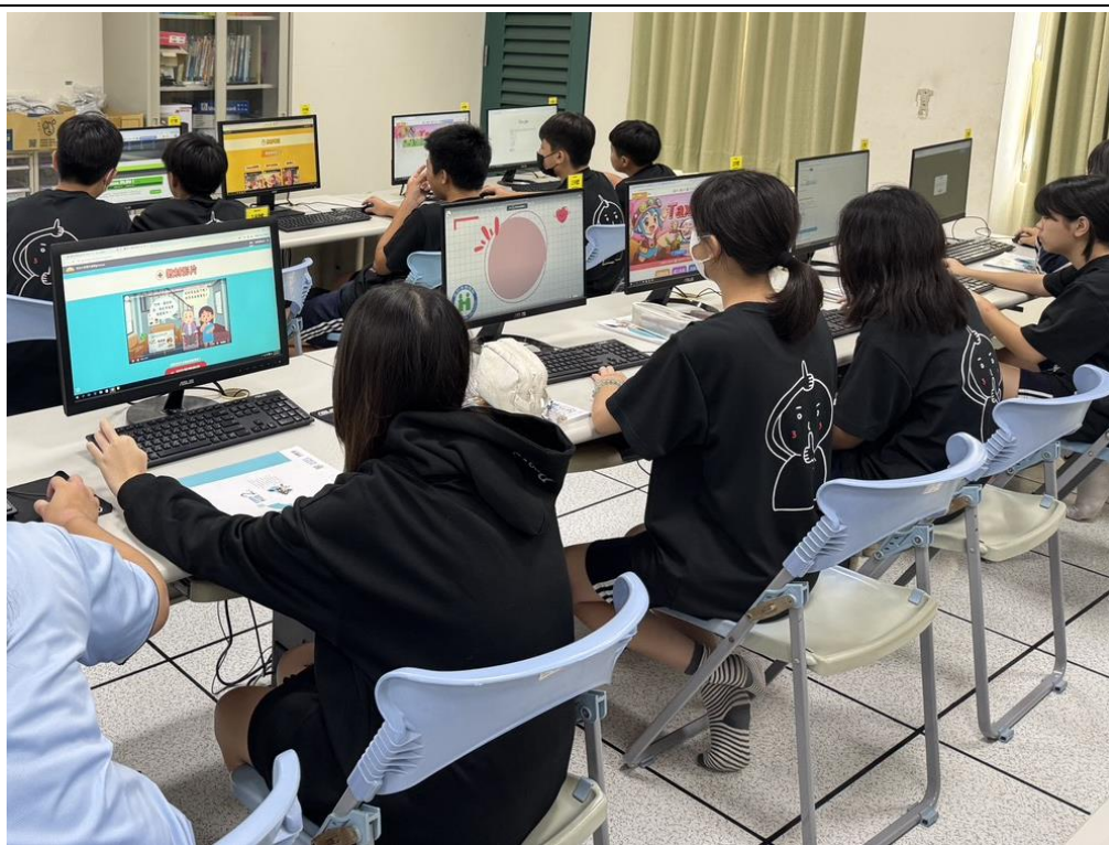
學生進行「無菸大家醫守護戰@Tainan」線上活動