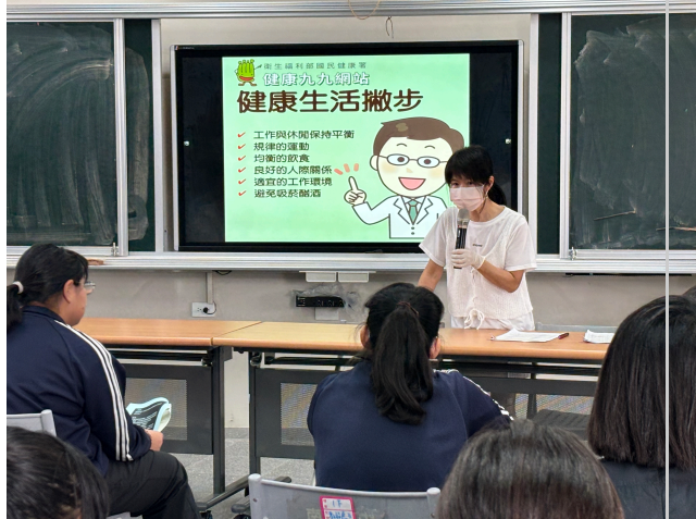
護理師宣導健康生活撇步