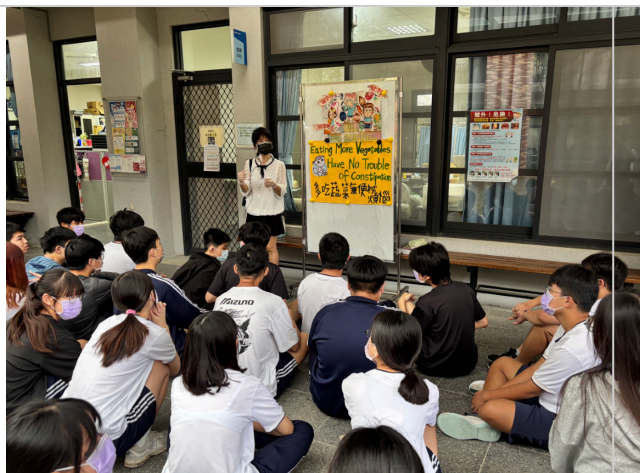
護理師宣導活動提倡飲食均衡