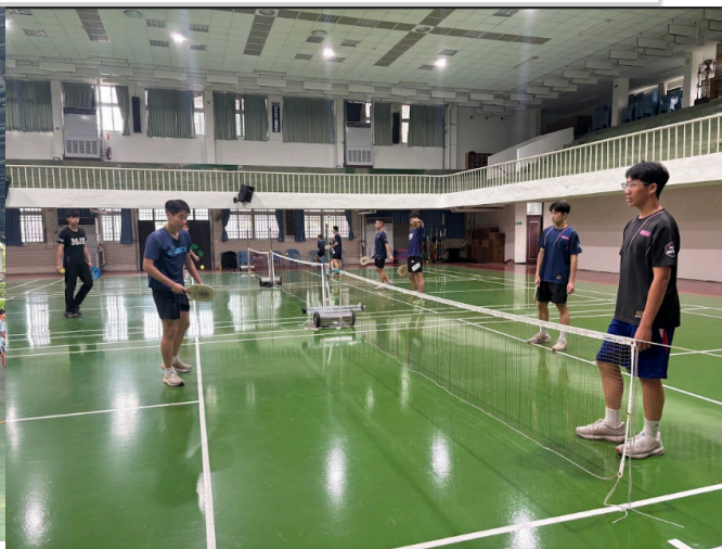
學生於下課時間自主進行球類運動