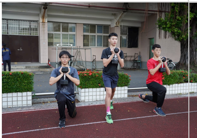
學生於課後使用運動器材(啞鈴)