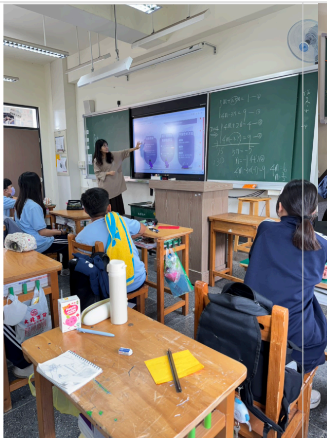
導師於午餐時間講解餐前五分鐘圖表