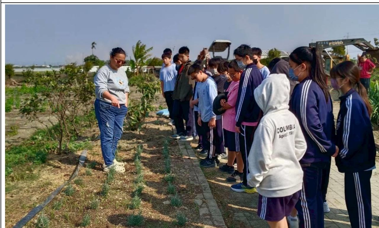
同學實地參觀莊園內農地的植物