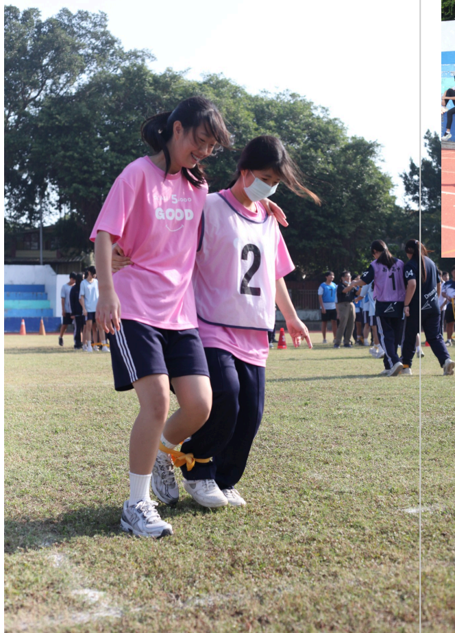
學生參與運動會兩人三腳