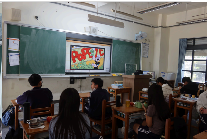
學生於午餐時間觀看餐前五分鐘影片