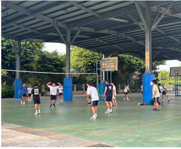
學生運用課餘時間，在籃球場打球