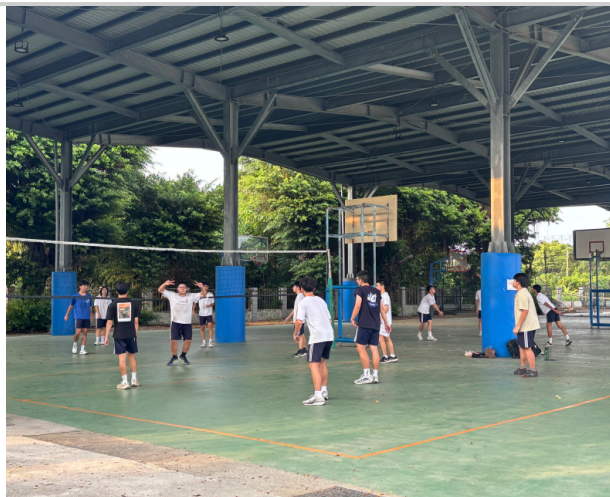
學生於下課時間自主進行球類運動