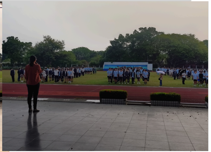
朝會時水域安全宣導