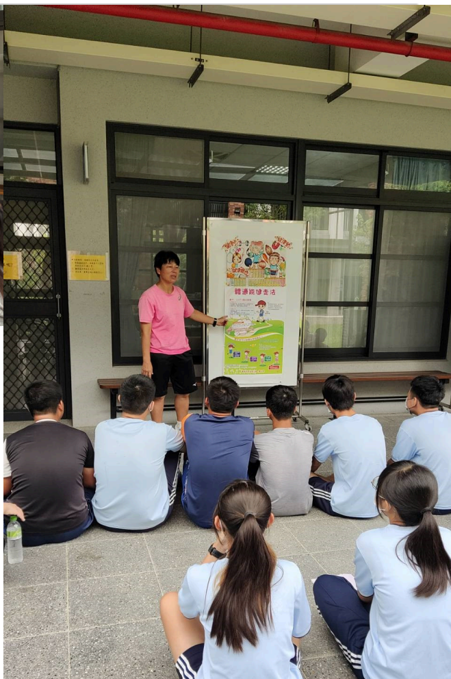
體育老師於健體課講解體適能健步法