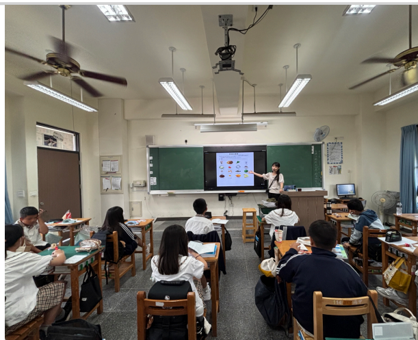
教師於教學活動中舉例食品指標