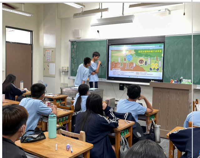
學生於午餐時間學習分享餐前五分鐘知識