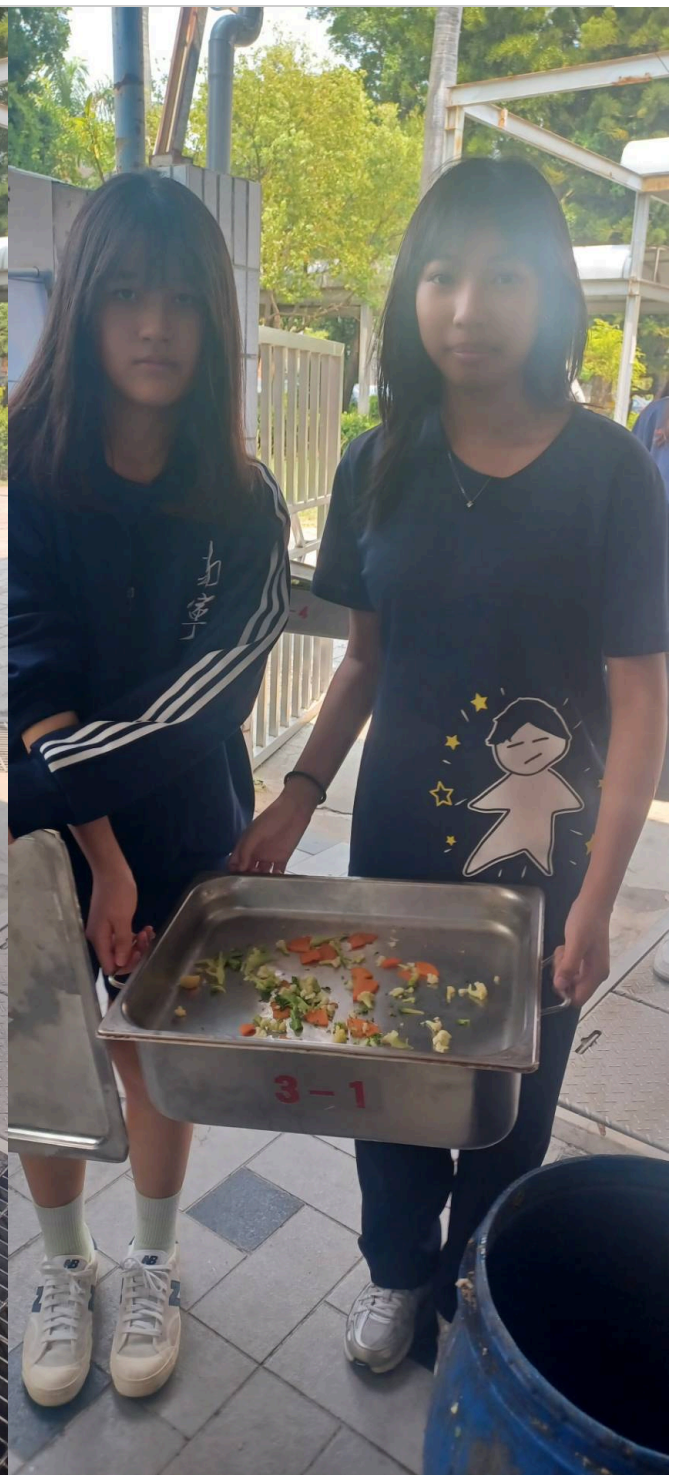
蔬菜剩餘量也是有在降低啦