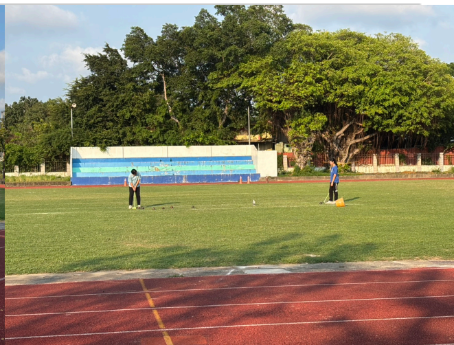
木球隊於操場練習