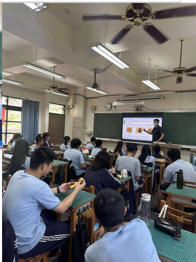
教師於健康課堂講解餐前五分鐘飲食知識