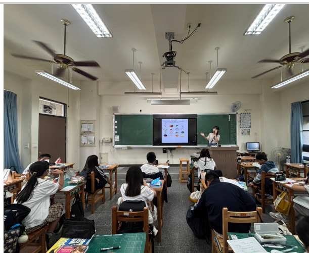
教師於教學活動中講述食品種類