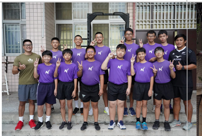
學生參與多元運動性社團-橄欖球隊