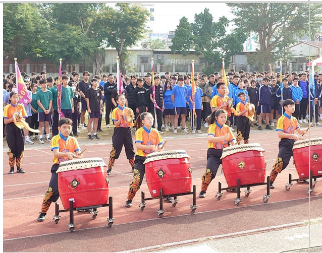
學生參與運動會戰鼓隊表演