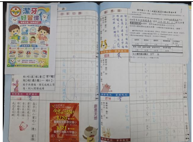
說明: 口腔保健宣導