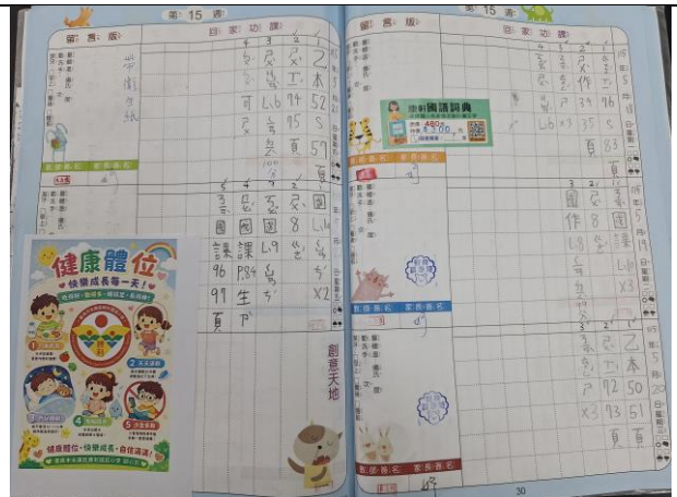
說明: 健康體位宣導