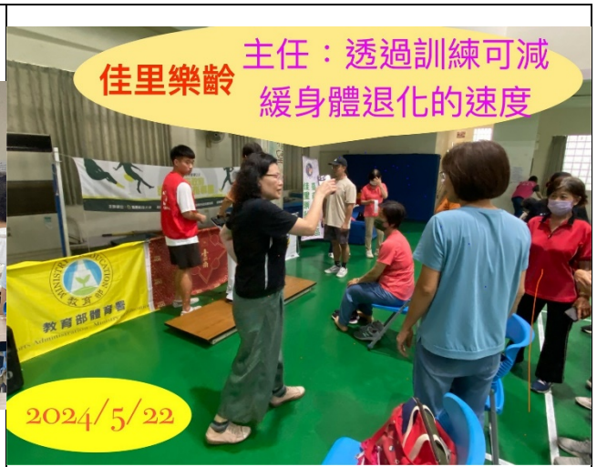
邀請樂齡人士推動各項健康促進議題活動