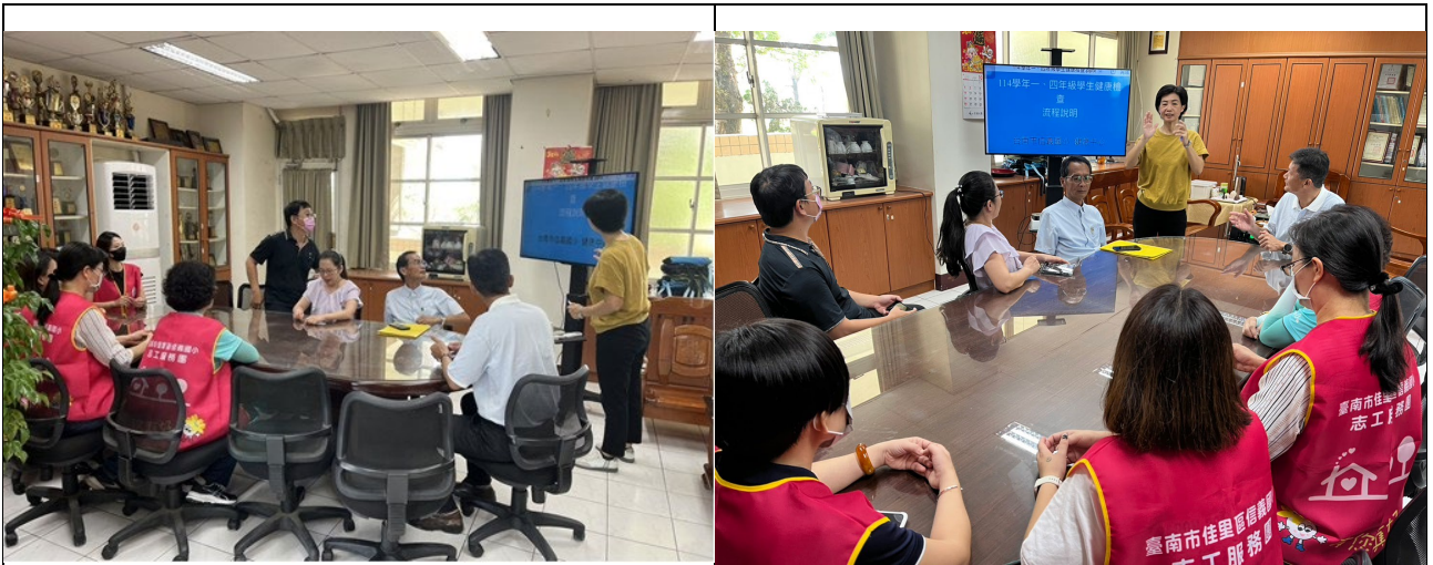
召開學生健康檢查活動協助說明會，邀請社區人士志工夥伴說明進行細節