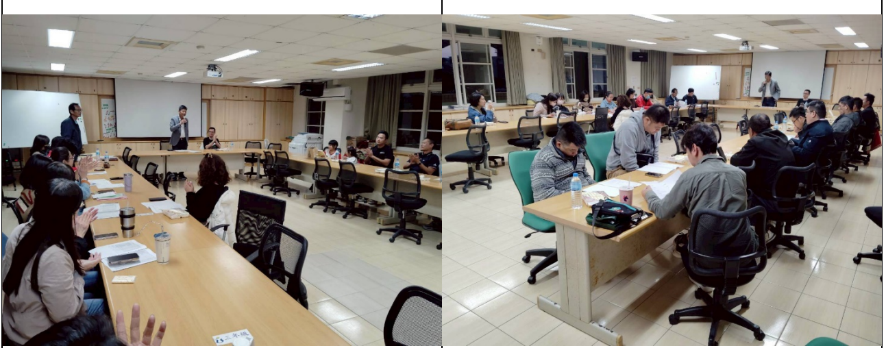
召開健康促進活動會議，請家長參加，會中說明活動內容，共同推動學校健康促進議題