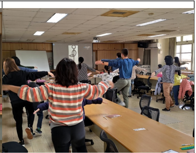
辦理親子工作坊：正念玩教養，推動健康的心靈與教養