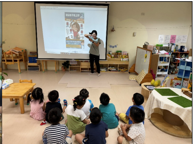
幼兒園班親會敲請家長參與說明健康促進議題