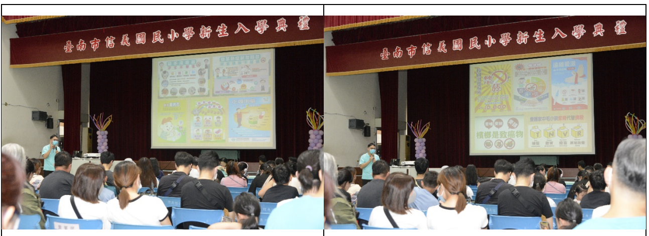
透過班親會宣達健康促進活動推行項目與做法