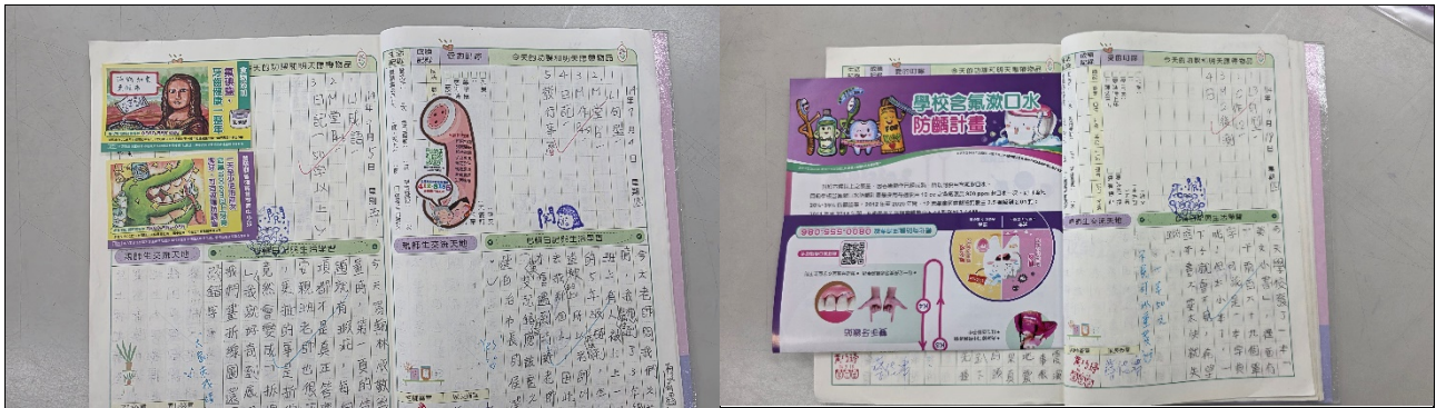
利用聯絡簿傳達口腔保健家庭教育等資訊