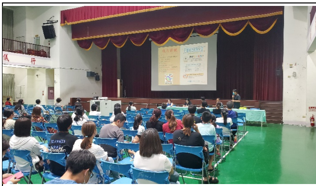
利用親師座談倡議健康促進學校的重要性