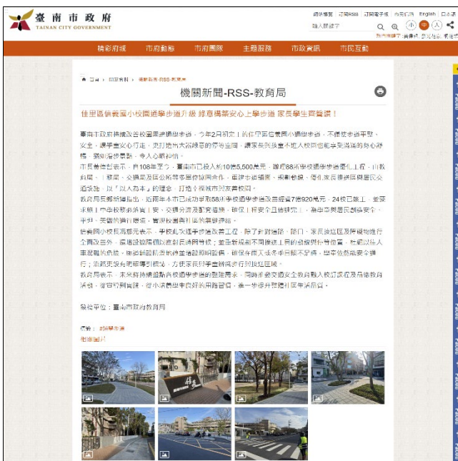
透過教育局發布學校健康環境資訊