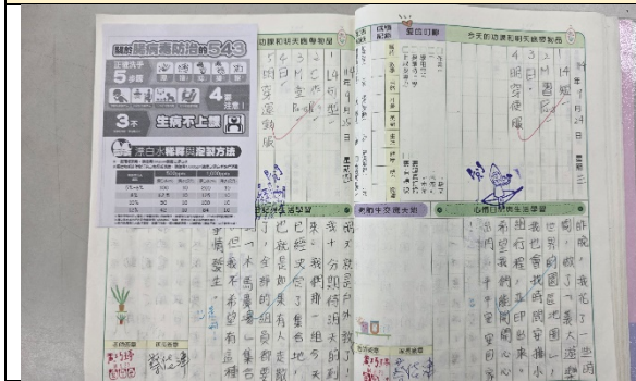
利用聯絡簿傳達腸病毒防治健康資訊