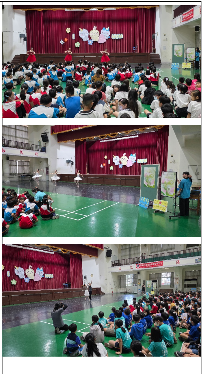
在學校臉書傳達芭蕾舞藝術偏鄉巡迴培養陶冶鑑賞美的健康心靈