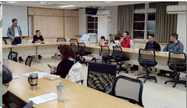
召開家長會座談說明學校健康促進的策略