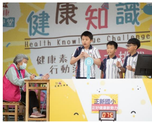
說明：比賽前各項健促主題練習