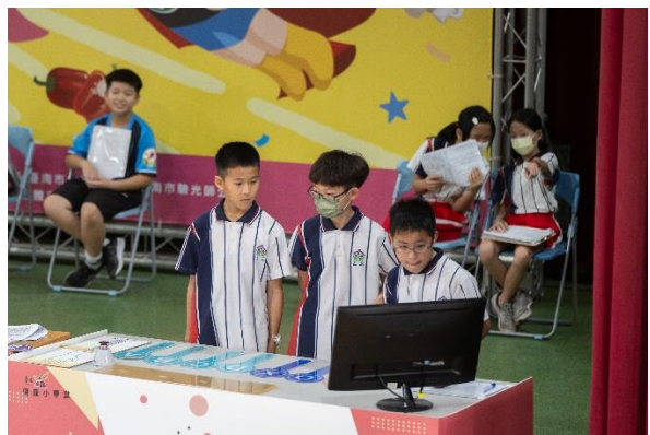
說明：正好健康新生活隊(初賽)