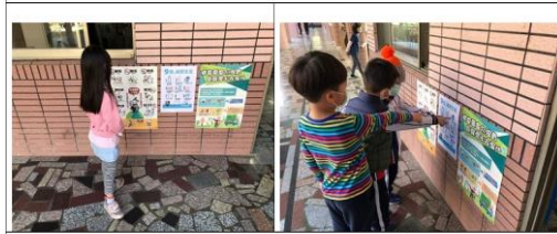
在辦公室牆面張貼相關文宣以宣導資源回收類別