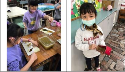
自然領域教導孩子用樹葉做書籤