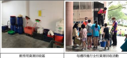
廚房用資源回收區