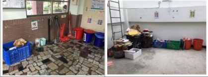
辦公室設置資源回收區