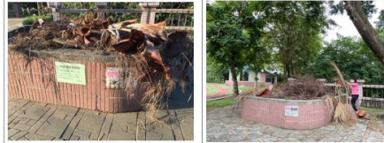
校園樹枝落葉集中管理，再請清潔隊協助夾取處理。