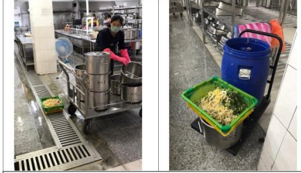
午餐廚餘由鄰近養豬戶回收利用，杜絕浪費。