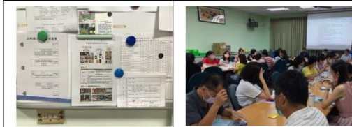
辦公室張貼減少使用免洗餐具及包裝飲用水作業指引相關措施文宣