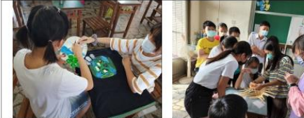
藝術人文領域教導孩子賦予舊衣新生命