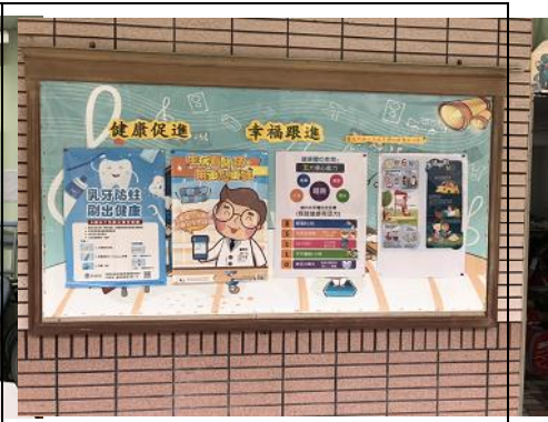
說明：走廊上張貼健促相關資訊