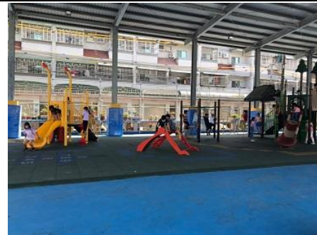
說明：學生到遊戲區玩耍。