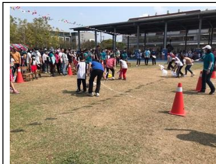
說明：親子趣味競賽-雞飛狗跳