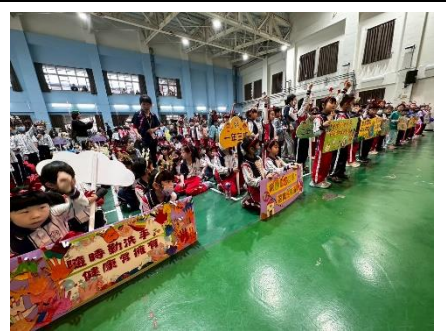
說明：校慶嘉年華各班製作相關標語