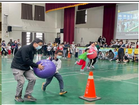
說明：親子趣味競賽-帶球折返跑