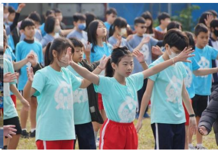
說明：校慶嘉年華前健康操練習