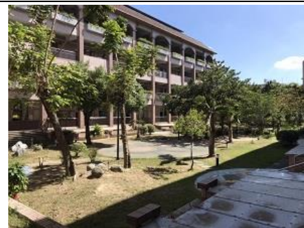
說明：美化校園，讓師生可放鬆身心。