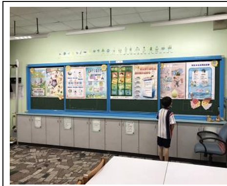
說明：健康中心張貼健促相關資訊。