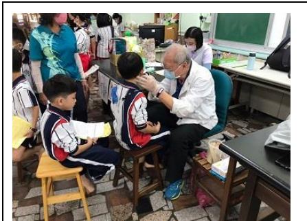
說明：醫療院所到校實施一、四年級健康檢查。