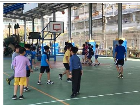
說明：學生至球場打籃球。