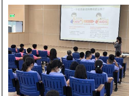
說明：愛滋病衛教宣導。