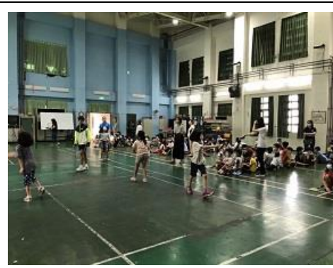
月主題：低年級羽球賽