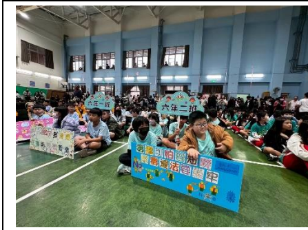
說明：校慶嘉年華各班製作相關標語