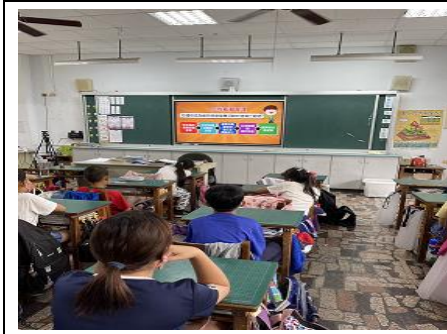
說明：口腔保健影片宣導