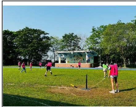
月主題：高年級樂樂棒球