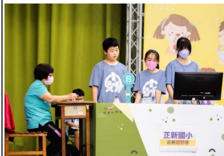
說明：帶學生參加健康知識大挑戰