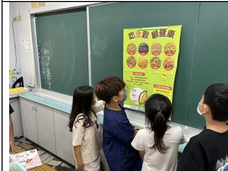
說明：辦理健康吃快樂動-吃全穀顧健康