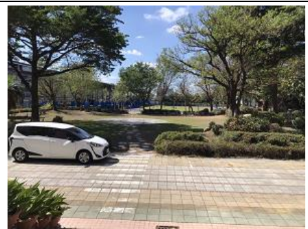
說明：綠化校園，讓師生感到療育。