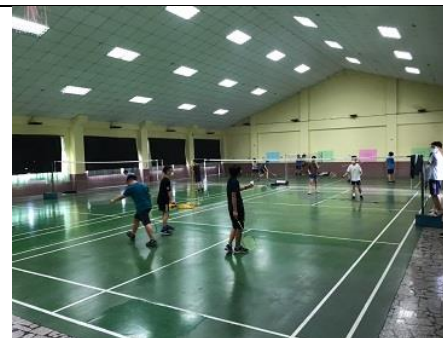
說明：學生下課至球場打羽球。