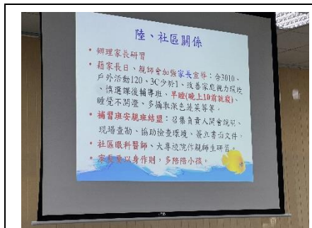
說明：衛生所長蒞校宣導健康講座。