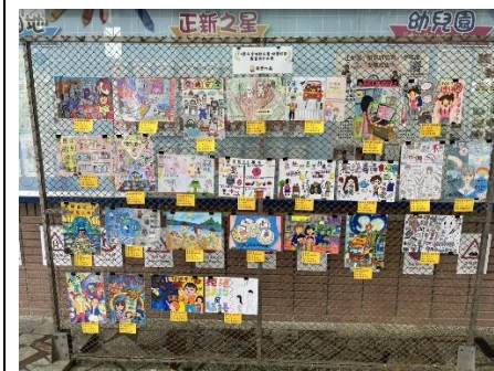
說明：辦理推動友善健康校園圖畫比賽。