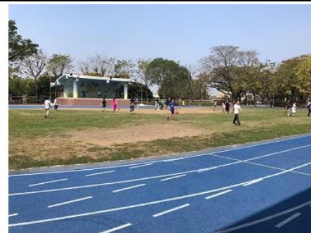
說明：學生下課到操場追逐。