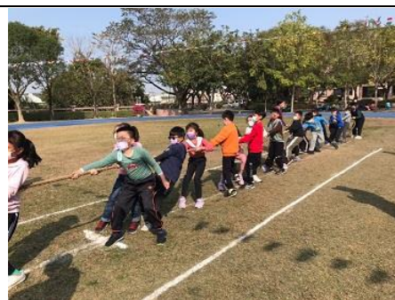
說明：校慶週，拔河比賽。