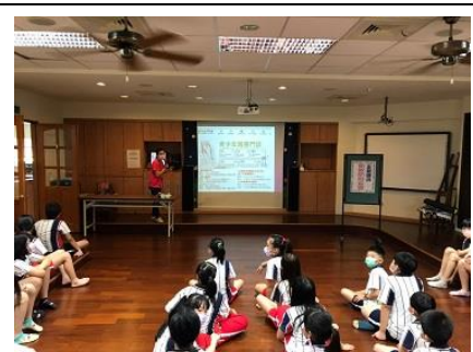
說明：宣導青少年就醫門診相關訊息。