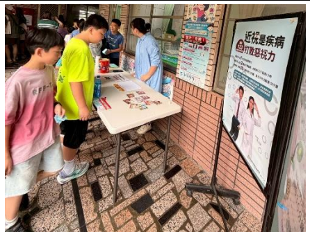
說明：兒童節辦理視力保健闖關活動