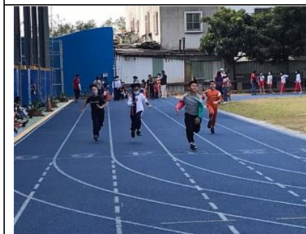
說明：校慶週，班級賽跑比賽。