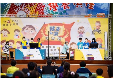
說明：帶學生參加健康知識大挑戰