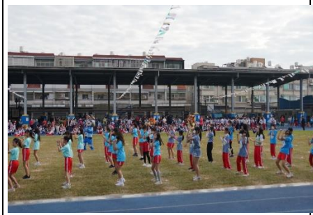
說明：校慶嘉年華前健康操練習