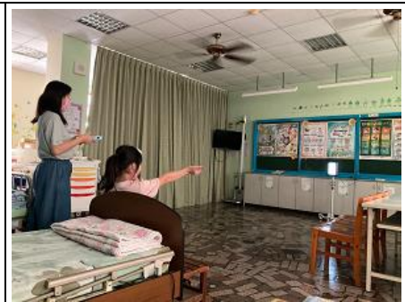
說明：校護每學期執行例行性的視力檢查