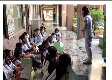
說明：醫療院所說明健康檢查注意事項。