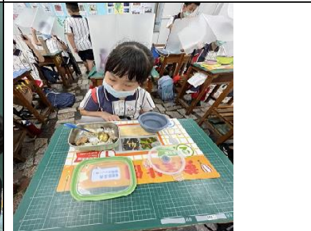
說明：辦理健康吃快樂動-黃金比例餐點