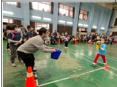
說明：親子趣味競賽-我丟你接