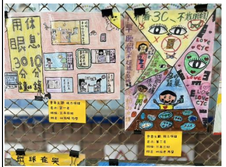
說明：圖畫比賽三年級主題為視力保健