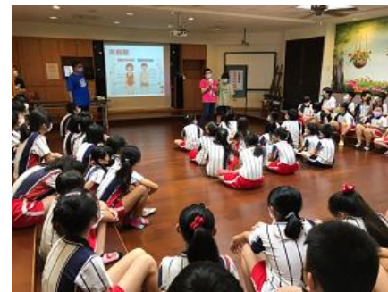
說明：宣導男女生的性別特徵。