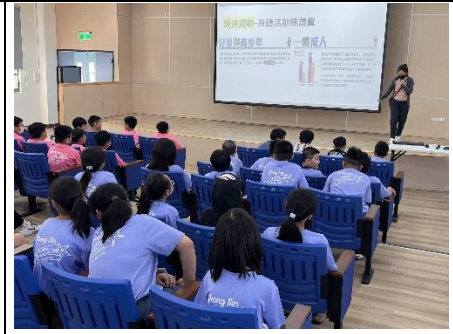
說明：健康體位宣導