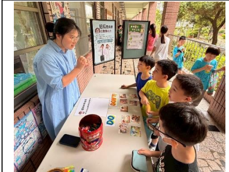
說明：兒童節辦理視力保健闖關活動