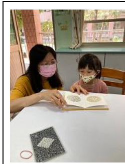
說明：校護每學期執行例行性的視力檢查