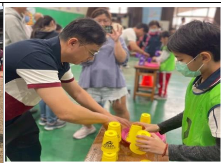
說明：親子趣味競賽-疊杯快手