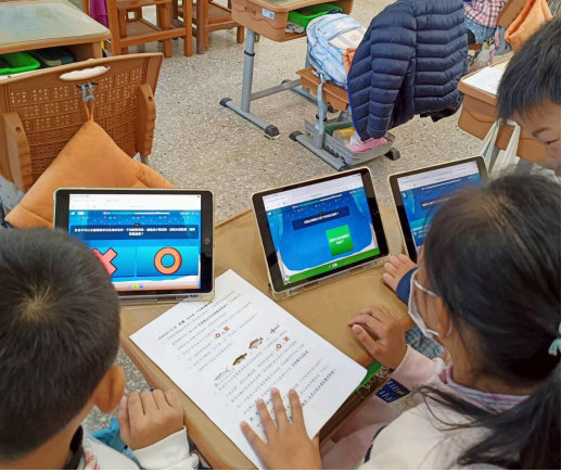
食品安全/多元飲食教學