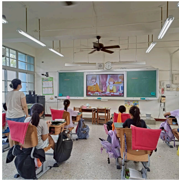
加工食品影片宣導