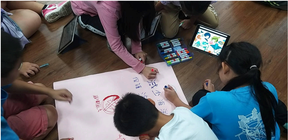
海洋議題海報繪製