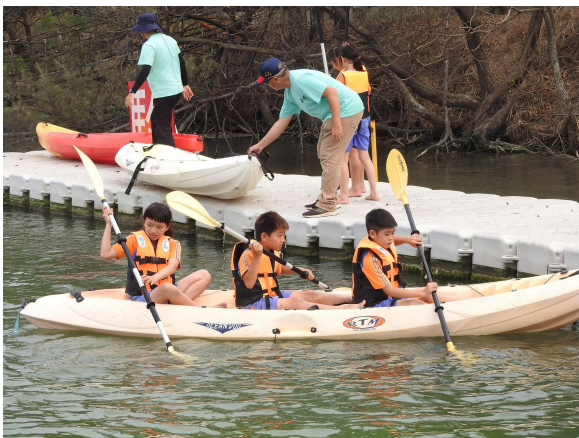
戶外教育-划槳體驗