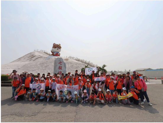
戶外教育-七股鹽山/潟湖乘船活動