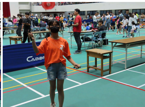
參與superstar民俗體育競賽