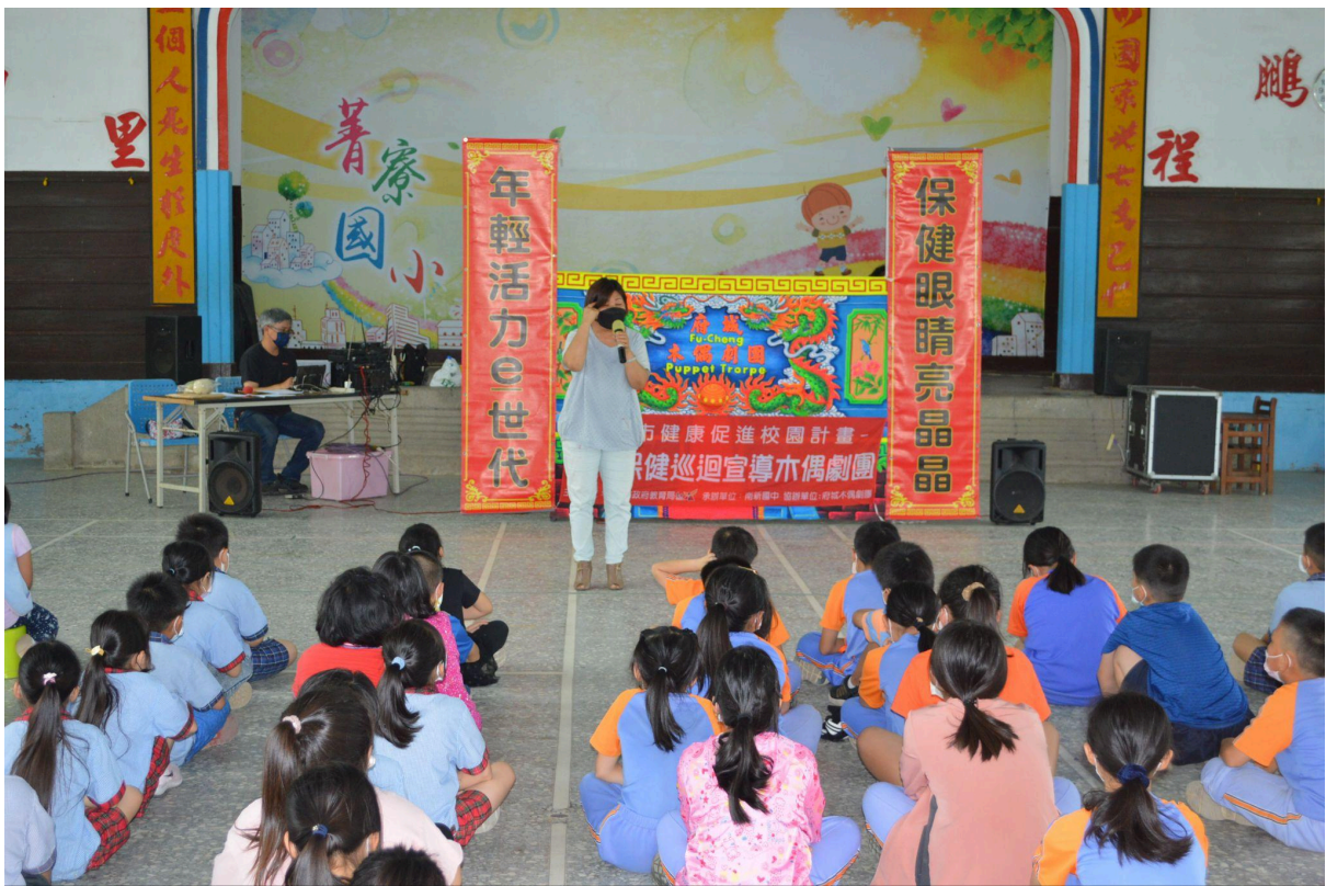
視力保健校園巡迴偶戲