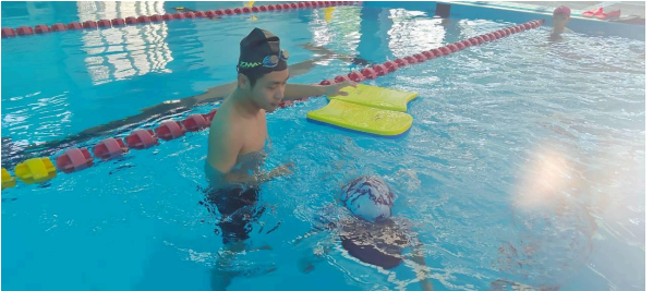
暑期游泳教學，並結合防溺安全指導。