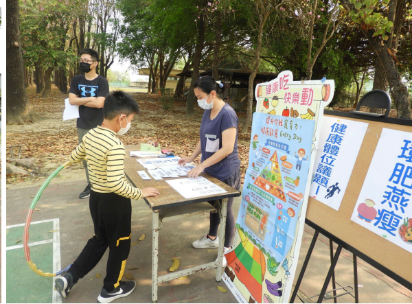
運動會結合健康小學堂